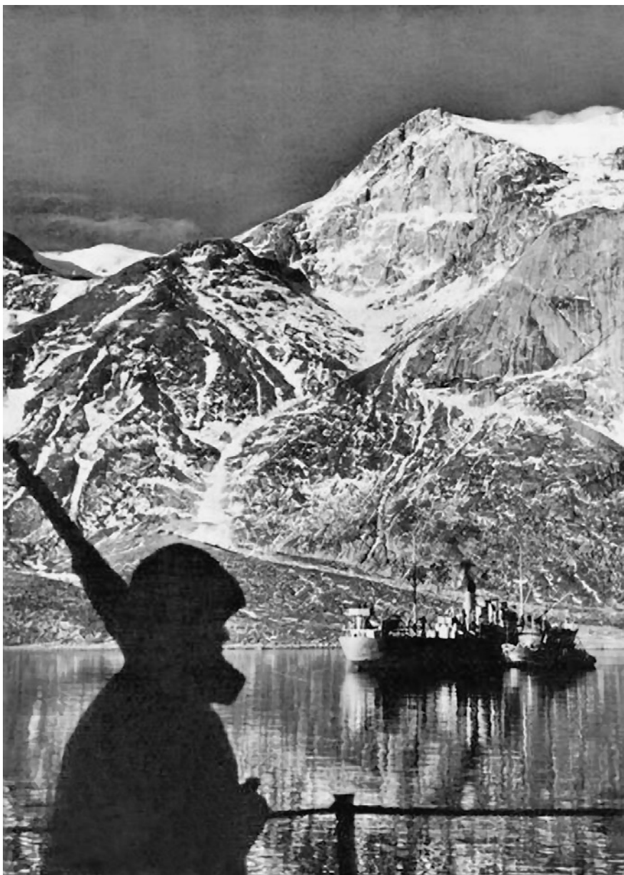
Americká pobřežní stráž s puškou na stráží v jedné z malebných grónských zátok