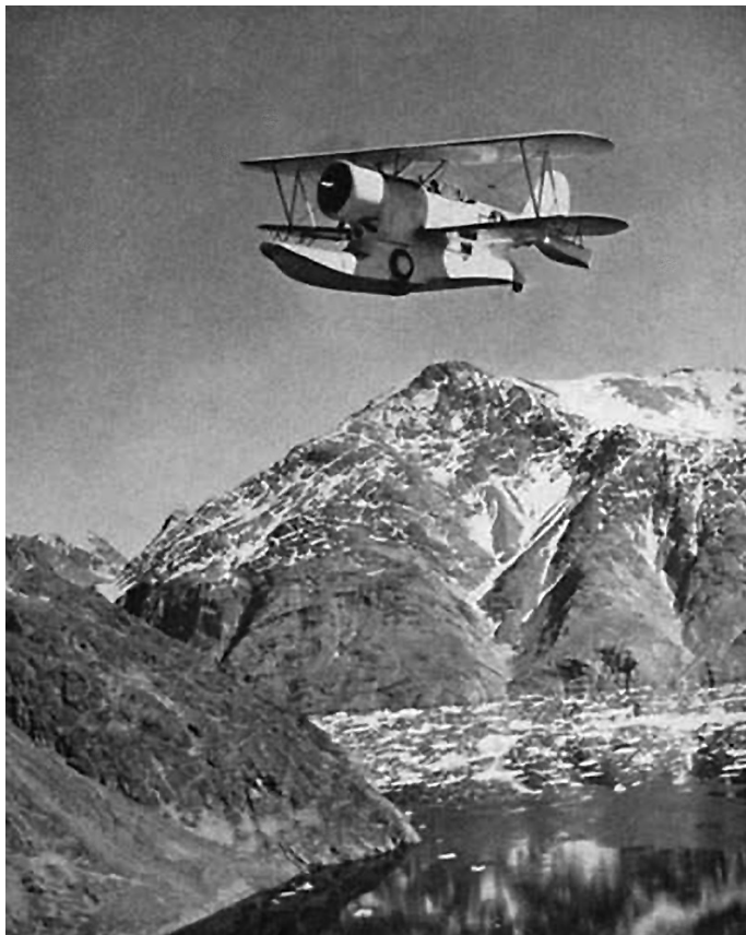
Pozorovací letoun J2F-6 z lodi americké pobřežní stráže Eastwind při hlídce nad grónským pobřežím

Proto tématem našeho dalšího vyprávění nebude v drtivé většině detailní vyprávění o „běžné“ válce v Arktidě – čili o arktických konvojích spojenců do severských přístavů tehdejšího Sovětského svazu, útocích německých ponorek a letadel na ně, pronásledování německých bitevních lodí Bismarck a Prinz Eugen za severním polárním