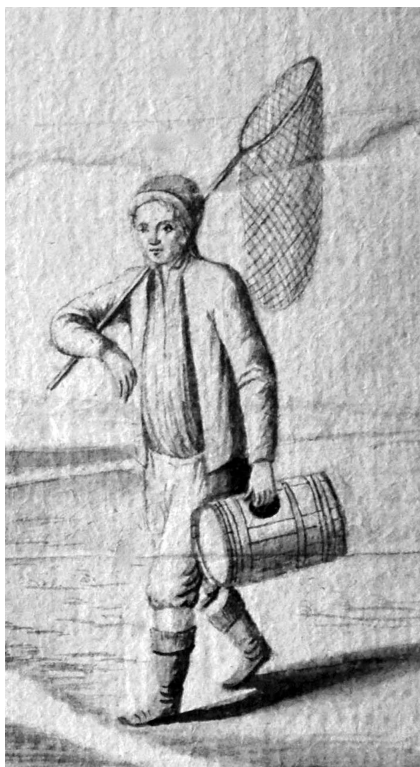
Katastrální mapa obce Kostelec, Caspar Springer, Franz Bourischek, 1782. Ikonografické prameny, obr. č. 43.