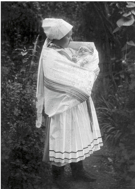
Úvodnice z Velké nad Veličkou.