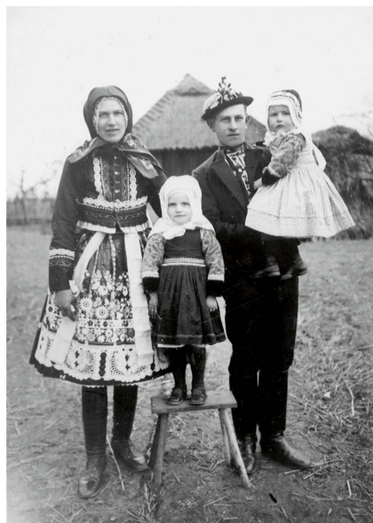
Rodina z Ratiškovic, 1959. ÚEE A09792.