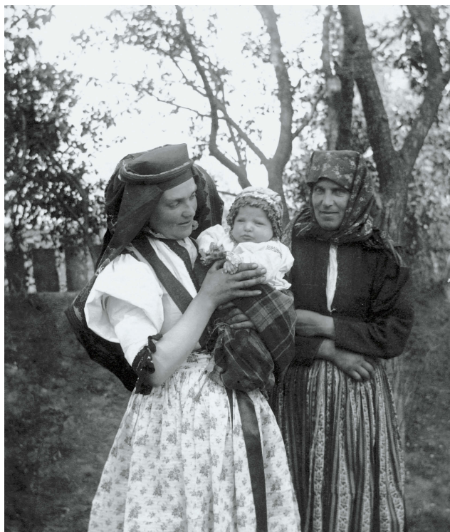
Ženy z Kunovic, 12. 9. 1887.