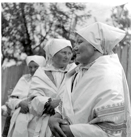
Úvodnice z Velké nad Veličkou. ÚEE A01068.