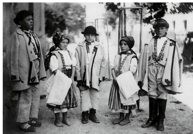
Skupina dětí z Nové Lhoty, 1898. EÚ MZM FA 2021, foto J. Klváňa.