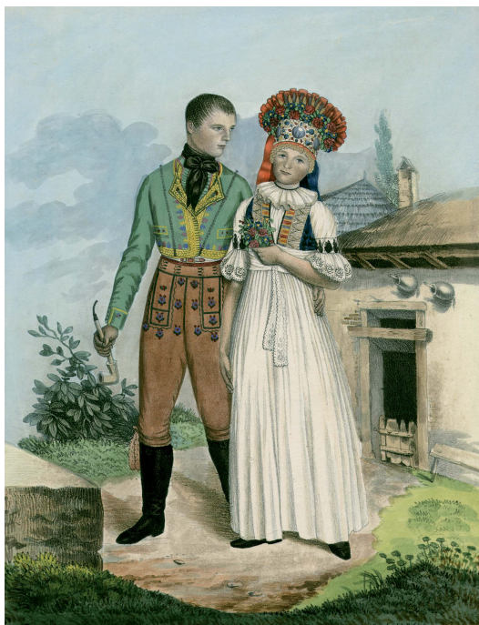
Wilhelm Horn: Nevěsta a ženich z Tovačovského panství, 1837. Ikonografické prameny, obr. č. 198.