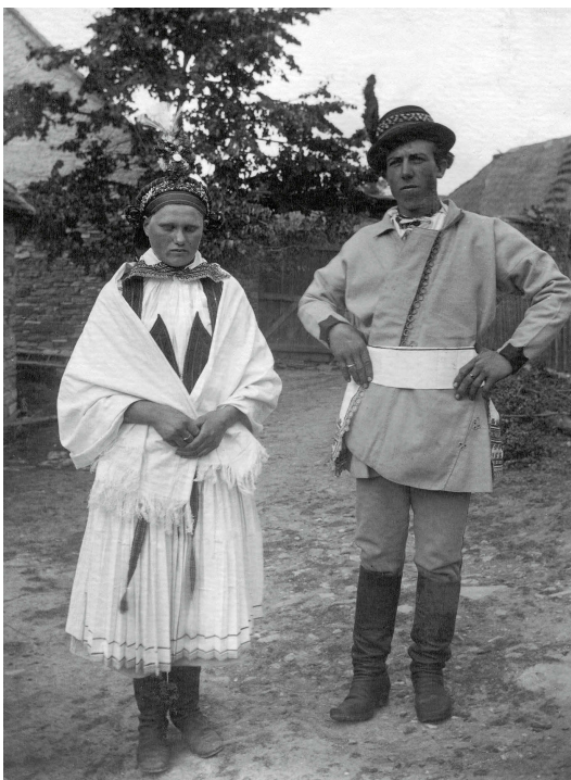
Ženich a nevěsta, Javorník, 11. 9. 1887.