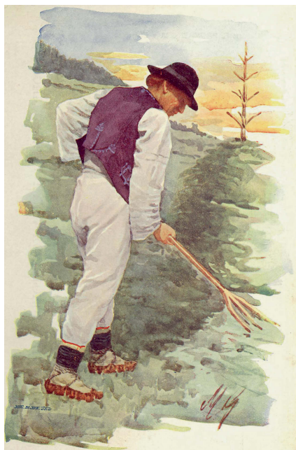
Marie Gardavská: Muž z Rusavy, zač. 20. stol. Pohlednice.