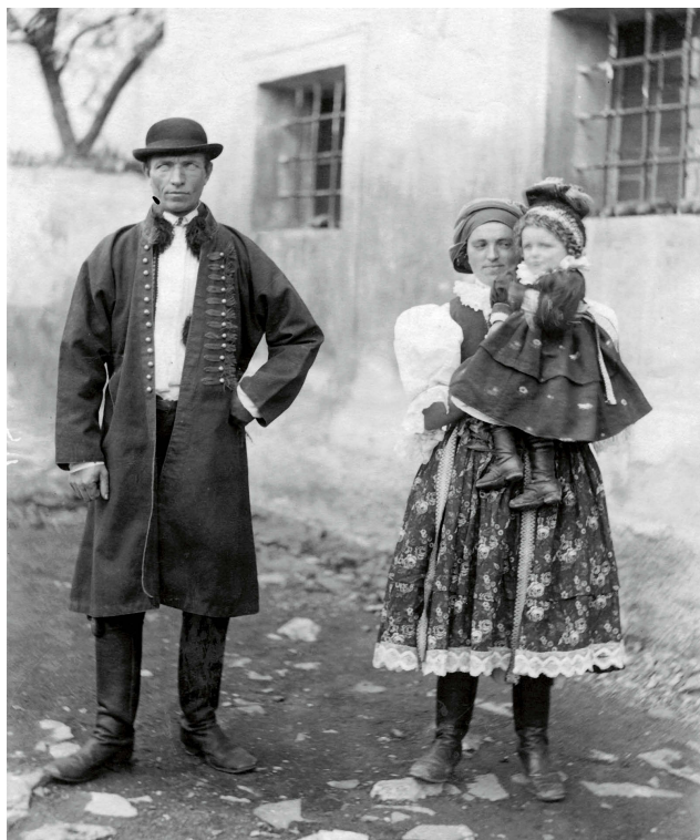
Rodina z Blatnice. EÚ MZM FA 2095, foto J. Klvaňa.