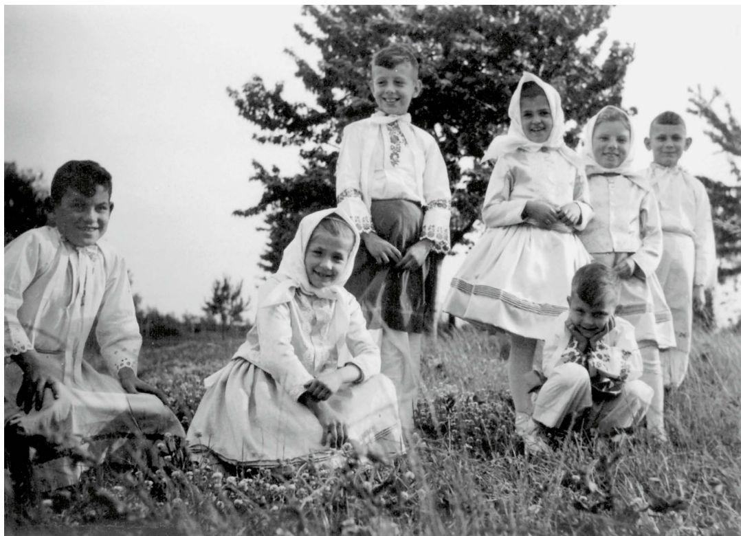
Skupina dětí z Charvátské Nové Vsi, 1961. ÚEE A01782, foto R. Jeřábek.