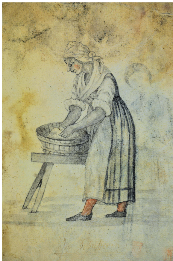
Franz Kledenský: Žena z okolí Fulneka, 1817. Ikonografické prameny, obr. č. 108.