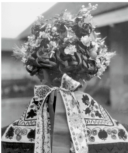
Slavnostní úprava hlavy dívky v kroji moravských Charvátů z Frélichova, 1934.