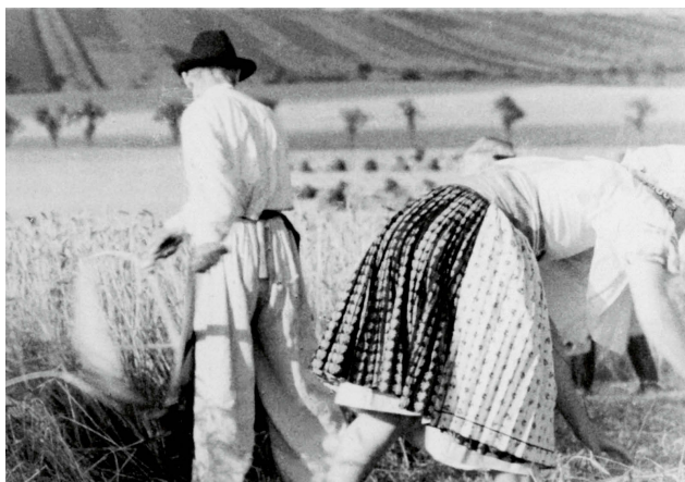
Muž a žena při sklizni, Velká nad Veličkou, 30. léta 20. stol. ÚEE A01940, foto V. Úlehla.