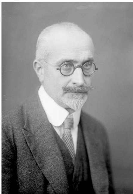
Abb. 6: Ludwig Bittner (1877–1945), österreichischer Historiker und Archivar, ab 1926 Direktor des Haus-, Hof- und Staatsarchivs, 1941–1945 Direktor des Reichsarchivs Wien.

stizpalastes erwies sich jedoch als schicksalhaft, als das neue Archiv im Jahr 1927 durch den Justizpalastbrand größtenteils vernichtet wurde. Eine nicht sonderlich tiefgreifende Strukturveränderung war schließlich die Umwandlung des Eisenbahnarchivs in das breiter angelegte „Verkehrsarchiv“. 15