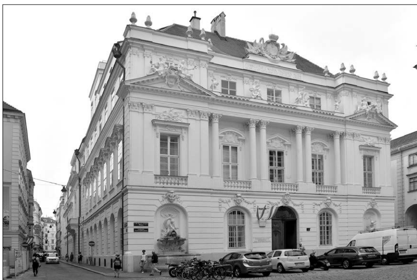
Abb. 13: Das Hauptgebäude der Österreichischen Akademie der Wissenschaften am Dr.-Ignaz-Seipel-Platz, ursprünglich die sogenannte Neue Aula der Universität Wien, beherbergt u. a. das ÖAW-Archiv.