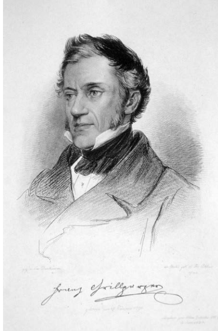
Abb. 2: Franz Grillparzer (1791–1872), österreichischer Dramatiker und Archivar, war in den Jahren 1832–1856 Direktor des Hofkammerarchivs bzw. des Archivs des k.k. Finanzministeriums (Porträtlithographie von Josef Kriehuber aus dem Jahr 1841; Wikimedia Commons).

sich wenig später neuerlich verselbständigte, wurde auch die Aufhebung des Hofkammerarchivs widerrufen, wodurch diese Institution zum dauerhaften Bestandteil des zentralen Archivwesens wurde.