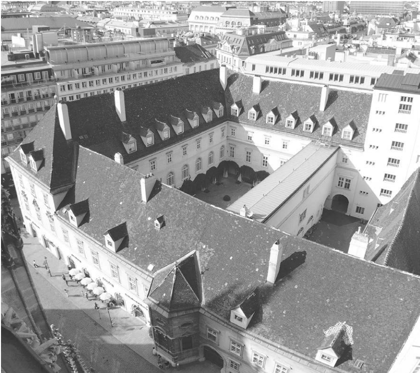
Abb. 14: Das Archiv der Erzdiözese Wien befindet sich im sogenannten Bibliotheksflügel im Innenhof des Erzbischöflichen Palais', das sich zwischen dem Stephansplatz und der Wollzeile erstreckt.

die Diözesen Trient und zum Teil auch Brixen an Italien abgetreten werden. Alles in allem befinden sich heute etliche Diözesanarchive, die für die ältere Kirchengeschichte Österreichs relevant sind, nicht auf österreichischem Staatsgebiet (Passau, Brixen, Trient, Chur).