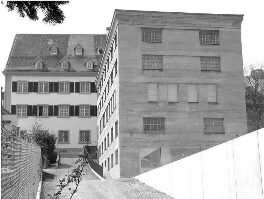
Abb. 10: Der Gebäudekomplex des Vorarlberger Landesarchivs in Bregenz (Foto: Manfred Tschalkner, Wikimedia Commons).

tenden Auslieferungen; diese erfolgten jedoch in den 1980er Jahren aufgrund eines Abkommens mit Jugoslawien.