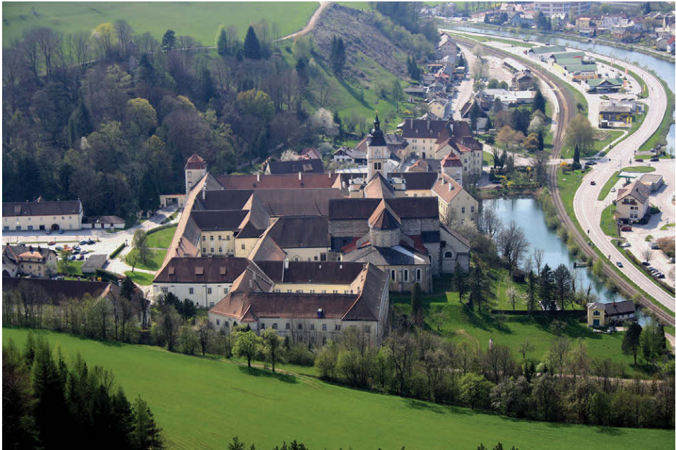
Abb. 1: Das niederösterreichische Zisterzienserstift Lilienfeld beherbergte in der ersten Hälfte des 14. Jahrhunderts das Hausarchiv der Herzöge von Österreich (Foto: Bwag, Wikimedia Commons).

Ottokar II. und später an die Habsburger über, die es zusammen mit ihren eigenen Hausurkunden 1299 im Kloster Lilienfeld deponierten. Erst um die Mitte des 14. Jahrhunderts übersiedelte das Archiv in einen Turm der Wiener Hofburg.