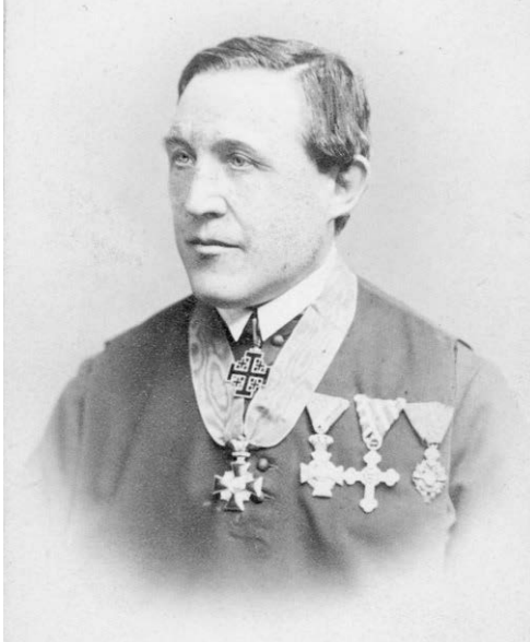
Abb. 4: Beda Dudík, OSB (1815–1890), mährischer Historiker und Archivar.