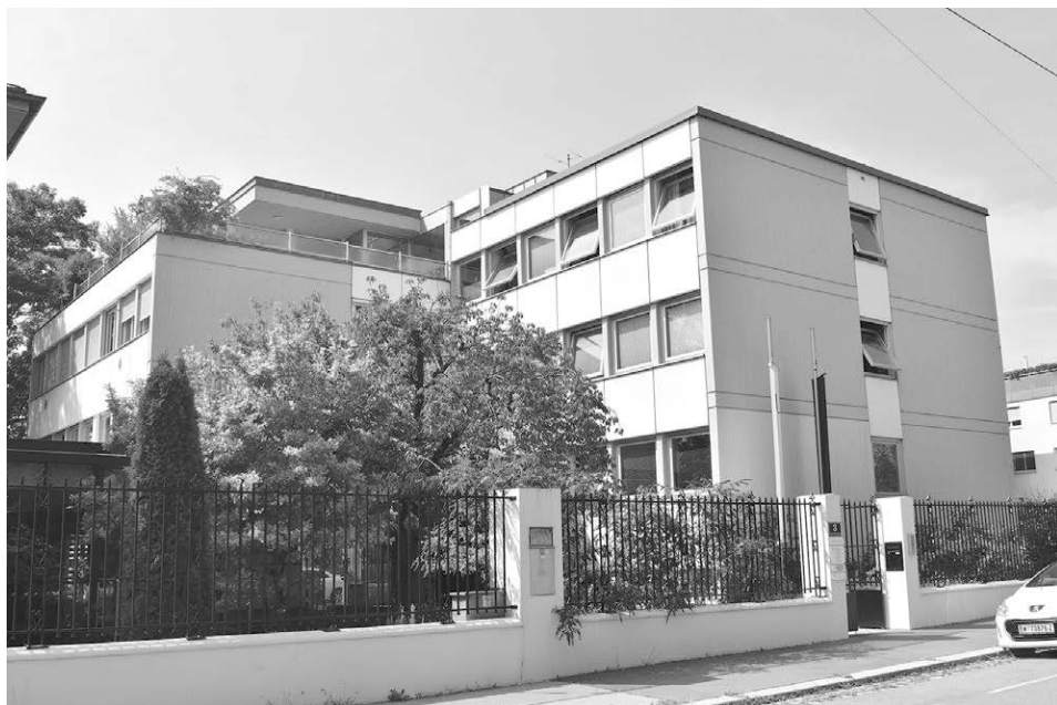
Abb. 15: Das Evangelische Zentrum im 18. Wiener Gemeindebezirk, Severin-Schreiber-Gasse 3, beherbergt den Sitz des Evangelischen Oberkirchenrates A. und H. B. in Österreich, einschließlich des zentralen evangelischen Archivs.