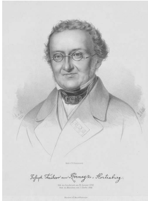
Abb. 3: Joseph Freiherr von Hormayr-Hartenburg (1781–1848), österreichischer Jurist, Historiker, Politiker und Archivar, war in den Jahren 1808–1813 Direktor des Haus-, Hof- und Staatsarchivs.

Die enge Anbindung des Hausarchivs an die Staatskanzlei und die Übernahme der Archive des Reichs stärkte dessen Position innerhalb des zentralen Archivwesens der Habsburgermonarchie und trug zur Umwandlung in ein tatsächliches „Staatsarchiv“ bei. Dieser Prozess fand seinen äußeren Niederschlag im neuen Namen „Haus-, Hof- und Staatsarchiv“, der unter Direktor Joseph Freiherr von Hormayr (1781–1848, Direktor 1808–1813) eingeführt wurde.