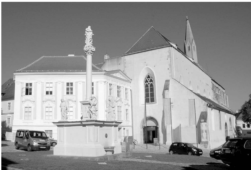
Abb. 11: Das Stadtarchiv Krems befindet sich im Komplex des ehemaligen Dominikanerklosters.

das Archiv zunächst noch mit der Registratur verbunden blieb. 38 In anderen Städten kümmerten sich zumeist Gymnasialprofessoren ehrenamtlich um das Stadtarchiv und/oder -museum. Es gab sogar Fälle, in denen Universitätsprofessoren oder Archivare der Zentral- oder Landesarchive das „Patronat“ über ein kleines Stadt- oder Marktarchiv übernahmen und dieses in ihrer Freizeit betreuten.