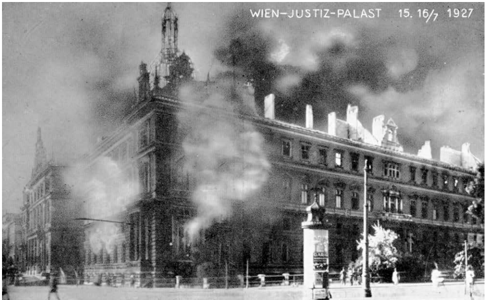
Abb. 7: Der Brand des Justizpalastes am 15. Juli 1927 stellt die größte Katastrophe der österreichischen Archivgeschichte dar.

Wien umbenannt wurde, sowie das Verkehrsarchiv blieben außerhalb dieser neuen Institution. Die Leitung des Reichsarchivs übernahm einer der einflussreichsten Männer des österreichischen Archivwesens der 1930er Jahre – Ludwig Bittner. 17