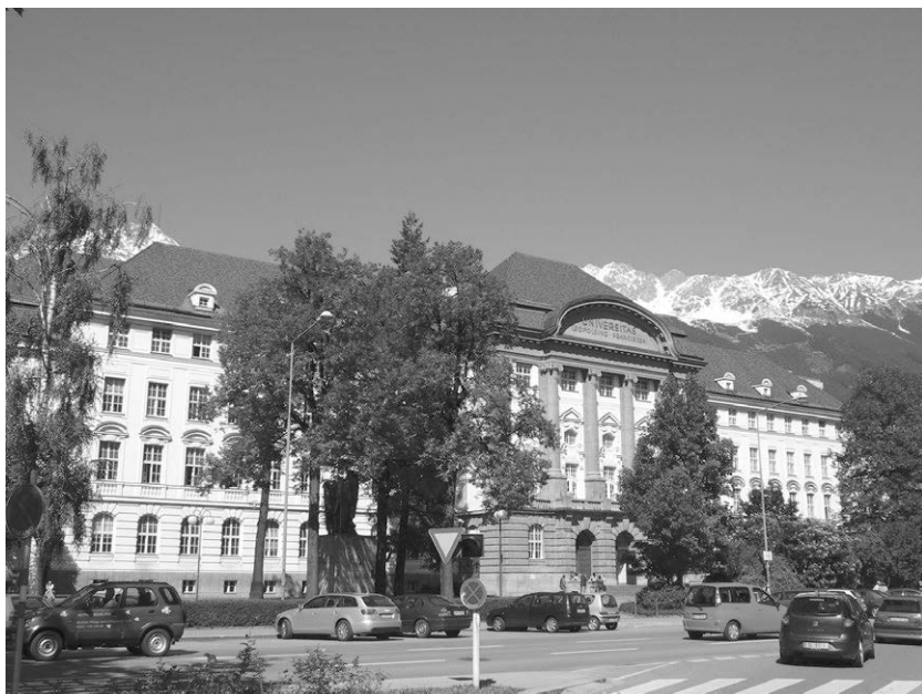
Abb. 12: Das Hauptgebäude der Leopold-Franzens-Universität in Innsbruck beherbergt u. a. auch das Universitätsarchiv.