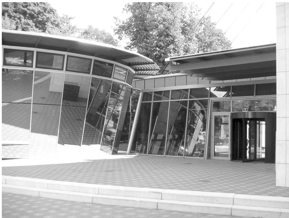
Abb. 9: Der architektonisch besonders wertvolle Neubau des Kärntner Landesarchivs in Klagenfurt aus dem Jahr 1996.

genständigen Landesarchiven zu „Landesarchiven neuen Typs“ zusammengelegt werden. In einigen Ländern ging diese Fusion zügig von Statten, z. B. in der Steiermark im Jahr 1927. In anderen Ländern zog der Prozess sich hin, etwa in Niederösterreich, wo die beiden Archive nach einem gescheiterten Versuch in den 1930ern erst 1940 im Zuge der Anlage von Reichsgauarchiven fusioniert wurden, um 1945 in ein Landesarchiv neuen Typs umgewandelt zu werden. Das regionale Archivwesen Österreichs wurde fast komplett „verändert“; 30 der Bund konnte nur mittels Archivamt eine Aufsicht über den Schutz der Archivalien ausüben, hatte aber keine Zugriffsmöglichkeiten auf die völlig autonomen Landesarchive.