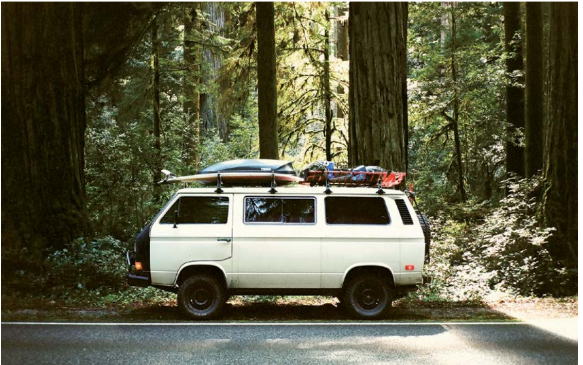
Nahoře: Big Sur, Kalifornie; dole: Humboldt County, Kalifornie