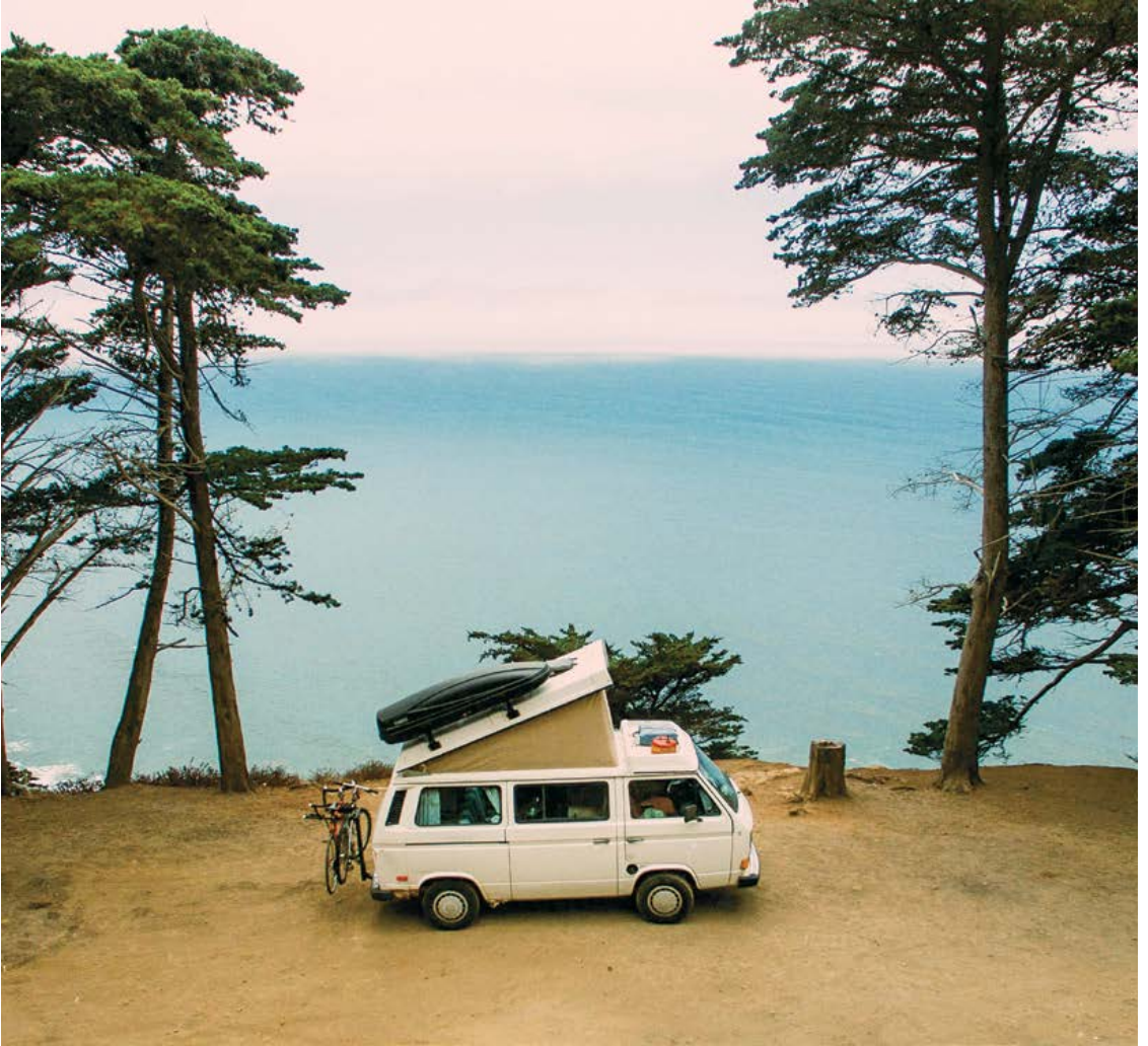
1986 Volkswagen Vanagon Wolfsburg Edition (Penelope the Westy), Big Sur, California