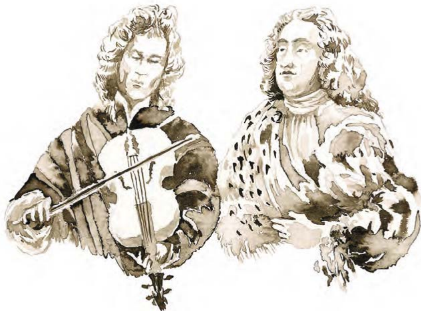
Barokní skladatel J. D. Zelenka na dvoře saského kurfiřta

Na Blaník je nejlépe jít za šera, mlhy a deště. Jasná obloha a tvrdé stíny slunečného dne zahánějí stíny keltských bojovníků i rytířů svatého Václava. Pohled z blanické rozhledny je úžasný, navíc kolem vás zaznívá barokní chorál Jana Dismase Zelenky, rodáka z Louňovic, který se na drážďanském dvoře vypracoval na jednoho z mistrů evropského hudebního baroka. Možná v mládí chodil na Blaník a hora mu odkryla to, co jiným skryla.