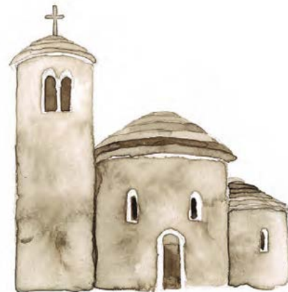
Rotunda na Řípu