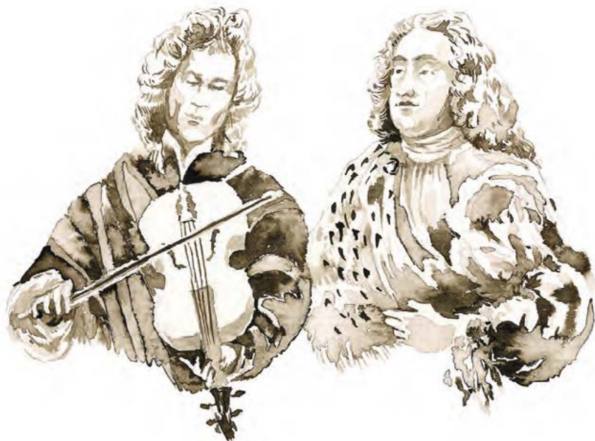
Barokní skladatel J. D. Zelenka na dvoře saského kurfiřta

Na Blaník je nejlépe jít za šera, mlhy a deště. Jasná obloha a tvrdé stíny slunečného dne zahánějí stíny keltských bojovníků i rytířů svatého Václava. Pohled z blanické rozhledny je úžasný, navíc kolem vás zaznívá barokní chorál Jana Dismase Zelenky, rodáka z Louňovic, který se na drážďanském dvoře vypracoval na jednoho z mistrů evropského hudebního baroka. Možná v mládí chodil na Blaník a hora mu odkryla to, co jiným skryla.