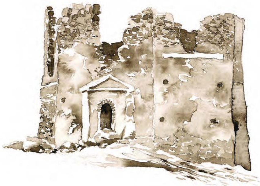
Kaple na Malém Blaníku

Jedním z míst, kde se zdávají zvláštní sny – zejména na podzim kolem Dušiček a na počátku jara, než vyrostou vlaštovičníky – je i Blaník. Český Blaník je úzce spřízněn s dalšími dvěma ochrannými kopci – moravským Hostýnem, kde na starém hradišti vládne Naše Paní, a se slovenským Děvínem nad mocným Dunajem. Je třeba je poznat a všechny porovnat, protože na těchto třech vrcholcích pochopíte rozdíl mezi Čechami, Moravou a Slovenskem.