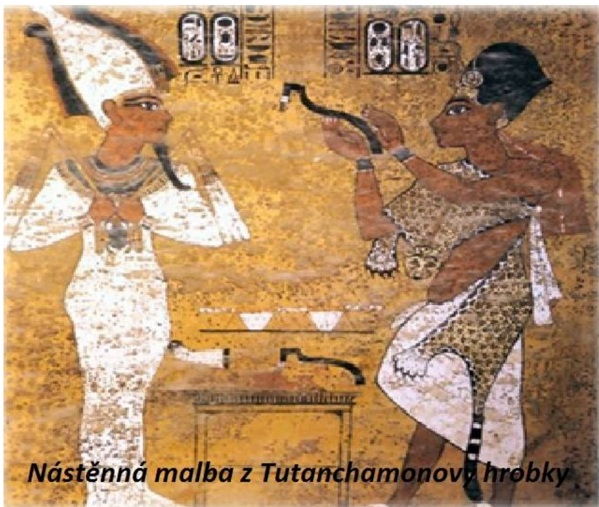
Nástěnná malba z Tutanchamonovy hrobky

4. listopadu 1922 archeolog Howard Carter a jeho tým objevili hrobku faraona téměř nedotčenou rabovači v egyptském údolí králů. Vzrušený Carter okamžitě telegraficky informoval o mimořádném objevu lorda Carnarvona, největšího sběratele egyptských starožitností a majitele koncese na práva na hloubení. Britského aristokrata, který snil o návštěvě nedotčené hrobky, nenapadlo ani ve snu, že se z objevu bude radovat velmi krátkou dobu.