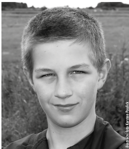
ilustrační foto Karsten Paulick

Ale byly to zároveň krásné chvíle, kdy mi Písmo mluvilo do života a já jsem se jím nechával ovlivňovat. Jednotlivé biblické verše mě jednoduchou zvěstí oslovovaly a já jsem je s dětskou naivitou a radostí přenášel do života, i když třeba špatně a izolovaně od kontextu. Propojovaly se s životem. V žalmech jsem narážel na podobnost se svým životem, což mi