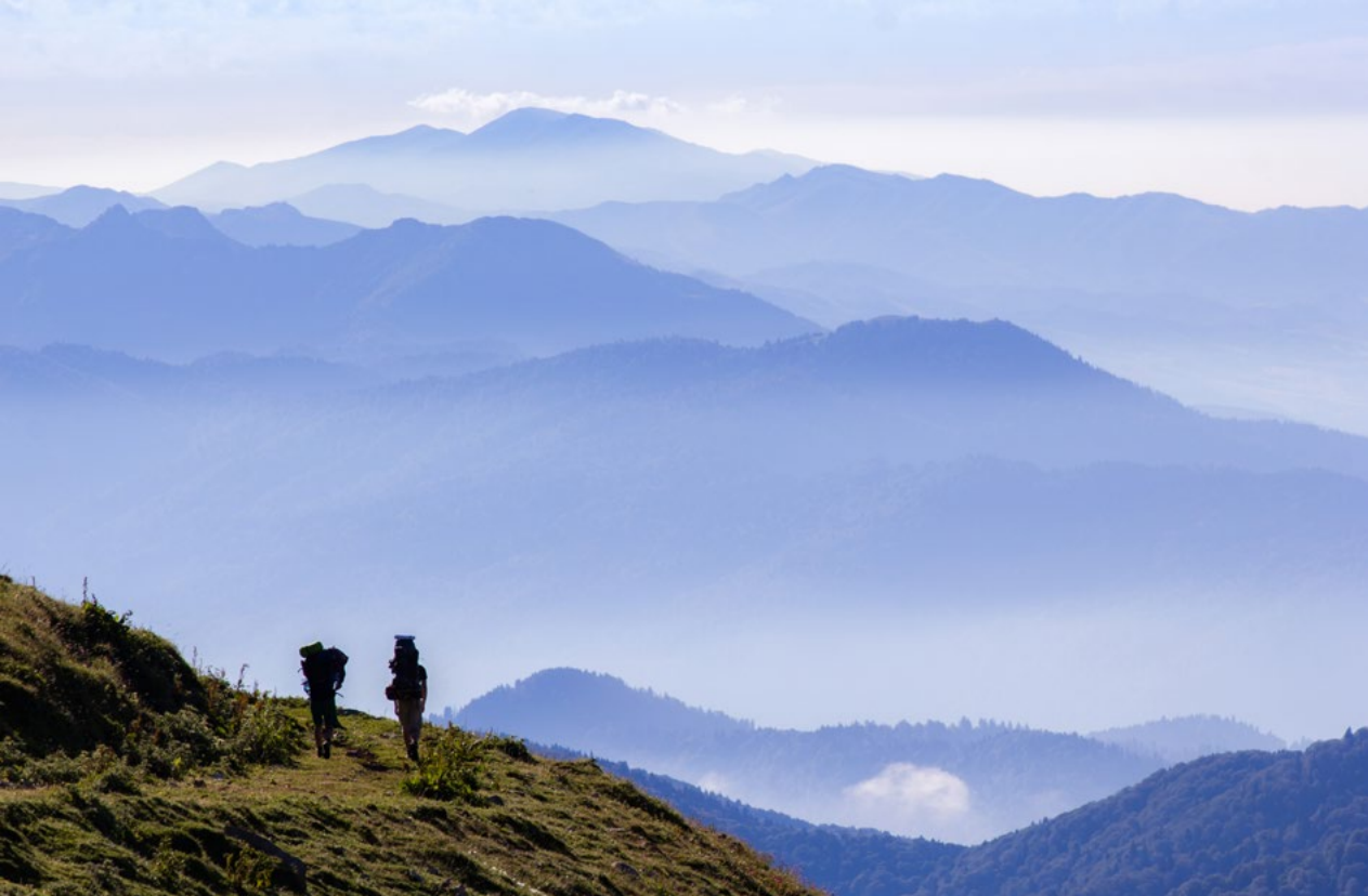
Takové normální ráno na Kavkaze.

Systém uchycení na korbě nákladňáku vypadal následovně. Ti nejšťastnější se drželi přední desky za kabinou. Druhý voj jednou rukou svíral všechno, co někde na druhém konci mohlo být pevně spojeno s autem, a druhou se staral, abychom neztratili šťastlivce ve třetí řadě. Ti, aby se nenudili, hlídali volnou končetinou batohy.