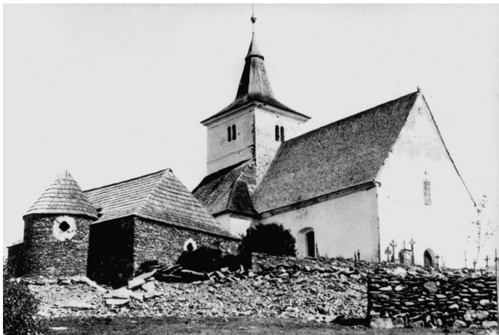
Pozdně románský kostelík sv. Mořice na Mouřenci u Annína

čtyři – Kněží hora u Katovic, Hradec u Řepic, Hradiště u Sousedovic a Hradec u Němčtic. Slovanské osídlení zabralo celou starší a zemědělsky již kultivovanou oblast v povodí Otavy a Volyňky, ale nejspíše pronikalo i do vyšších a dosud neosídlených krajin, jak dokládají slovanské artefakty nalezené na Čenkově pile, v okolí Kašperských Hor, Vlachova Březí, Sedla u Albrechtic a jinde.