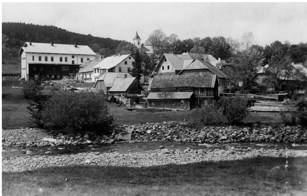
Prášily, osada založena na konci 18. století v blízkosti sklářské hutě (působila zde od roku 1739)

Šumavy patřil mezi nejlivnější rod Vítkovců. K podpoře kolonizační činnosti založil Vok z Rožmberka roku 1259 ve Vyšším Brodě cisterciácký klášter.