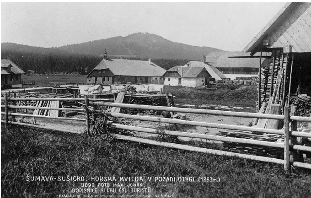
ŠUMAVA-SUŠICKO: HORSKÁ KVILDA V POZADÍ OTVĚL (1253m) 9099 FOTO MAX JONÁK DOPISNICE KLUBU ČSL TURISTŮ NAKLADATEL JOZEF POSPÍŠAL, KŘEHOUPEC V SUŠICI NA ŠUMAVĚ

se spálil a obilí se selo do popela. Protože panovalo tehdy příznivé klima, přinášel takový způsob hospodaření poměrně vysoké výnosy při nevelkém vkladu práce (půda se nemusela orat, jen se lehce zryla).