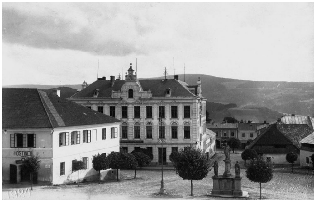
Náměstí v Kašperských Horách, osada založena ve 13. století, roku 1584 povýšena na královské horní město

dištní jsou však stále otevřeným problémem a mají zatím spíše spekulativní charakter (neboť většina dokladů jsou hmotné památky, které na tento problém odpovědět neumějí).