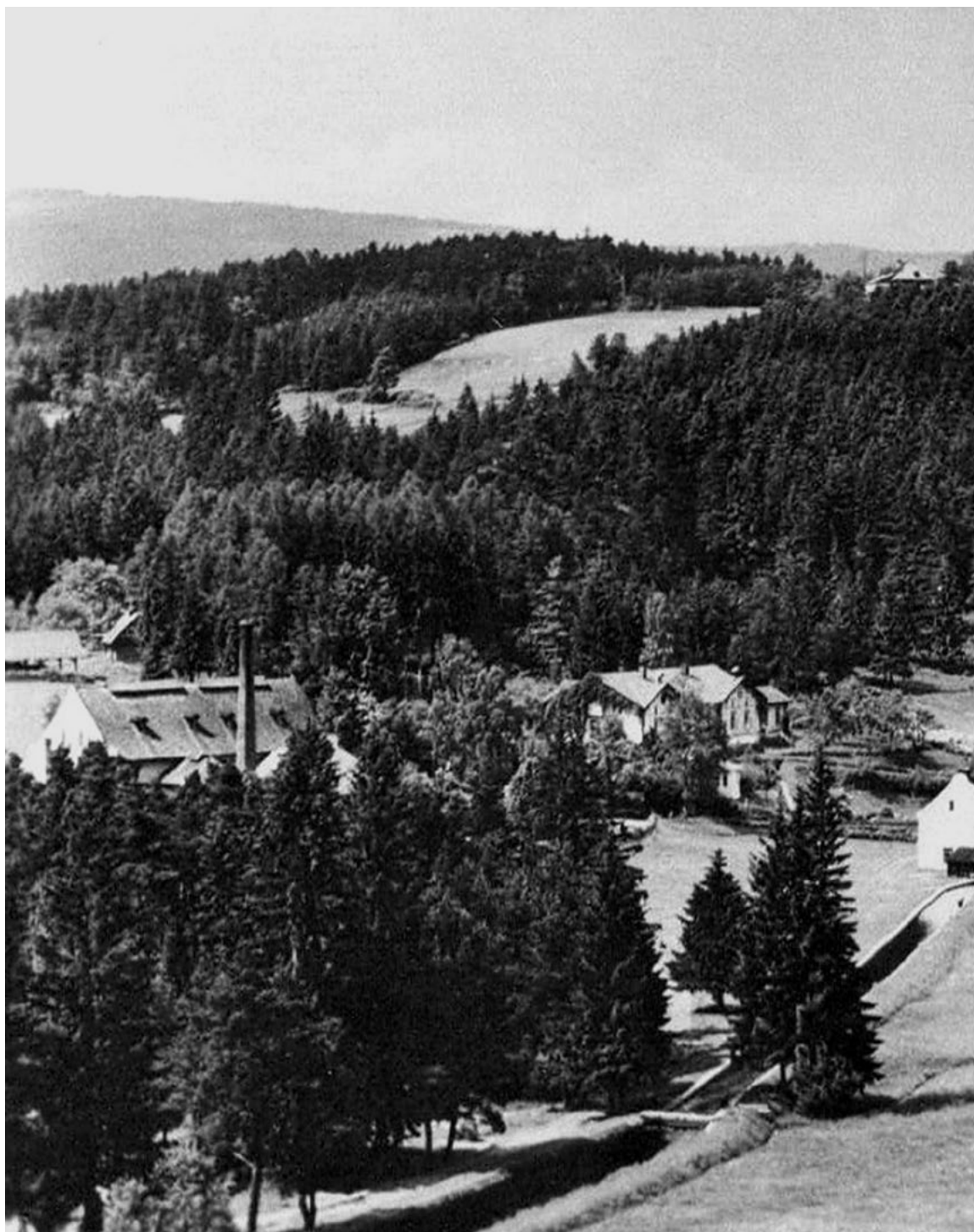
Sklárna v Anníně