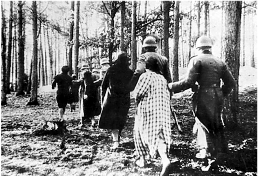
Polské ženy odváděny k popravě, 1939

Na úplně nejnižší příčce společenského žebříčku se pak nacházeli Židé, které Hitler ani nepovažoval za rasu, nýbrž za parazity a podlidi, usilující o zničení německého národa. Těm žijícím v Evropě vyhrožoval likvidací, pokud „mezinárodní židovští finančníci“ vyvolají další světovou válku, nicméně na podzim roku 1939 nacistické špičky stále ještě jen připravovaly plány na jejich vyhlazení. Obsazením Polska se ovšem pod jejich nadvládou dostaly dva miliony těchto lidí; desetkrát víc, než kolik jich žilo v Německu. Reinhard Heydrich, zástupce říšského vůdce jednotek SS, přitom již tehdy sděloval útvarům těchto ozbrojených složek, že problém s Židy bude muset být řešen čím dál intenzivněji, a vydal příkaz, aby Židé byli soustředěni ve městech a připraveni k deportaci do rezervace podél nové hranice se Sovětským svazem. Židé také museli na rukávě nebo na prsou začít nosit Davidovu hvězdu a požadovaným způsobem označovat své obchody nebo firmy, nemluvě o jejich neustálém pronásledování. „Jaké potěšení, konečně ... mít možnost napadat židovskou rasu i fyzicky,“ uvedl v listopadu toho roku v projevu Frank. „Čím víc jich zemře, tím lépe.“ 6