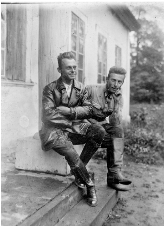
Witold Pilecki a jeden z jeho přátel v Sukurcze někdy kolem roku 1930