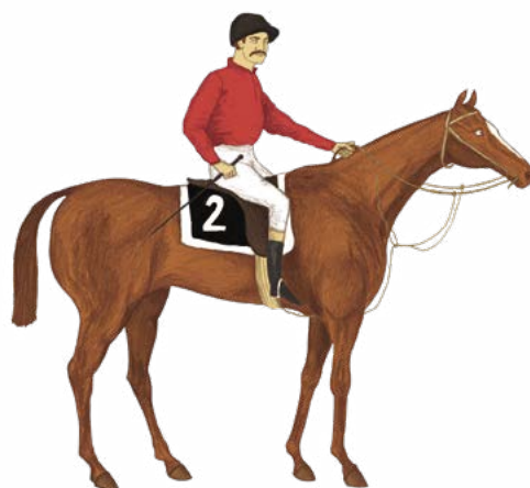
Lady Anne 1891-94-96