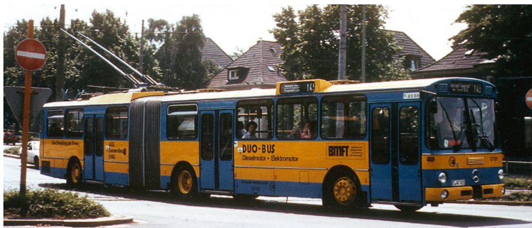
❖ Zcela první essenský duobus značky Mercedes O305 G-DUO v srpnu 1984