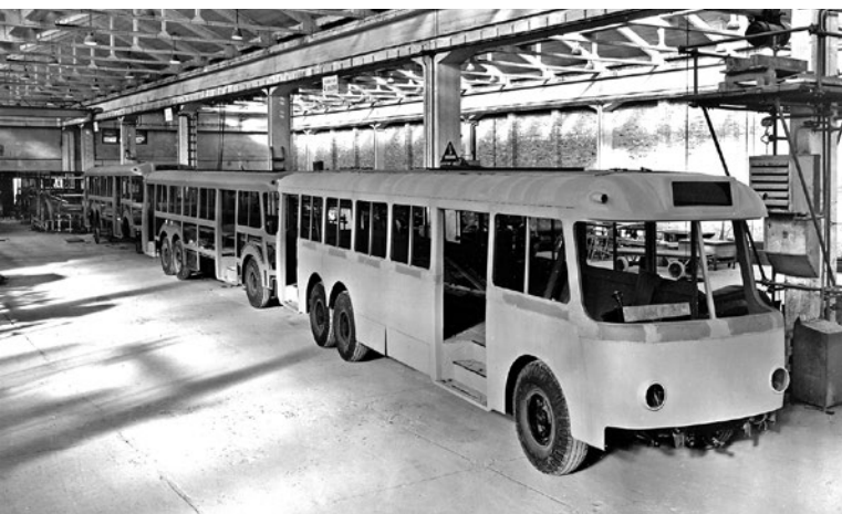
➤ Pohled na výrobu třínápravových italských trolejbusů Alfa-Romeo AF 140

větském svazu, po druhé světové válce také v jeho satelitních zemích. V padesátých a více pak v šedesátých letech se ale západoevropská i severoamerická města stále více přikláníla k nahrazování trolejbusů autobusy. Stejně jako kdysi tramvaje byly nově rušeny trolejbusy, které se tak vlastně staly obětmi ekonomické výhodnosti autobusů, vyráběných v těch dobách již ve velkých sériích. V téže době si samozřejmě velká města pořizo-