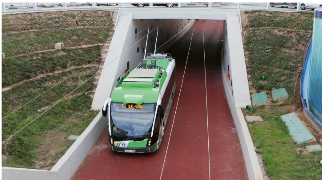
➤ Španělský systém v Castellón de Plana se systémem TVRCas

Objevují se však i nové hybridní systémy mezi tramvají a trolejbusem, jako je například tramvaj na gumových kolech, které se ale více než pro běžný provoz hodí spíše jako možnost prezentace „inovačních“ politických projektů vůči „zastaralým“ systémům veřejné dopravy, jakými jsou právě tramvaje a trolejbusy. Pro tyto nové systémy je ale obtížné stanovit příbuznost s trolejbusy. Nepochybně příbuzný s trolejbusovou dopravou je opticky naváděný systém TVRCas od firem Irisbus, IVECO a Siemens, který je definován jako „trolejbus s pomocným vedením“. Ten se používá například ve španělském Castellónu de la Plana nedaleko Valencie. TVRCas využívá u těchto trolejbusů speciální elektrické motory, které jsou umístěné v zadních kolech, a tak vlastně odpadávají agregáty jako převodovka a převodní hřídel. Systém optického navádění umožňuje vozu sledovat přesně ideální trasu naznačenou na vozovce a najíždět tak co nejbližší k nástupištím na zastávkách. Trasa ve křivkách je rovněž vypočítána tak, aby zajišťovala cestujícím maximální pohodlí.