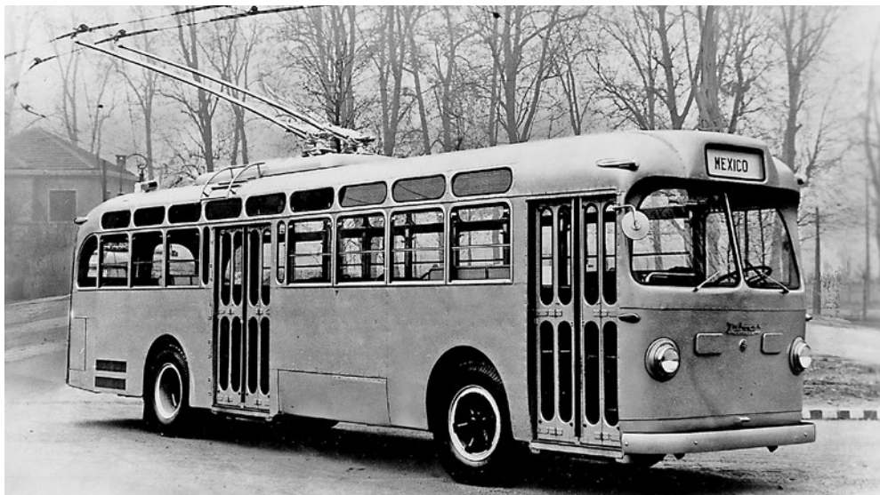
❖ Italský trolejbus Alfa-Romeo Tubocar s elektrickou výzbrojí Marelli z roku 1952, určený pro Ciudad de México

valy auta, která začínala zaplavovat městské ulice. A tak měly na počátku třicátých let trolejbusy v mnoha případech větší význam než tramvaje. Například v Itálii bylo toto vozidlo oblíbeným tématem fašistické vlády, a to až do té míry, že v roce 1938 „duce“ Benito Mussolini vyhlásil, že pro „veřejnou dopravu je nejvýhodnější trolejbus“. Jen pro upřesnění – v Evropě byla co do počtu trolejbusových provozů Itálie hned na druhém místě za