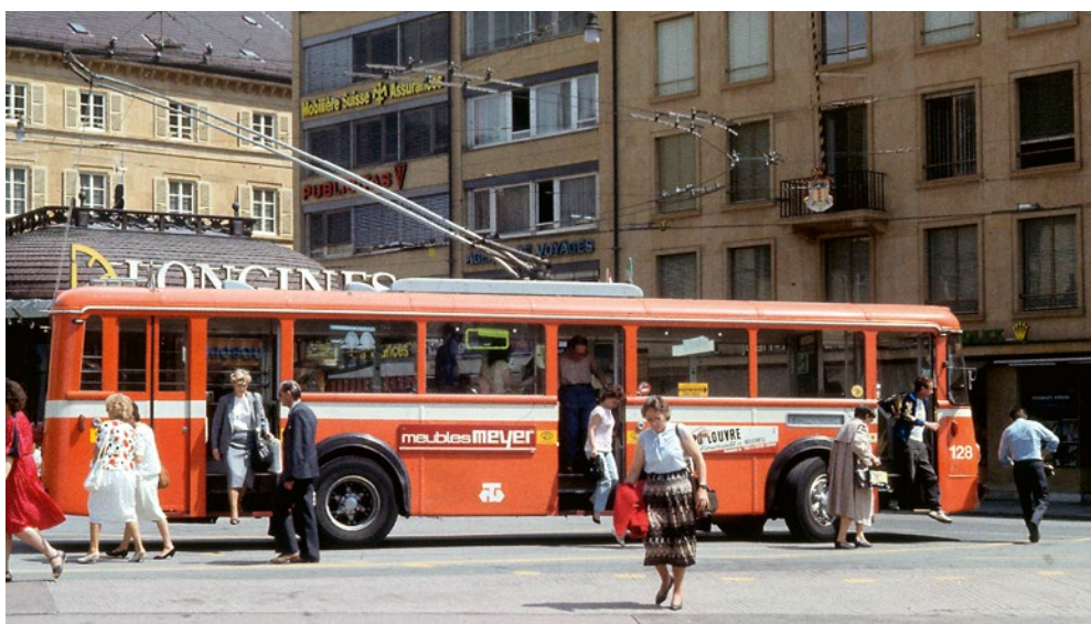
❖ Typický švýcarský trolejbus 70. a 80. let minulého století

Velkou Británií. Rozvoj trolejbusové dopravy na Apeninském poloostrově pokračoval i po druhé světové válce a dosáhl maximálního stavu na počátku šedesátých let, kdy bylo zaznamenáno více než čtyřicet trolejbusových systémů na zhruba 1350 kilometrech tratí, na nichž byly provozovány více než dvě tisícovky vozidel. Mimo Itálii, Velkou Británii a také USA byla trolejbusová doprava rozšířena především v Německu, Švýcarsku a bývalém So-