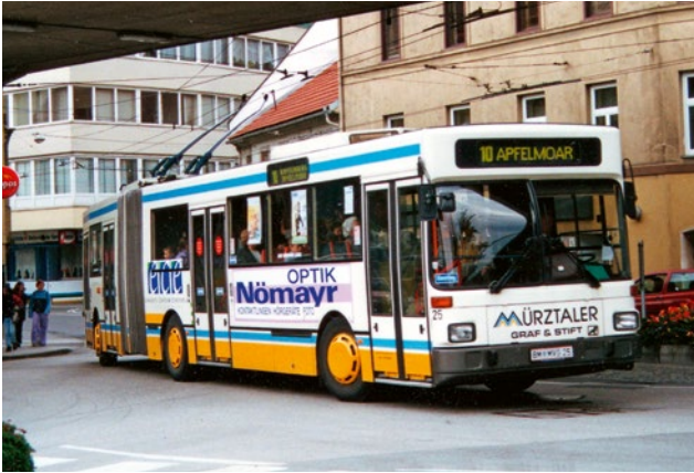
❖ Článekový duobus Gräf & Stift GE113M16 ve štýrském dvojměstí Bruck-Kapfenberg

ticky vyhledávala elektromagnetické pole pod proudem. Když se sběrače přiblížily k troleji, tak se ihned pomocí sklopných dorazů nasadily. To se ale ne vždy podařilo, navíc byl systém dost drahý. Duobusy zachránil levnější způsob nasazování sběračů pomocí naváděcích stříšek přímo na troleji, což se dnes praktikuje v celosvětovém měřítku bez větších problémů. Podobná vozidla najdeme v České republice například v Hradci Králové, Pardubicích, Opavě, Mariánských Lázních, Plzni nebo v dvojměstí Zlín-Otrokovice, kde se hybridní trolejbusy pohybují po příměstských trasách vlastní silou.