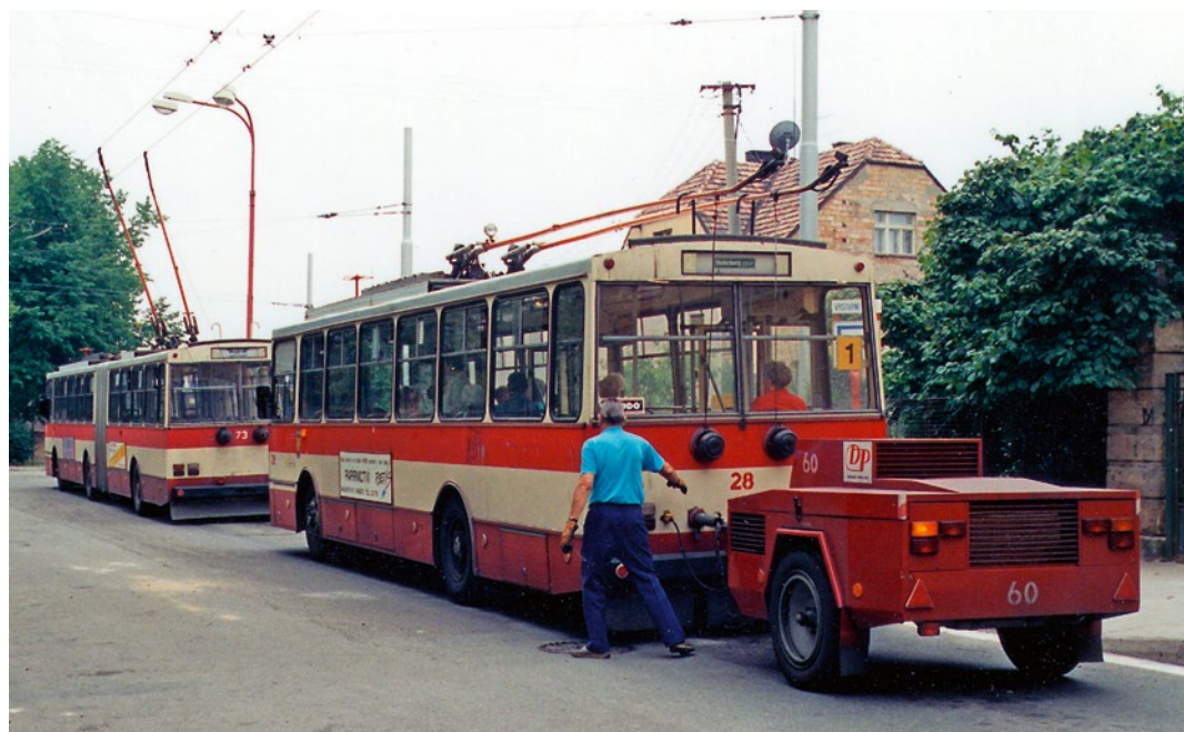
➤ Pohled na vozík s dieselagregátem v devadesátých letech v Novém Hradci Králové

Pro vedení vozíku byly upraveny celkem dva trolejbusy (vždy jeden provozní a druhý naopak záložní), které byly od července 1994 pravidelně nasazovány na lince Hlavní nádraží – Nový Hradec Králové – Kluky. Tento ojedinělý způsob částečně autonomního trolejbusového provozu byl nahrazen v roce 2001, kdy do Hradce Králové dorazil první trolejbus typu Škoda 21 Tr ACI, který byl již z výroby vybaven pomocným dieselagregátem. Jeden ze starších trolejbusů Škoda 14 Tr byl hned vyřazen, druhý vůz byl ponechán jako rezervní. Úplný konec pomocného vozíku přinesl rok 2012, kdy se metropole již samostatného Královéhradeckého kraje dočkala zcela nových hybridních trolejbusů Škoda 30 Tr DG se zastavěným dieselovým agregátem (APU).