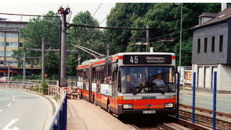
❖ Jeden z duobusů druhé generace Mercedes-Benz O405 GTD v Essenu v roce 1994

Pak bylo dlouho „ticho po pěšině“, podobný projekt byl znovu oprášen v bývalém západním Německu až v sedmdesátých letech. Poprvé se hybridní pohon uplatnil v roce 1975 u vozidla typu Mercedes-Benz OE 302, které byl rekonstruováno ze staršího autobusu a zkoušeno bez cestujících s pomocným bateriovým pohonem v Esslingenu u Stuttgartu. Tam se od roku 1977 začaly zkoušet i další varianty standardního a článkového provedení v kombinaci elektro/diesel nebo elektro/baterie u vozidel Mercedes OE 305, resp. článkové verze OE 305 G. Podobná vozidla se testovala i v Essenu v Porúří, kde byl navíc nasazen i modernější typ Mercedes-Benz O 405 GTD. Duální (nebo také hybridní) systém zkoušela i jiná města, například Kodaň, francouzské město Grenoble, nebo dnes již zaniklý meziměstský rakouský provoz mezi městy Bruck a Kapfenberg ve Štýrsku. První výsledky v provozu však nebyly ohromující. Základním problémem se stal plynulý přechod z elektrické trakce na dieselovou nebo bateriovou. Duální vozidla byla v počátcích vybavena samonaváděcím systémem Dornier, založeným na čidlech na konci sběračů, která si automa-