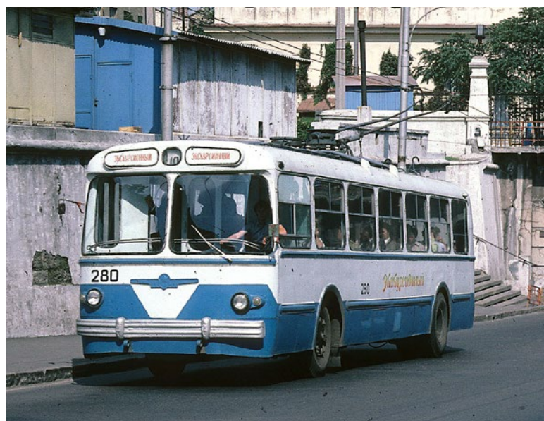
❖ Ruský trolejbus ZIU 5

motorů dříve odporová a zbytková energie se takzvaně mařila v odpornicích. Od sedmdesátých let 20. století se pohon reguluje tyristory, které fázovou regulací mění množství elektrické energie přiváděné do motorů. Moderní tyristorové regulace a pohony vybavené takzvanými IGBT elementy jsou energeticky mnohem úspornější než původní odporová regulace. Řízení otáček a výkonu elektrického motoru se děje pomocí specializovaných silnoproudých elektronických obvodů vozidla, které ovládá řidič pomocí akceleračního pedálu. Upravené napětí a proud jdou následně do trakčního motoru, jenž přes mechanické hřídele a ozubené převody pohání nápravu a kola. K brzdění se dnes většinou používá jediný pedál s několika brzdnými režimy, které jsou často voleny automaticky podle okamžitých podmínek a nezávisle na vůli řidiče. Trolejbusy standardní délky bývají vybaveny zpravidla jedním trakčním stejnosměrným elektromotorem, článková vozidla pak mají motory dva – jeden je