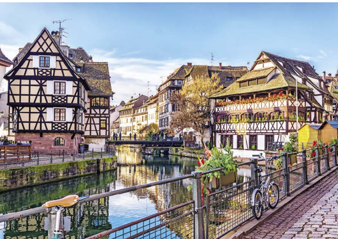
Tradiční hrázděné domy kolem štrasburských kanálů