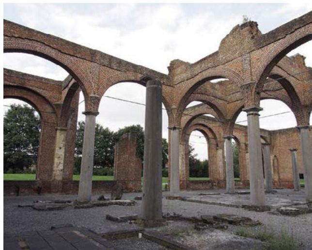
Hornická kolonie Grand-Hornu

V 19. a 20. století bylo Valonsko jedním z důležitých středisek těžby uhlí a dodnes se zde dochovaly mnohé industriální památky. Do seznamu UNESCO jsou zde zapsány architektonicky jednotně naplánovaná hornická kolonie Grand-Hornu, která tvořila součást širšího těžebního komplexu, uhelný důl Bois-du-Luc, jenž patří k nejstarším v Belgii a rovněž se pyšní kompaktními domky vystavěnými firmou pro zaměstnance, uhelný důl Bois du Cazier, který byl v roce 1956 dějištěm rozsáhlého podzemního požáru s 262 oběťmi, a důl Blegny-Mine. Ten byl posledním činným dolem v oblasti, těžba v něm byla ukončena k roku 1980.