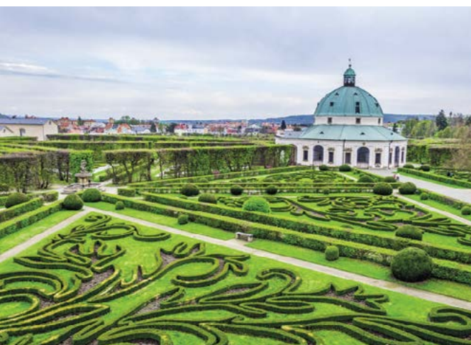
Květná zahrada s rotundou