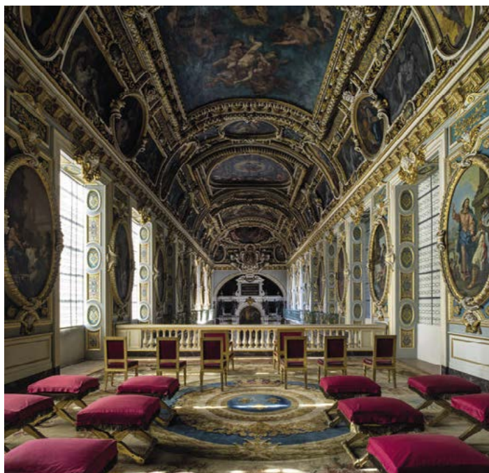
Jeden z bohatě dekorovaných sálů v paláci ve Fontainebleau

Palác ve Fontainebleau býval už od 12. století královským loveckým záměčkem. V 16. až 18. století se ale dočkal rozsáhlých rekonstrukcí a rozšíření, na kterých se významně podíleli nejlepší italsí a francouzští architekti. Práce byly natolik intenzivní, až se zámek stal místem zrodu nové umělecké školy, jejíž díla patří k vrcholům francouzského renesančního výtvarného umění. Palácový komplex dodnes ohromuje jak svou vnější podobou, tak i bohatě dekorovanými sály a pokoji. Podstatnou součástí areálu jsou i rozsáhlé zahrady.