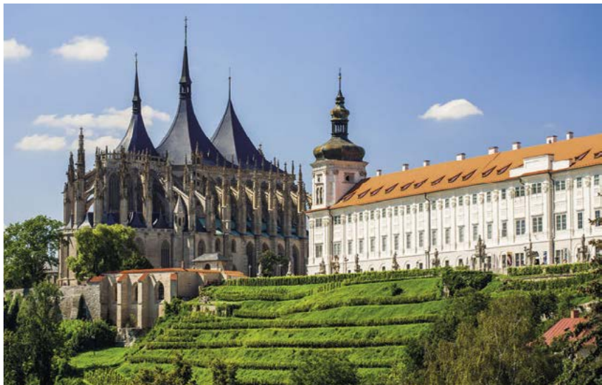
Pozdně gotický chrám sv. Barbory a bývalá jezuitská kolej

Kutná Hora byla ve středověku jedním z nejdůležitějších evropských ložisek stříbra a živým hornickým městem, které bylo otevřené dálkovému obchodu i technickým inovacím. Historické jádro města včetně některých zpřístupněných dolů se dodnes dochovalo v dobrém stavu. O dávné kutnohorské prosperitě svědčí kromě měštanských domů, královského paláce s mincovnou a dalších budov také dva výjimečné kostely – pozdně gotický chrám sv. Barbory a katedrála Nanebevzetí Panny Marie a sv. Jana Křtitele v nedalekém Sedlci, kde stával významný cisterciácký klášter.