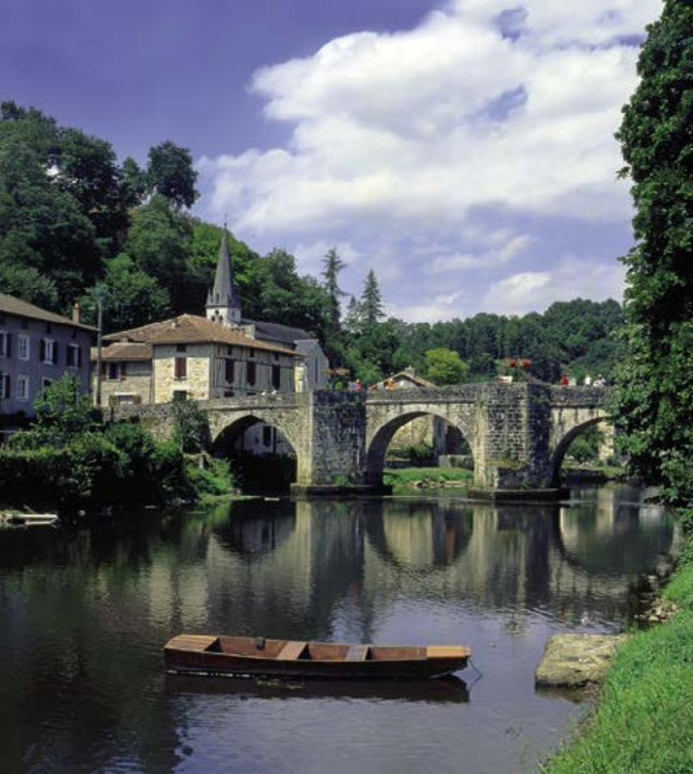
Svatojacobská poutní cesta prochází například Saint-Léonard-de-Noblat