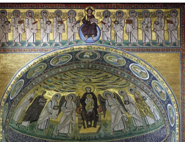
Mozaika v chrámu sv. Eufrazia v Poreči