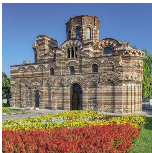
Chrám Krista Pantokratora v Nesebaru

Historie města Nesebaru na pobřeží Černého moře, ve starověku známého jako Manebria nebo Mesembria, sahá až tři tisíce let do minulosti. V místě původního thráckého sídla vznikla v 6. století př. Kr. řecká obchodní kolonie, která se později stala jedním z nejdůležitějších opěrných bodů Byzantské říše v regionu a také střediskem šíření raného křesťanství. Význam města přetrvával i po jeho dobytí Bulhary v 9. století, úpadek přišel až za časů Osmanské říše. V současnosti je Nesebar oblíbeným přímořským letoviskem, z historických památek se dochovaly zejména agora, Apollonův chrám, pozůstatky opevnění a bazilika založená v 5. až 6. století.