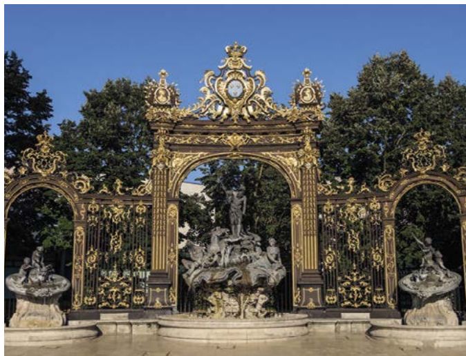
Zlatá brána a Neptunova fontána na Place Stanislas

Když v roce 1737 skončila válka o polské dědictví, sesazený polský a litevský král Stanisław I. Leszczyński se uchýlil do exilu do spojenecké Francie ke svému zeti Ludvíku XV. a získal titul vévody lotrinského. Jeho sídlem bylo Nancy, které nechal zvelebovat v moderním, osvíceneckém duchu a s ohledem na funkčnost a potřeby obyvatel. Dokladem tohoto velkolepého urbanistického plánu jsou zejména tři náměstí – rozsáhlá plocha Place Stanislas s reprezentativními budovami, obdélník Place de la Carrière a menší Place d'Alliance.