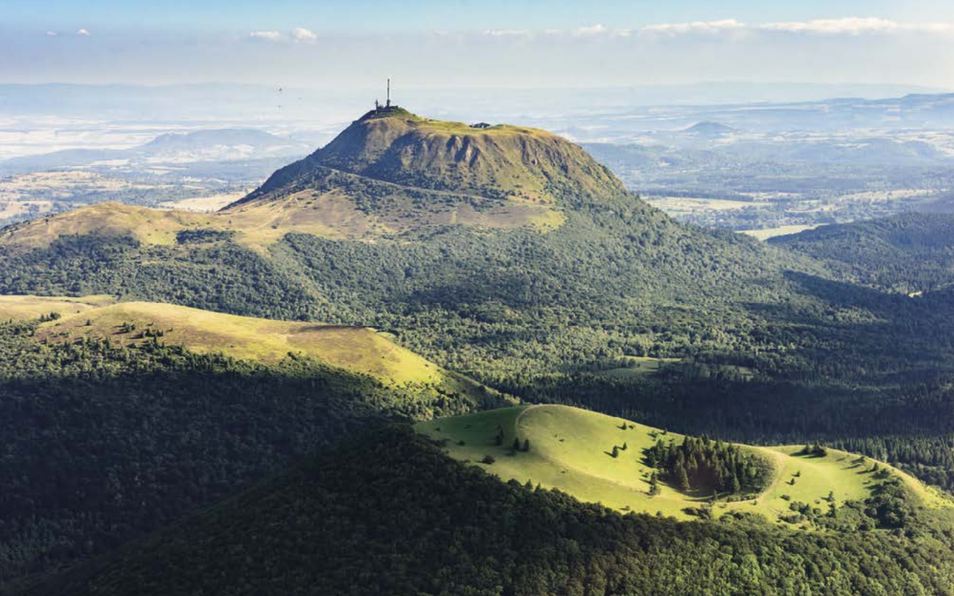
Vulkanické vrcholy Chaîne des Puys