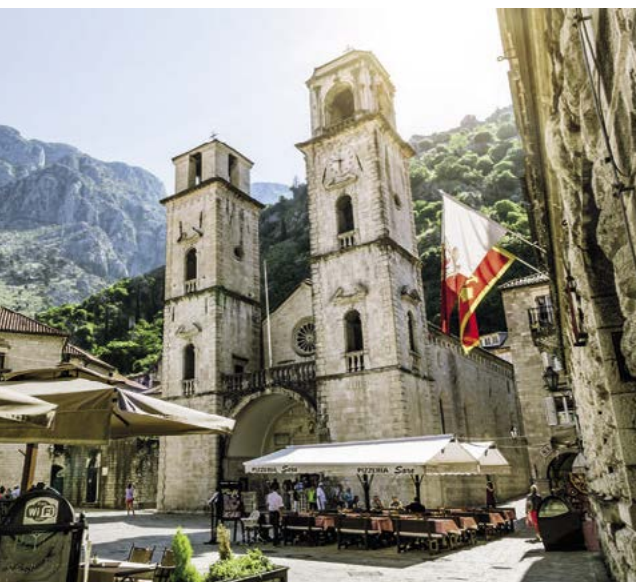
Katedrála sv. Tryfona