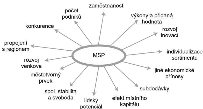
Obr. 1.1 Význam MSP v regionálním rozvoji

nižším stupněm ekonomického rozvoje nebo vysokou nezaměstnaností. Chládková (2010) ve svém příspěvku Specifika malých a středních podniků v ČR a EU popisuje, že MSP jsou schopny lépe pomáhat v regionech postižených strukturálními změnami, neboť zaměstnávají pracovníky z velkých podniků omezujících svou činnost. Obdobný názor zastávají i Kunešová, Cihelková a kol. (2006) i Křivková (2011), které doplňují, že tento pozitivní efekt byl zřejmý zejména v postkomunistických zemích, které se potýkaly s problémy v rámci přechodu z centrálně plánované ekonomiky na ekonomiku tržní. Problematikou MSP v regionálním rozvoji se zabývají i další autoři jako Adamčík (1997) a také Klímová (2007), která na obrázku 1.1 zobrazuje vybrané hlavní pozitivní efekty, které s sebou přináší existence sektoru malého a středního podnikání.