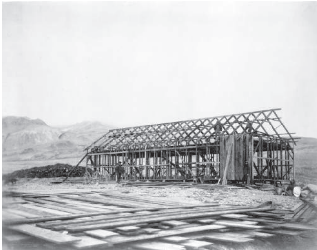
Stavba polární stanice Fort Conger.