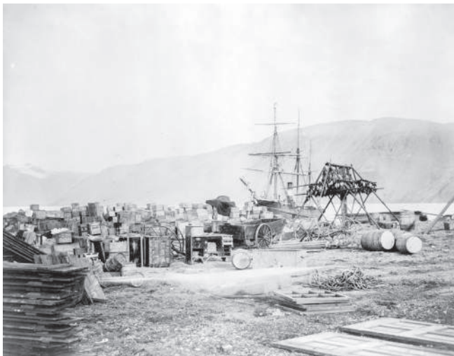
Vykládání Protea v přístavu Discovery Harbor.