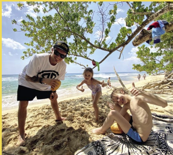
Tohle je naše kokosová pláž.