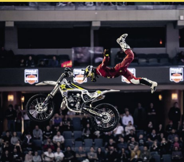
O letadélku Káněti aneb rock solid indy.