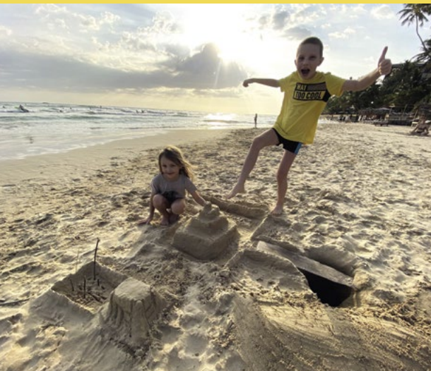
Hrad z písku číslo 5 238.