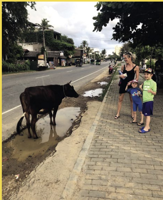
Kravičky si stejně jako psi chodí po Srí Lance, kudy chtějí. Takhle jsme si je občas hladili na naší Coconut Beach.