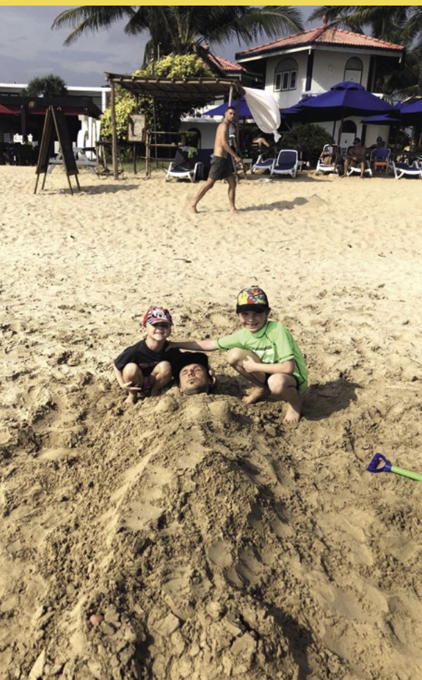
Tady jsem si dal pár piv k obědu a usnul na pláži. Moje milované děti toho hned využily a zahrabaly mě.