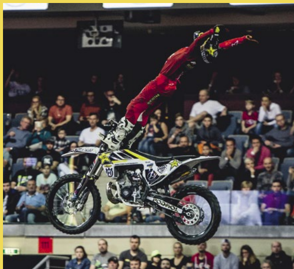
Cliffhanger. Tenhle triček byl jedním z prvních, který mi hodně šel, a jako jeden z prvních v Evropě jsem ho posunul do base jumpu – to znamená, že se při cestě zpět z triku nedotknete rukama řídek a dopadnete bez držení.