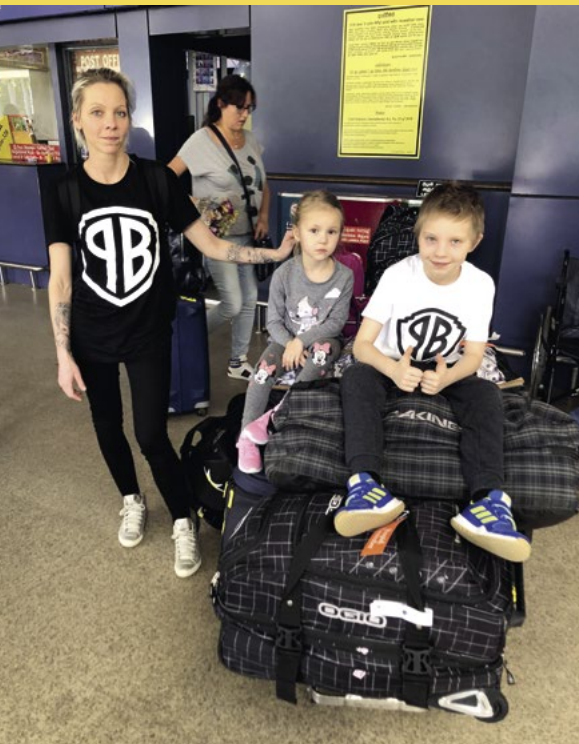
Lehce zmačkaní po 12hodinové cestě.