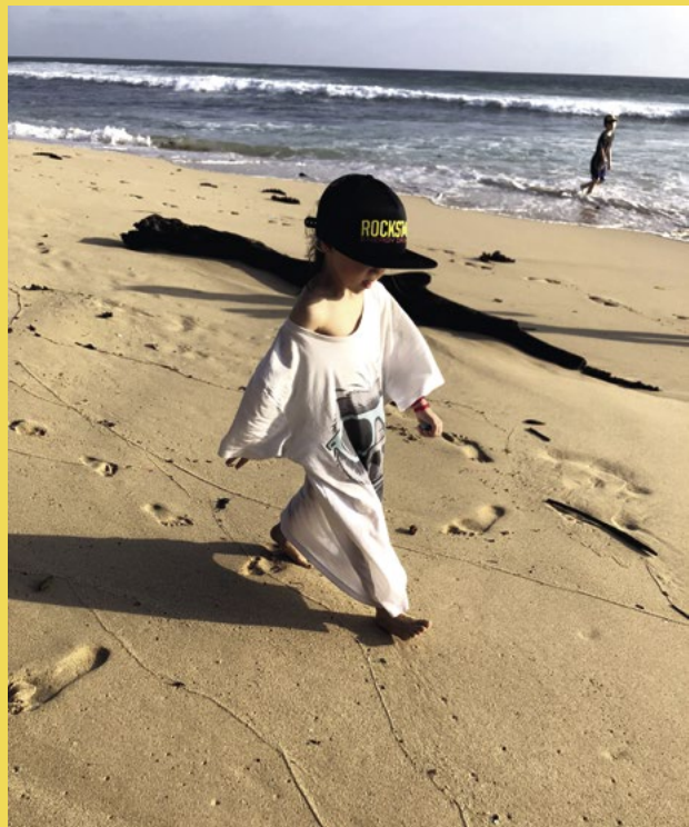
Ani jsme nevybalili tašky a Lili šla na pláž.