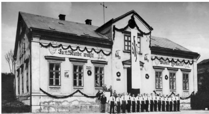
Konrad Henleins' Geburtsbaus in Maffersdorf am Wahltag 1935.