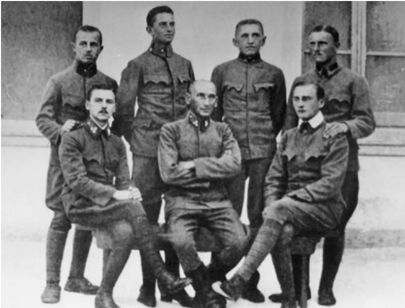
V zajateckém táboře (stojící druhý zleva).

se a koupat. [...] Po večeri tak ještě hodinu studuji, následuje cvičení na bradlech a šerm fleretem, a to třikrát týdně. Jsem předcvičovatelem prvního družstva a z mých žáků se stali skvělí turneři. Šermu mě učí jeden šermířský mistr z Vídně.“