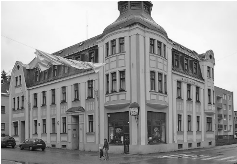
Budova rychnovského Vzájemného spořitelního a úvěrového spolku (dnes sídlo městského úřadu). V prvním poschodí bydleli Henleinovi.

Nepochybně pracovitý a obchodně zdatný, pobýval se svou rodinou ve Vídni; poté, jako zaměstnanec firmy Winter,