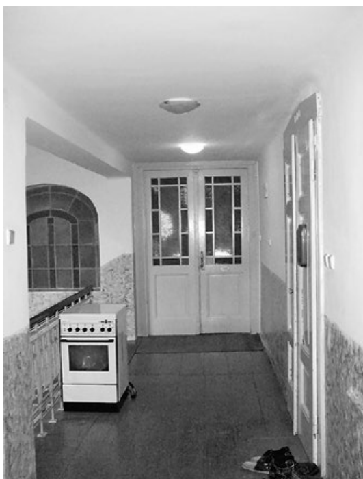
Za těmito dveřmi měli Henleinovi byt.

V německy psané Historii města Rychnova od 1. ledna 1901, sestavené kronikářem Wilhelmem Preisslerem na základě obecních protokolů, církevních knih a dalších pramenů, se lze dočíst ohledně roku 1914: „Toto zasedání městského zastupitelstva z 26. února 1914 bylo poslední, jež vedl starosta Anton Hübner. Poté, co vyšla na světlo denní ta skutečnost, že pan Hübner hrál ve věci zabeďnění hnojiště Antona Peukerta dvojí roli, když jako starosta nejdříve zabeďnění hnojiště nařídil a potom pro Antona Peukerta vlastní rukou odvolání proti svému vlastnímu rozhodnutí sepsal, nebylo možné, aby dále zaujímal čestné postavení