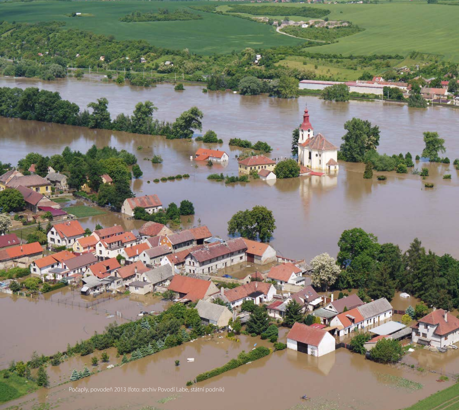
Počápy, povodeň 2013