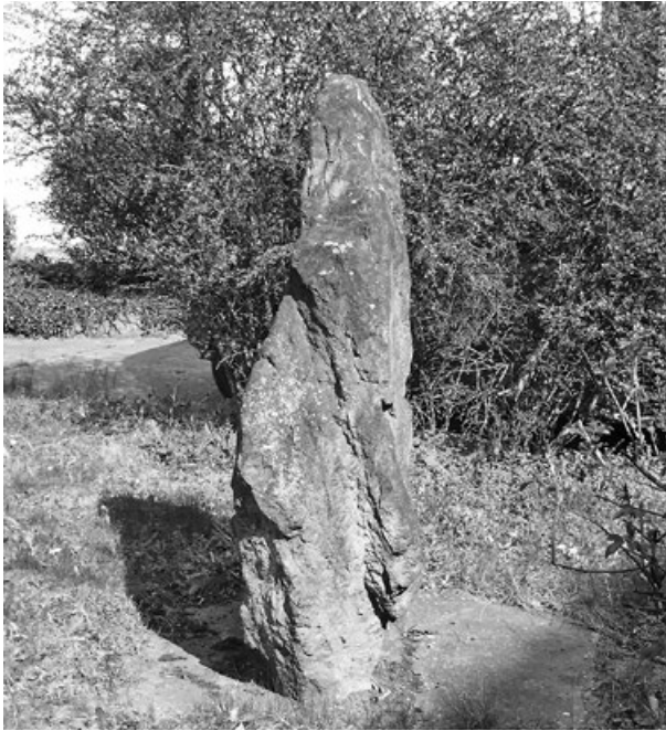
Kamenná stéla z Libenic