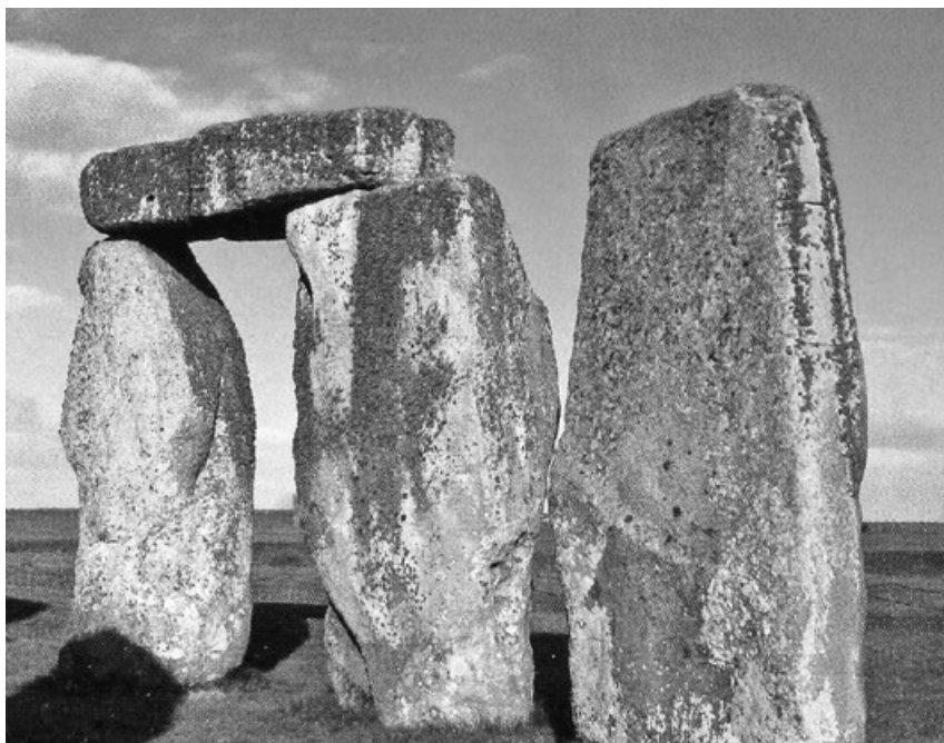
Trilit se vztyčeným kamenem

Trilit , jehož pojmenování pochází z řeckého „tri“ čili tři a „lithos“ neboli kámen, doslovně znamená „trojkámen“ či „tříkámen“. Je tvořen dvěma opracovanými vztyčenými kameny s kamenným překladem spojenými žlaby a čepy. Stojí o samotě. Představuje základní architektonický systém dvou pilířů a překladu, jemuž se říká architrávový. Nejvíce trilitů je v Bretani a z „trojkamenů“ je tvořena i část slavného Stonehenge. U nás zatím žádný trilit nalezen nebyl.