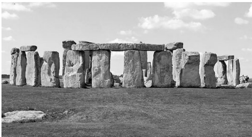
Rondel neboli objekt typu henge

Zvláštním typem kromlechu jsou skotské kruhy s ležatým kamenem. Kromlechy najdeme především na Britských ostrovech.