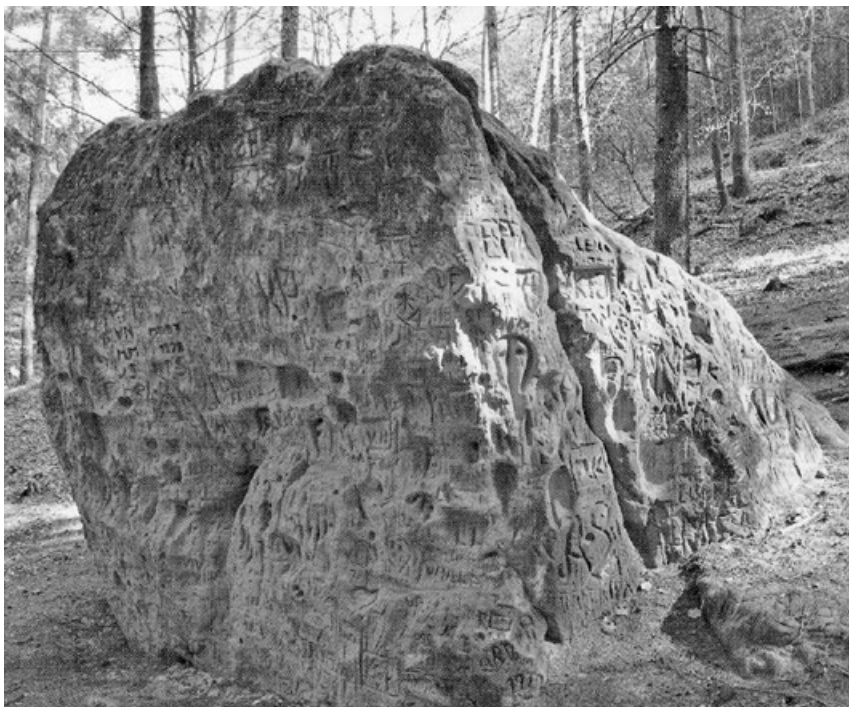
Krásný kámen, který lidová tradice připsala čertu

zajistil přízeň božstev, zdar a štěstí především sobě. Proč putovat daleko a dělit se o moc kamene s jinými, lepší je mít kámen jen pro sebe. Patrně z tohoto důvodu se začaly objevovat první vztyčené kameny neboli menhiry, které pocházely z místních zdrojů – na území českých zemích šlo nejčastěji o žulu, rulu, pískovec a vápenec –, často ale byly dopravovány z nalezišť vzdálených desítky nebo stovky kilometrů. Bylo to opravdu vyčerpávající, ne vždy bylo možné využít dopravu po vodě a potom musela nastoupit síla tažných zvířat, především volů, a lidských rukou. Pod někdy opravdu obrovské kameny byly vkládány válce či se nakládaly na sáně, ale mnohdy se prostě jen táhly. Ta vyčerpávající a dlouhotrvající námaha musela mít nějaký důvod, protože odváděla kmen či komunitu od lovu i dalších činností nezbytných pro přežití. To, co si od kamene nebo kamenů slibovali, pro ně muselo být ještě víc zásadní a důležité.