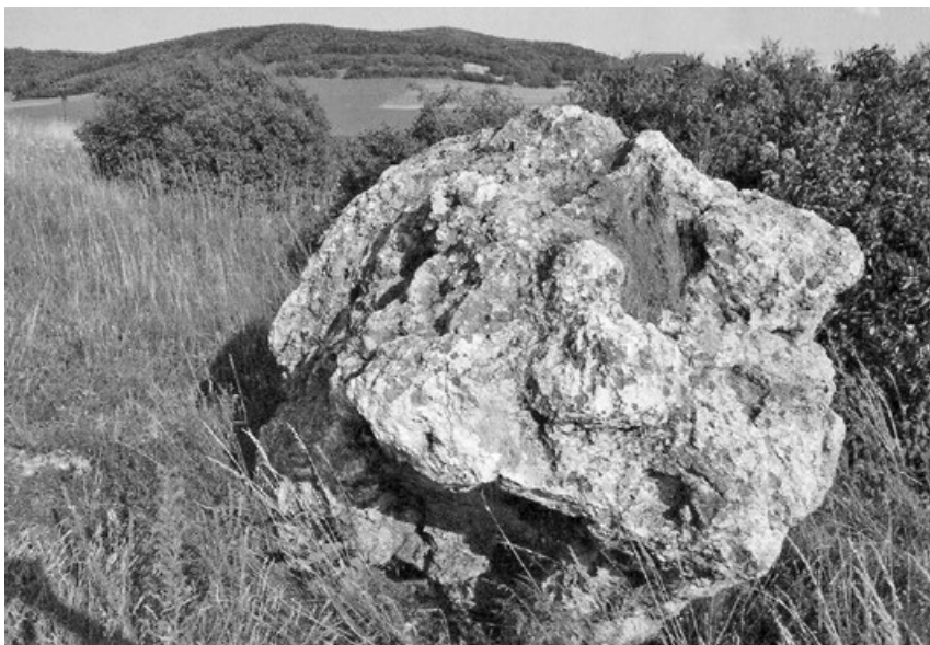
Kamenná svatba u Malhostic na Teplicku připomíná svatebčany proměněné v kámen

dopadl i majitel zámku v Branné na Šumpersku, který nechal hladovým poddaným dovézt místo chleba kameny z hor. Zámecký pán v Dobromilicích u Kojetína zase zabil své dvě manželky a jejich těla zahrabal ve sklepení zámku. Když měl v kostele svatbu s třetí chotí, zkameněl a je k vidění dodnes v podobě kamene zvaného Modrovous u sakristie svato-stánku. To loketský purkrabí Gerhard von Wüstenfelse zkameněl pro své velmi zlé činy – nechával těla popravených nořit do vřídelní vody a obalené vřídelním kamenem je pro výstrahu dával rozvěšovat před hradem. V podobě kamene byl v roce 1775 vytažen z hradní studně. Až pozdější zkoumání ukázalo, že jde o meteorit, který byl poté rozřezán a věnován různým muzeím. Na Lokti tak zůstala jen „menší část purkrabího“. Že český čert má na rozdíl od ďábla občas i smysl pro spravedlnost, dokládá hluboká strouha u Lázní Bělohrad na Jičínsku. Říká se jí Čertova brázda a vyoral ji čert pluhem, do kterého zapráhl dva nejkrutější pohůnky majitele zdejšího panství.