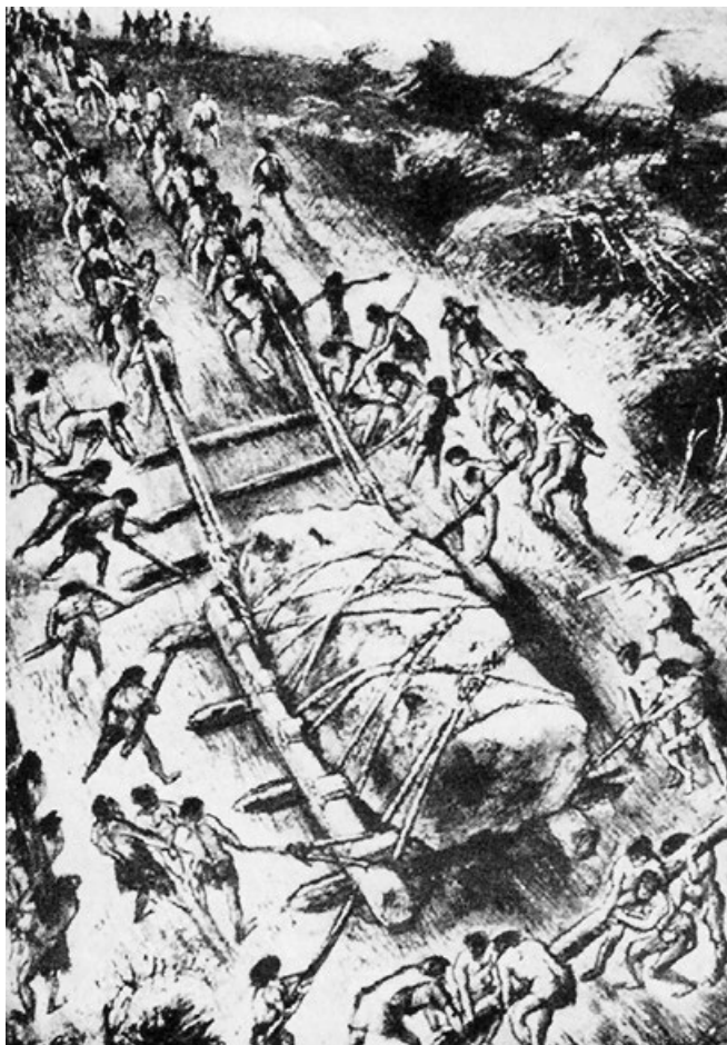
Tažení velkého kamene na saních podložených kůly

Někteří badatelé soudí, že vztyčování kamenů i stavba jiných megalitů byla součástí konkurenčního zápasu o životní prostor mezi migrujícími pastevci a usedlými zemědělci. Vymezovaly určité území, na něž si dělaly kmen či komunita nárok a současně ho měly ochraňovat před nepřáteli. To byl patrně jeden z důvodů, proč obdobím stavby megalitů prošly prakticky všechny pravěké kultury na všech kontinentech.