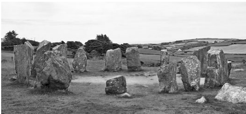
Kromlech neboli kamenný kruh