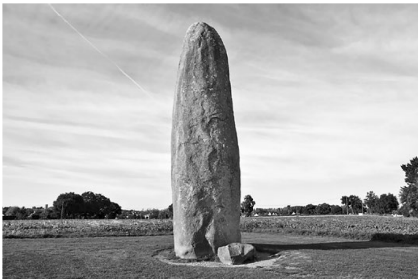
Menhir neboli vztyčený kámen

váze okolo 350 tun. Typickým příkladem našeho menhiru je Kamenný pastýř u Klobuk.