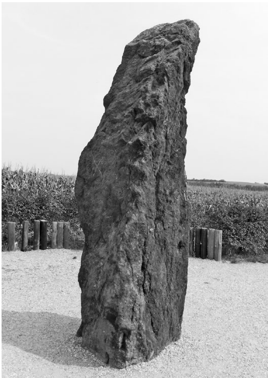
Náš nejznámější vztyčený kámen, Zkamenělý pastýř, stojí u Klobuk