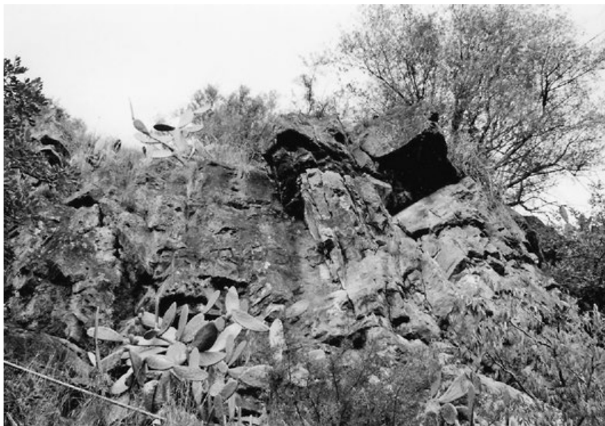
Jedna z mnoha Čertových skal

Vedle kamenů přinášejících požehnání a štěstí však byly také kameny, které působily cize a nepřátelsky, ať už pro svůj tvar či ještě častěji svým umístěním v krajině. Jak se mohl tak velký a těžký balvan dostat doprostřed lesa, louky nebo pole? Člověk ho tam určitě nedal, jako vysvětlení zbývaly proto pouze nečisté síly, které se snažily vždy lidem škodit. V Čechách, na Moravě i ve Slezsku to byl vedle obrů, trpaslíků a víl typických pro většinu Evropy nejčastěji čert neboli ďábel. Obě pojmenování se objevují v naší lidové tradici okolo 14. století, ale zatímco ďábel někdy v té době přišel ze západoevropské oblasti a byl opravdu vyslancem pekla, potom čert byl slovanský – šlo o původního pohanského běse (bese) neboli démona jako protipólu boha, a čert je tak výtvořem ještě předkřesťanské démonologie. Není také tak strašný a krutý jako ďábel či satan, obvykle při sázce s člověkem prohraje, protože ten se ukáže jako chytřejší a mazanější. Není však čerta dobré podceňovat, protože se stále snaží lidem škodit, a nakonec je odnést do pekla. Navíc