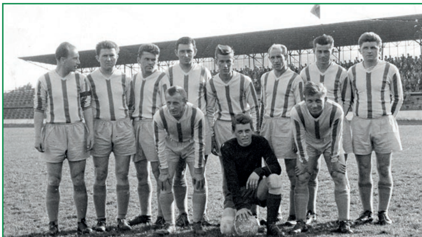
Rovněž táta byl oporou týmu, i když gólům jako brankář především zabraňoval

I když v té době toužil hrát závodně snad každý kluk, neboť nebylo moc jiných lákadel, litvínovský oddíl – jak se tehdy fotbalová se-