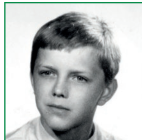
Členský průkaz ČSTV žáčka litvínovského klubu

Tréningy v oddíle mu nestačily, na jeho střeleckém růstu měl nadále velký podíl otec. Ve volných chvílích chodili na hřiště, kopali si, přihrávali, zpracovávali míč. A především stříleli. Patou, špičkou, celou botou. „Placírka, nárt, šajtle, musel jsem zvládnout všechno. Došlo i na vysmívané bodlo,“ popisuje procvičovanou techniku kopu, která se dnes už moc nenosí.