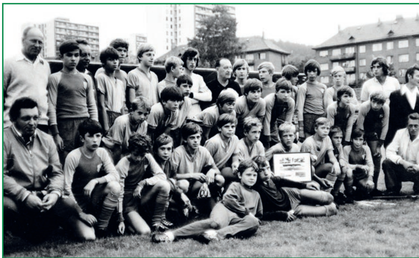
Diplom převzal ten nejlepší (Litvínov 1968/1969)