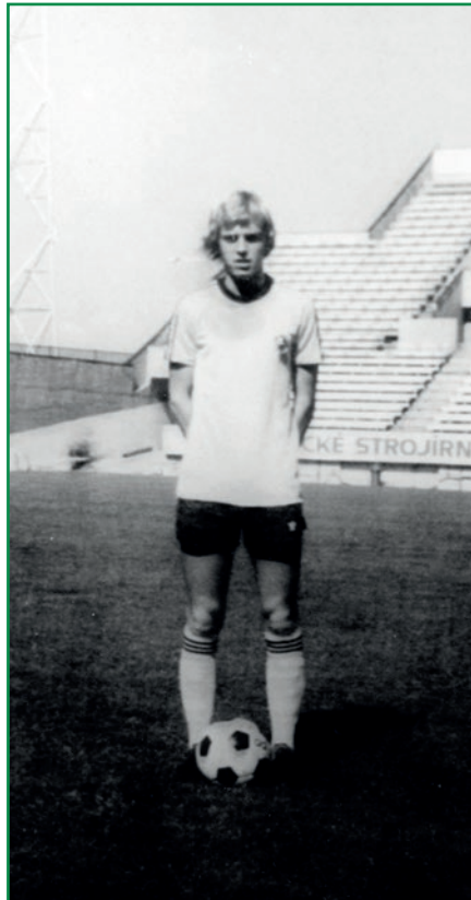
Teplický dorostenec na stadionu Na Stínadlech (1975)