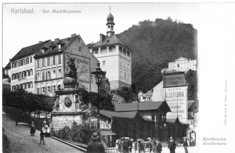
Morový sloup, Tržní kolonáda a Zámecká věž v roce 1898

historie zdejších lázní velmi hluboko do minulosti. V dobách, kdy v Loketské oboře lovil císař Karel, byly Vary už známým a proslulým místem. Císař zřejmě hledal úlevu v blahodárné minerální vodě, horké koupele zmírňovaly úporné bolesti jeho páteře, jimiž trpěl po záhadném úrazu; údajně se inkognito zúčastnil rytířského turnaje a úder dřevcem do brady mu zlomil čelist a poškodil krční páteř. Je skoro zázrak, že toto zranění přežil! Proto panovník během pobytu na Lokti pravidelně zajížděl do Varů.