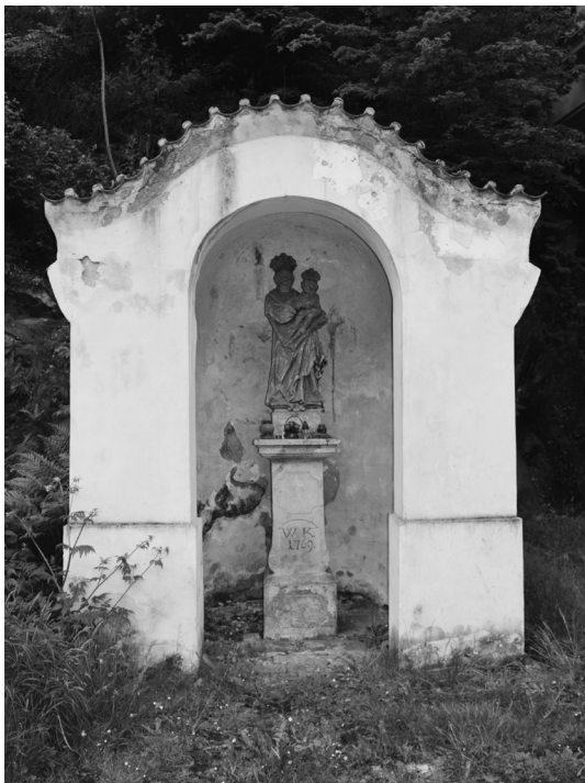
Výklenková kaplička u Rakovnického potoka

od matky, opuštěn otcem, bez možnosti dětských her s vrstevníky, vyjížděk do přírody a dalších zábav šlechtických dětí. Sice už tady nebyl držen v nějakém sklepení jako na Lokti, měl k dispozici několik pohodlných komnat, ale co to bylo platné, když je nasměl opustit? Maximálně se mohl procházet po hradním nádvoří a hradbách s doprovodem stráží. Odpovědnost za jeho bezpečnost nesl křivoklátský purkrabí Oldřich řečený Pluh.