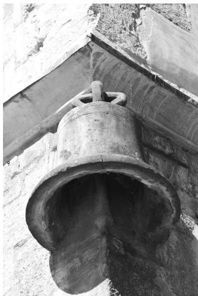
Kamenný zvon dal jméno výjimečnému domu

Důkladná regotizace vrátila domu téměř původní podobu, včetně tvaru střechy a oken, jejichž kružby se podařilo sestavit z kousíčků nalezených ve výplních zazděných oken a výklenků. Ve vnitřních prostorách byly odkryty dřevěné stropy a zpod omítek se vyloupily středověké nástěnné malby obou kaplí a audienční síně. V úplnosti byla odkryta také zdobná gotická fasáda. Ukázalo se, že výklenky mezi okny původně vyplňovaly kamenné sochy, posazené na konzolách a shora chráněné kamennými baldachýny. V nikách mezi okny prvního patra bychom kdysi viděli sochy krále a královny (Jana Lucemburského a Elišky Přemyslovny), sedící na trůně a po stranách doprovázené pěšími rytíři v plné zbroji. Snad to byli takzvaní štítonoši, ale také se usuzuje, že mohlo jít o podobizny jejich synů, princů Václava (Karla) a Jana Jindřicha. Torza těchto soch při rekonstrukci sestavil z úlomků restaurátor Jiří Blažej a dnes je můžeme vidět v kapli v přízemí. Sochy z výklenků dru-