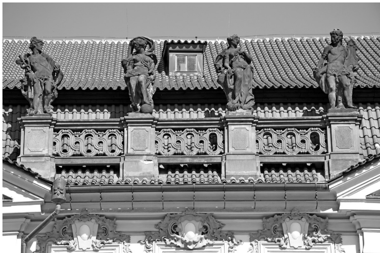
Sochy Ignáce Františka Platzera na atice paláce Golz-Kinských

zvonu. Toto rokokové sídlo bylo pro hraběte Jana Arnošta Golze postaveno podle plánů Kiliána Ignáce Dientzenhofera. Stavbu jako takovou v letech 1755-1765 řídil Anselmo Lurago, jeho následovník (ale nikoli zeť, jak bývá mylně uváděno), protože Dientzenhofer byl tou dobou už po smrti. V kontextu této kapitoly je pěknou shodou okolností, že Lurago zemřel roku 1765 ve svém domě U Černého slona – v onom malostranském. Fasádu vyzdobil štukatér Bossi, za sochařskou výzdobu vděčíme Ignáci Františku Platzerovi.