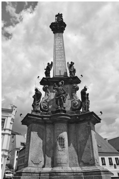
Sloup Nejsvětější Trojice v ulici T. G. Masaryka

byli brzy královským vojskem přemoženi – a trestu neušli. Vilém Zajíc z Valdeka byl zbaven úřadu nejvyššího maršálka a uchýlil se na své podbrdské panství; jeho místo zaujal jeho sok Jindřich z Lipé. Také bývalý opat zbraslavského kláštera Konrád, který se kdysi nejvíc zasloužil o příchod Jana Lucemburského na český královský trůn, se uchýlil do ústraní svého kláštera a vzdal se jakékoliv další politické a veřejné činnosti. Jen tím unikl pomstě zuřícího panovníka.