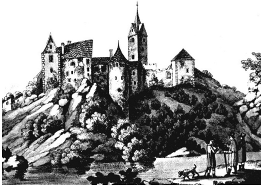
Loket na počátku 19. století

Půvabnou, byť trochu omšelou – a nespojitou – Zámeckou ulicí sejdem na hlavní náměstí T. G. Masaryka (za náměstí je považuji já, oficiálně jde překvapivě o ulici). Má zajímavý zakulacený tvar, volně kopírující jižní oblouk hradu, a opět jako by tonulo v jeho stínu. Přitom jsou tu zajímavé památky: pěkný trojiční sloup, dvě kašny a barokní radnice (v jejím areálu najdeme i městskou knihovnu a Muzeum knižní vazby); a celá řada hodnotných domů, původně gotických či barokních. Většinou prošly pozdějšími úpravami a dnes nastavují náměstí svá klasicistní, empírová či novorenesanční průčelí, takže si každý přijde na své. V mých očích jsou nejkrásnější sousední domy T. G. Masaryka 4/75 a Sobotova 10/2 (druhý jmenovaný skrývá Muzeum lázeňských pohárků).