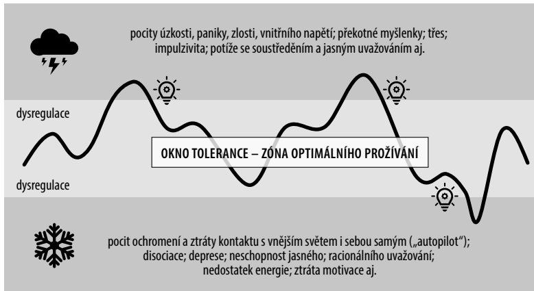
Obr. 2 Okno tolerance (vlastní zpracování, 2020)

z jejich okna tolerance, do kterého se následně nedokáží sami dostat zpátky. To u nich může vést k dalšímu prohloubení jejich pocitů bezmoci a zmatku i posílení dojmu, že nejsou „normální“ nebo že „blázní“, což se může projevit i snížením jejich motivace a snaze ke změně a růstu a ochotě dále pokračovat ve spolupráci. V případě překročení hranic okna tolerance nervový systém často reaguje automatickým přechodem do režimu přežití směrem k jednomu ze dvou pólů, kterými jsou stav nadměrného ( hyperarousal ) či naopak sníženého ( hypoarousal ) vnitřního napětí (psychické tenze) s mnoha typickými projevy, které prožívání v oblasti těchto pólů doprovází (NICABM, 2019). Nedostatečná schopnost zdravé seberegulace pak může být příčinou např. sebepoškozování, užívání návykových látek či agrese vůči druhým. Tyto stavy dysregulace se nejčastěji rozvíjejí v důsledku mnohočetného nebo dlouhodobého vystavení traumatu, např. při týrání nebo zneužívání v dětství, šikaně, domácím násilí či náročné léčbě vážného onemocnění (Corrigan et al., 2010).