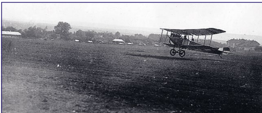
Albatros B.I Fliku 1 při startu na polním letišti na ruské frontě

Štěstí, které Jindrovi dosud přálo, ho opustilo 14. listopadu 1914. Toho dne letěl s poručíkem Maxem Hessem na průzkum ve svém Albatrosu do prostoru vsi Królik Wołoski. Tam je ale zasáhla kulometná palba ze země a 180 průstřelů, které jejich stroj utrpěl, jim již nedávalo