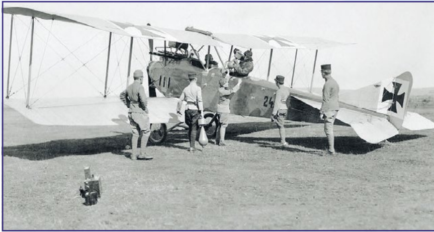
Nakládání pum do Albatrosu B.I