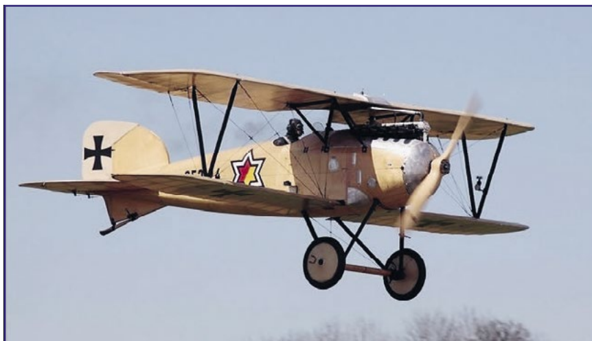
Moderní replika nejnebezpečnějšího dravce c. a k. letectva, stíhacího letounu Albatros D.III (Oeffag)

Letouny nejprve plnily jen průzkumné úkoly, avšak záhy propukly na obloze první letecké souboje a na účtech nejlepších letců začaly přibývat první sestřely. Samotný pojem „stíhací eso“ se zrodil v létě roku 1915 ve Francii. Byl jím označován letec, který dokázal sestřelit pět a více nepřátelských letadel. Došlo k tomu v době, kdy se na obloze objevily první jednomístné letouny vybavené vpřed střílejícím kulometem – stíhačky. Šlo sice o neoficiální, zato však velmi ceněný titul – snad každý pilot se toužil stát esem. Brzy ho také začaly užívat i ostatní světová letectva účastníci se Velké války a stíhací esa každé země se těšila velké popularitě. Jména jako Manfred von Richthofen či Georges