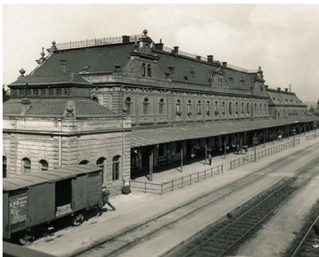
Svinovské nádraží s neobarokní budovou ve 20. letech 20. století.

... svinovské nádraží bylo propojeno železnicí s Opavou roku 1855?