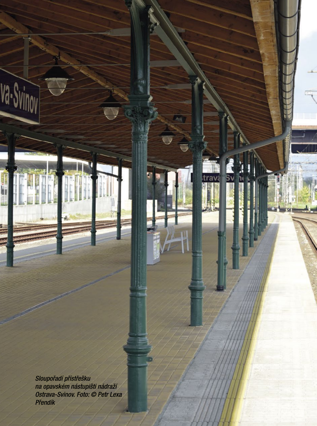
Sloupořadí přístřešku na opavském nástupišti nádraží Ostrava-Svinov.