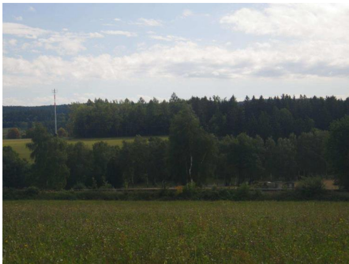
Pohled k šibeníku od východu, z cesty od židovského hřbitova

pozemkové knize, vedené od roku 1576. Na mapě prvního vojenského mapování ze šedesátých let 18. století je na nejvyšším místě černě zakreslena dřevěná, jednoduchá šibenice o dvou sloupech, i se zavěšováním. Vrchol návrší je dnes oplocen a nachází se v areálu středního odborného učiliště. Východně od školních budov se nachází volné zatravněné prostranství a zčásti zavezená lomová jáma. Tato část pozemků tvoří temeno návrší a zde také patrně šibenice stála. Stopy po někdejším popravišti už zde ovšem nenajdeme. S největší pravděpodobností si město Černovice nikdy nedrželo svého kata a k popravám tak byli zváni popravčí mistři z Tábora, Pelhřimova či Soběslavi. Zachovalo se však několik jmen pohodných a biřiců, což svědčí o faktu, že v době dávno minulé měl popravčí kam hlavu složit, když byl městskou radou zván k vykonání rozsudků.