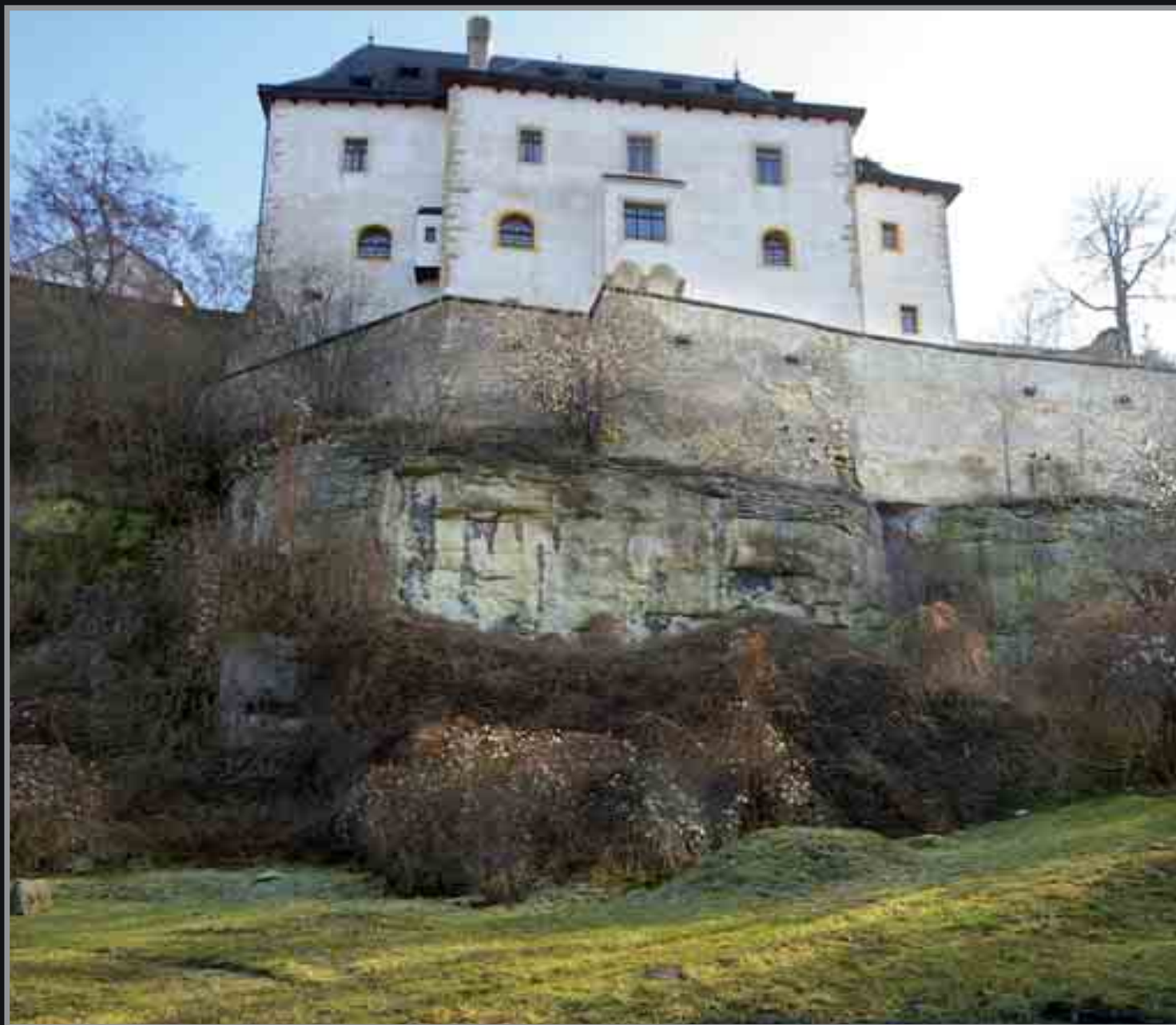
■ Budova paláce Templ (jejímž předchůdcem údajně byla komenda templářů) v Mladé Boleslavi je dodnes součástí starého městského opevnění.