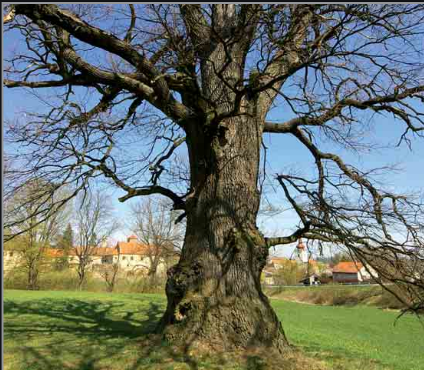
■ Před komplexem budov bývalé biskupské rezidence v Červené Řečici, kde údajně sídlili templáři, nás vítá mohutný památný staletý dub.