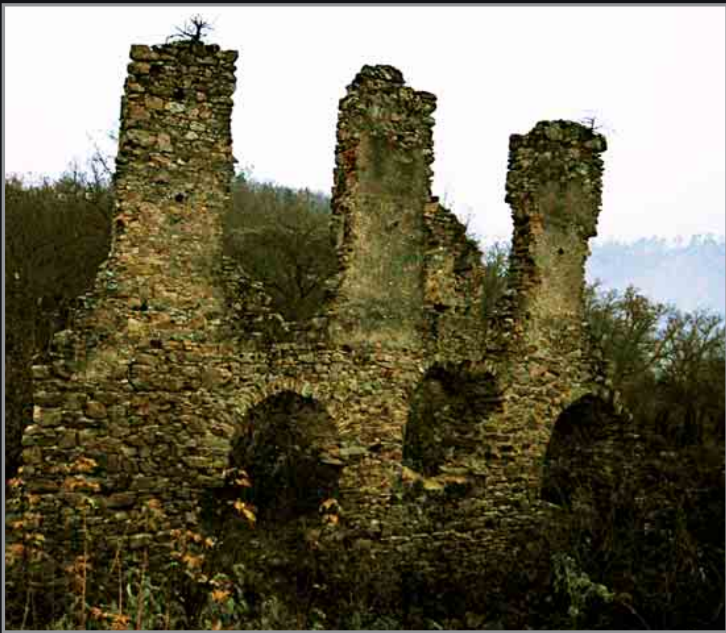
■ Templštejn (v okrese Znojmo) – jediný prokázaný „kamenný“ templářský hrad u nás.