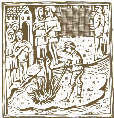
■ Upálení velmistra Jakuba z Molay a velkoreceptora Geoffreya z Charney (podle rukopisné Kroniky Francie ze 14. stol.)

Templáři byli třetí (zde myšleno po rytířích Božího hrobu a johanitech; pozn. autora), kteříž lidé po zemi Svaté provázeli a od násilí loupežníků chránili, a aby každý tím spíše k nim se utéci mohl, nejprve u chrámu hrobu Božího bydleti obyčej měli, léta 1103. Pročež od tehdejších králův Jerusálémských důchody a mnohými výsadami nad jiné obdarováni, a léta 1128. od papeže Honoría II. potvrzení byli; nosili oděv bílý, a červený kříž na něm. Ti ačkoli s jinými křesťany od pohanů z země Svaté vytištěni byli, však z štěd-