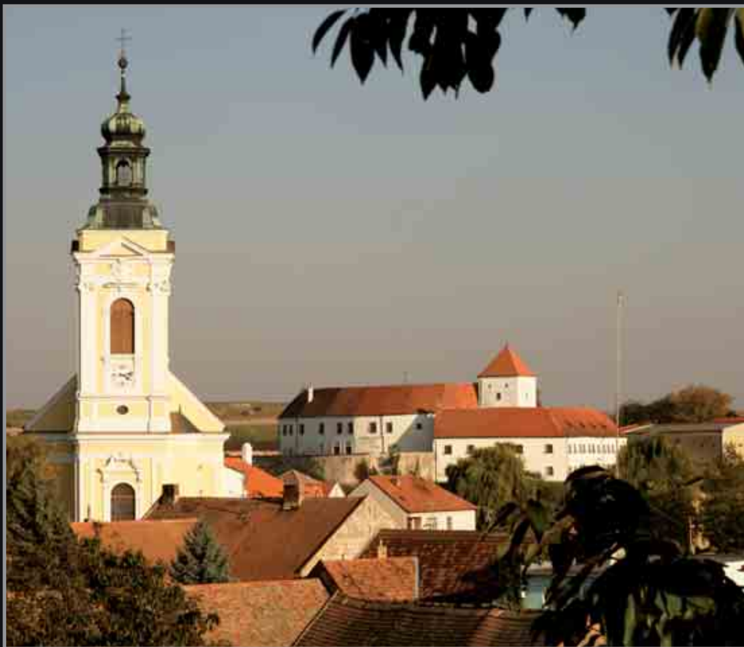
■ Čejkovice – prokázané sídlo zemského templářského komtura pro Čechy, Moravu a Rakousy.