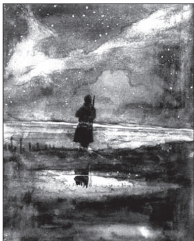
„Cassiopeia“ – obrázek z dentků Jiřího Hejdy, 1916 – voják pozorující na nebi souhvězdí Kassiopei (5,8 x 7,4 cm). (viz str. 10)

pauze, které je třeba k nabití děl, někdo z ruské strany přiblížil s minometem a hodil nám na hlavu minu. Díváme se na sebe vyděšeni, nikdo se neodvážá vystrčit hlavu ze zákopu, ačkoli víme, že pár kroků od nás je ruská hlídka, která na daný povel může vyskočit a zasypat nás ručními granáty. Není pochybnost o tom, že Rusové připravují útok, naše dělostřelectvo mlčí, jsou to jen ruské baterie, které ostřelují naše pozice, těžké granáty vybuchují někde daleko za frontou, kde je Povorek s velkým nádra-