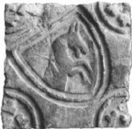
5. Znak Arnošta z Pardubic, gotický kachel z biskupského paláce na Malé Straně v Praze.

První doklady o Arnoštovi z Pardubic ho tedy spojují s Janem Lucemburským; všechna dosavadní literatura s naprostou samozřejmostí váže jeho vzestup na Karla IV. Přispěl k tomu jistě budoucí časový souběh působení obou mužů a jejich pozdější shoda a spolupráce, ale také jistá tradiční nechuť české historiografie ke králi Janovi. V letech 1338–1339 byl dosud králem Jan, byl to on, kdo byl při kurii dobře znám, kdo jako král korespondoval s papežem a vedl tu četná diplomatická jednání. Ostatně byl snad Arnoštův otec kdysi „zaměstnancem“ krále Jana a i to mohlo u něj mluvit ve prospěch syna. Arnošt se kolem roku 1333 opravdu mohl v Itálii, v době pokusu o Janovu severoitalskou signorii, setkat jak s Janem tak s Karlem Lucemburskými, ale nevíme o tom naprosto nic