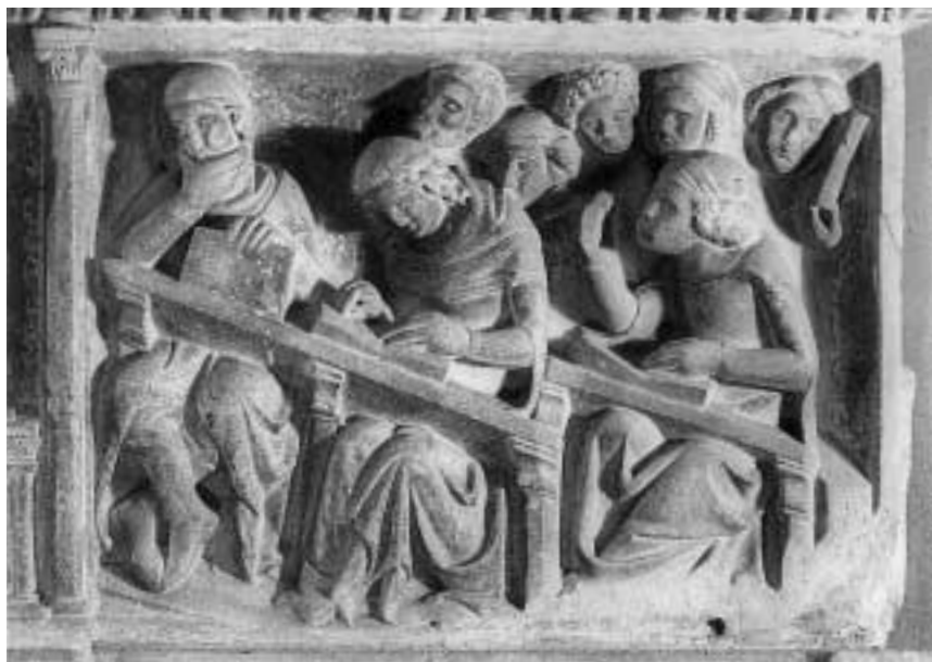
2. Detail boční stěny náhrobku Johanna Andreae († 1348), profesora práv na universitě v Bologni, Bologna, Museo Civico.

adept seznamoval se vším, co mu učený universitní svět mohl nabídnout, vedle práv ovšem především s filosofií a teologií a snad i s řečtinou a hebrejštinou, jejichž stolice zřizovaly alespoň proslulé university jako důsledek požadavků na hlubší vzdělání kléru, které zazněly na viennském koncilu (1312).