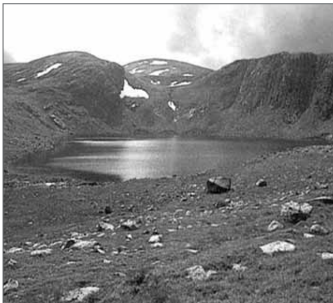
Horské jezero na úpatí hory Ben MacDhui

lidská postava. Upozornil na to ostatní, a když se všichni podívali stejným směrem, uviděli nezvyklou tvář, která se lidské nepodobala. Po pár týdnech jela táž skupinka okolo a zjistila, že ji sleduje stejná vysoká a tmavá bytost. Držela s nimi krok, i když uháněli rychlostí kolem sedmdesáti kilometrů za hodinu, až se konečně unavila a zastavila. Muži znovu pocítili úzkost a měli neblahé tušení.