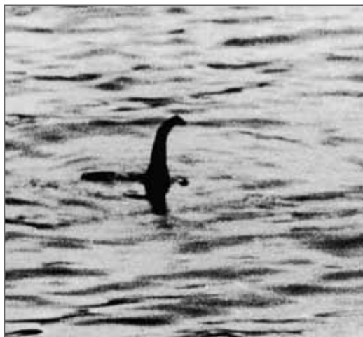
První fotografie lochneské příšery rozpoutala současnou lochneskou mánií.

Navzdory tomu, že spatření lochnesky ohlásilo přes tři tisíce jednotlivců, příšera jako by se ostýchala ukázat vědeckovýzkumným týmům. První rozsáhlou expedici uspořádala počátkem sedmdesátých let minulého století Akademie aplikovaných věd z Bostonu ve státě Massachusetts. Vybavena vodotěsnými fotoaparáty pro potápěče a ultrazvukovými lokátory pořídila snímky čehosi, co vypadalo jako dvouapůlmetrová ploutev a neobvyklé šestimetrové tělo uzpůsobené k životu ve vodě, a dokonce nezřetelnou fotku tváře. Avšak organizované hloubkové prozkoumání jezera sonarem v roce 1987, označené Operation Deepscan , odhalilo, že dříve pořízený snímek nezachytil nestvůru, ale pařez. Kromě toho sonar reagoval na různé neobjasněné předměty pohybující se ve velké hloubce.