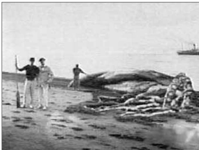
Obrovské tělo chobotnice, vyplavené na břeh Floridy. Je to bájný Kraken?