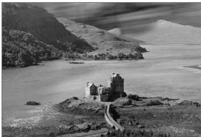
Loch Ness ve Skotsku. Je to snad domov plesiosaurova?

To je dlouhé skoro čtyřicet kilometrů a nachází se v mohutné rozsedlině Great Glenn, která rozděluje Skotskou vysočinu vejpůl. Hluboké je až tři sta pět metrů a široké místy až dva