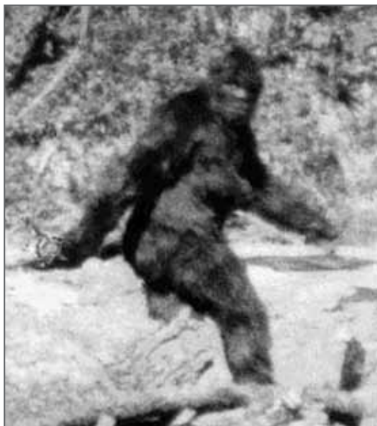
Obrázek z filmu Rogera Pattersona o sněžném muži

až příhoda, která se stala o devět let později, se postarala o to, že sněžný muž zakotvil v povědomí americké veřejnosti.