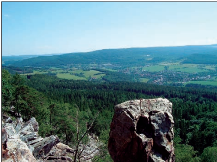
Pohled z Plešivce k jihozápadu

Plešivec je pojmenování dlouhé řady českých kopců, které byly na vrcholu pleché, tedy holé a bezlesé, nebo častěji ploché, protáhlé a zaoblené bez výraznějšího vrcholu. Mezi ty druhé patří i Plešivec, který je naším cílem. Leží ve vrchovině zvané Brdy, přesně tam, kde hluboké údolí říčky Litavky odděluje střední Brdy od pásma zvaného Hřeben. Právě Hřeben Plešivec uzavírá. Je to rebelant a samotář mezi brdskými kopci. Nestojí hezky ukázněně v řadě jako ostatní, ale rovnou kolmo k hřebenu. Právě to kromě nadmořské výšky 654 m způsobuje, že je mimořádně nápadný a zdaleka viditelný.