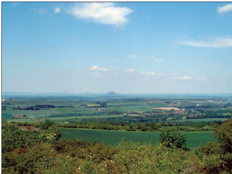
Pohled z Vinařické hory k Řípu

I na turisticky nepřilíh atraktivním Kladensku lze najít obecně známá místa. K nim patří také třetihorní sopka zvaná Vinařická hora. Označení hora je ale pro návrší s nadmořskou výškou 413 m poněkud nadnesené. Na západní straně má sice výraznou a dosti strmou stráň, ale z opačné strany se jeví jen jako malá vyvýšenina mezi poli. Je to však stratovulkán, který je od roku 1985 prohlášen přírodní památkou jako nejlepší ukázka tohoto typu sopky u nás s množ-