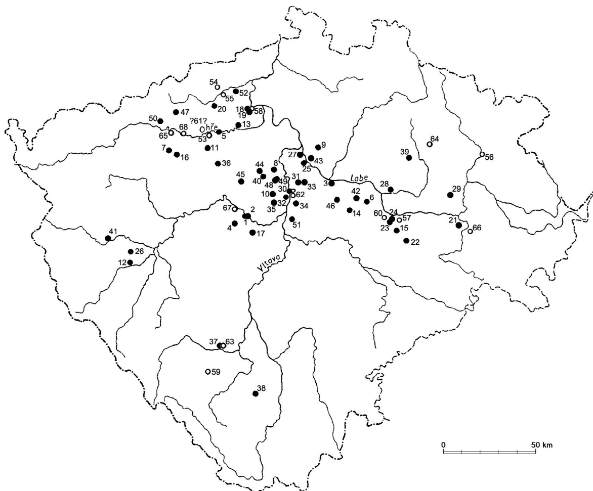
Mapa 1 Nálezy terra sigillaty v Čechách (plné kolečko – lokality uvedené v 1. části katalogu; kroužek – lokality uvedené ve 2. části katalogu).

Autorem části vyobrazení a fotografií jednotlivých kusů TS nebo germánské keramiky je autor této práce, část dokumentace pořídila či upravila G. Halam-Leite (těž sazba kreseb a fotografií TS). Některá vyobrazení jsou převzata z literatury citované u příslušných lokalit v katalogovém soupisu či v popisních tabulkách, map a obrázků.