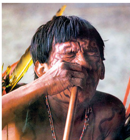
Obr. 4. Indián ze severozápadní amazonské oblasti šňupá pomocí dutého rostlinného stonku sušenou a práškovanou šťávu stromu Virola (Geo, 1990)

Nemedicínské aplikace. Nazální aplikace farmakologicky účinných látek je starého data. Nejstarším způsobem podání je šňupání, při němž se účinné látky vstřebávají nosní sliznicí, a působí celkově na organismus. Šňupání pochází z Ameriky. Indiáni používali tabák nejen ke kouření, ale i ke šňupání (obr. 4). Nejstarší látka používaná ke šňupání byla pravděpodobně paricá neboli niopo , která se vyráběla ze semen akácie ( Acacia niopo ). Šňupání sloužilo pro povzbuzení nálady při rituálních slavnostech. Jiným šňupacím prostředkem, který připravují domorodci v oblasti Orinoka, je yopo-cohoba z rostliny Piptadena peregrina . V nízkých dávkách působí excitačně a přivádí válečníky do bojové nálady, ve vyšších dávkách dochází k spánku až bezvědomí.