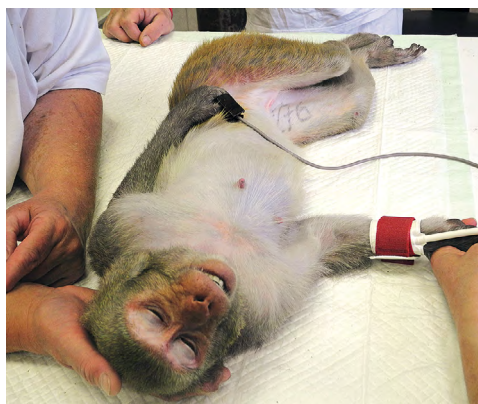
Obr. 2. Mezi nejčastější způsoby monitorace saturace hemoglobinu kyslíkem patří umístění sondy na prstech zvířete