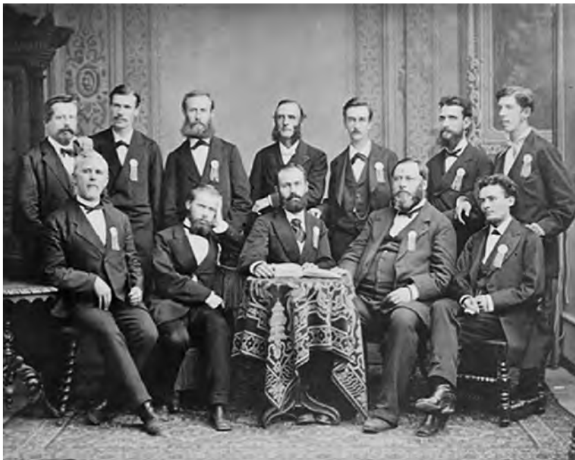
Obrázek 3. Členové prvního Mezinárodního výboru YMCA 13