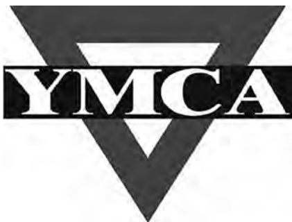
Obrázek 5. Znak organizace YMCA 31