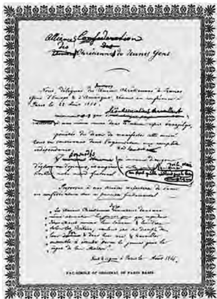
Obrázek 2. Ručně psaná dohoda o vzniku Světové aliance YMCA s náplní její práce 10

Myšlenky YMCA byly nadále hojně šířeny prostřednictvím G. Williamse, který podnikal obchodní cesty do zahraničí. Tak tomu bylo například v roce 1852, kdy Williams cestoval za obchodem do Francie. V Paříži tehdy sezval tamější pastory, kteří díky jeho finanční podpoře založili ve městě místní sdružení. Odtud se YMCA šířila dále do Nizozemí (1853), Německa (1883), kde navázala na sdružení evangelické mládeže, či na území dnešního Maďarska (1883). 9