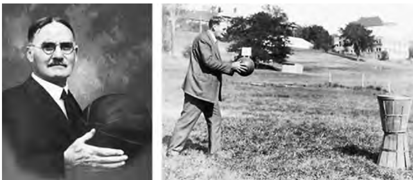
Obrázek 6. Zakladatel basketbalu James Naismith 32

školách chtěli věnovat tělovýchově. Po jejich dostudování našla velká část absolventů uplatnění na veřejných školách, univerzitách, kolejích atd. 33