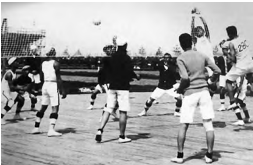
Obrázek 10. Volejbal na „Hrách Dálného východu“ v Tokiu 1917 63

Japonci se následně s mnohem větším nadšením účastnili dalších sedmi „Her Dálného východu“. 64 Hry, které se konaly v Ósace v roce 1923, navštívilo údajně 40 000 diváků denně. 65 Jejich tradice pokračovala až do roku 1934, kdy se v Manile uskutečnily hry poslední.