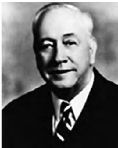
Obrázek 8. Zakladatel volejbalu William Morgan 39