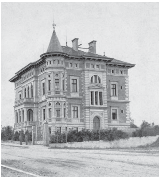
Žatecká vila, kde Mändlovi žili před válkou.