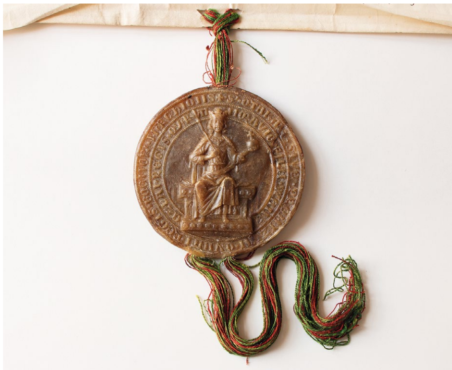
2. Pečeť krále Přemysla Otakara II., přivěšená k listině z roku 1264

porážku svých rytířských šiků i že takřka všemi opuštěn jest, přece nehodlal ustoupit našim vítězným praporům, nýbrž bránil se, olbřímí duchem i mravem, s podivuhodnou statečností, až někteří z našich rytířů jej smrtelně zraněného spolu s ořem jeho k zemi srazili. Tu konečně král ten přeslavný spolu s vítězstvím život ztratil (...).“