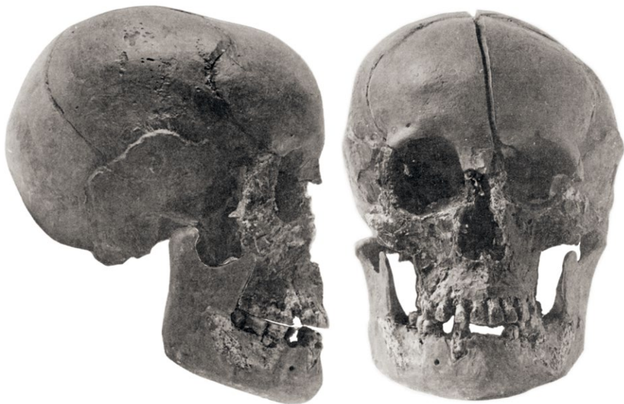
4a, b. Rekonstruovaná lebka Přemysla Otakara II. z boku a zepředu

Aby profesor Vlček mohl královi lebku vyšetřit, musel doplnit chybějící zetlelé části (obr. 4a, b). Přesto je patrná opravdu