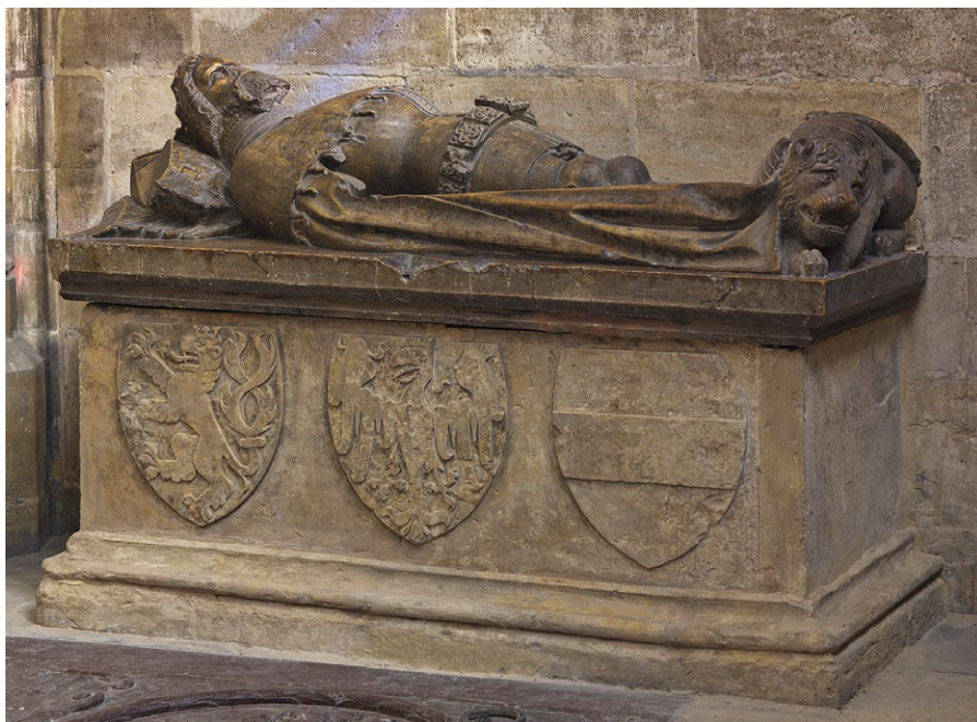
3. Náhrobek Přemysla Otakara II. v saské kapli katedrály svatého Víta

v roce 1281 postavil proti Rudolfovým pozdějším úmyslům, proto byl habsburským správcem Moravy vévodou Albrechtem II. Saským zajat a vězněn. Jak je uvedeno v kronikách: „zatčením pana Miloty a jiných moravských pánů začala válka na Moravě“.