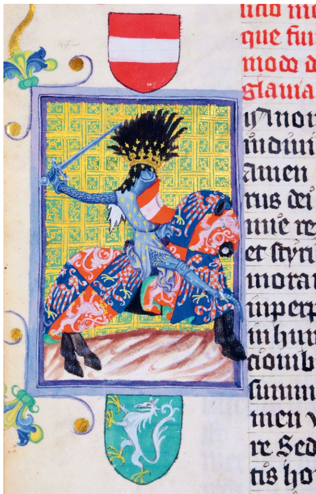
1. Jezdecký portrét Přemysla Otakara II. v Gelnhausenově kodexu