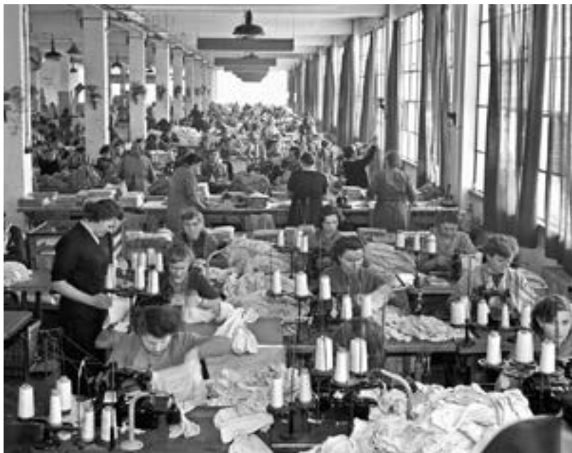
Výrobní hala národního podniku Jitex Písek, rok 1955