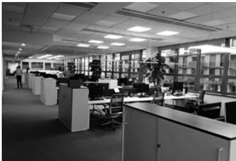
Open space kancelář, rok 2017 (soukromá sbírka autorky)