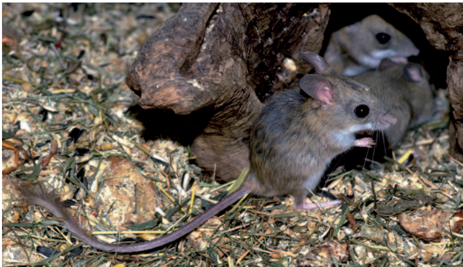
Klokanomys žlutohnědá (Notomys cervinus) připomíná na první pohled některé dlouhoocasé křečky, ale není s nimi vůbec spřízněna – pochází z Austrálie, kde křečci vůbec nežijí

Jeho pravým opakem je křeček největší ( Kunsia tomentosus ), jehož tělo může dosáhnout délky až 300 mm a ocas 160 mm. Ani ten však není největším křečkem, jak napovídá jeho jméno, protože chlupáč dlouhosrstý ( Lophiomys imhausi ) může měřit až 360 mm a jeho ocas má délku až 220 mm. Může dosáhnout hmotnosti až 920 g. Celkovou délkou ho však