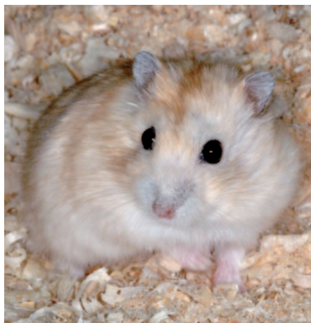
Křečík džungarský (gold)

Na tomto místě bychom chtěli poznamenat, že nás velice zklamal jinak vynikající