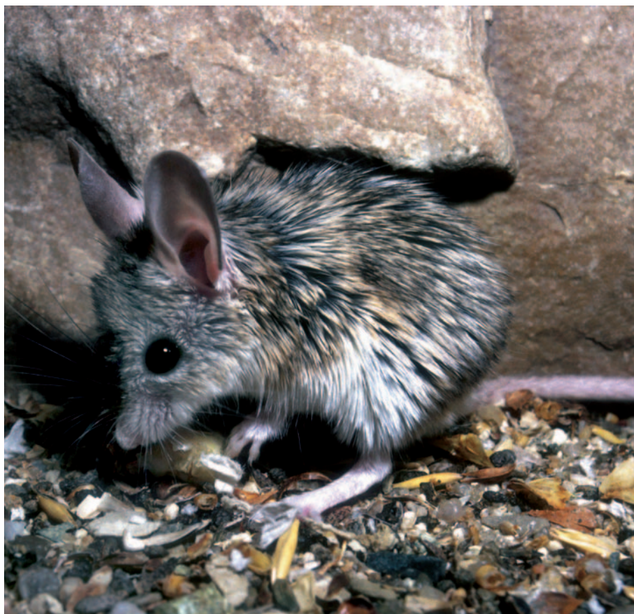
I drobný křečík myší se může při dobré péči dožít věku 9 let

neme. Každé zvíře, které se rozhodneme chovat, se zcela nutně stává naším partnerem, a proto způsobí v našem životě určité změny a kromě nových zážitků a obohacení života nám přinese i určitá omezení. Není tedy od věci položit si ještě před jeho pořízením několik otázek a poctivě si na ně odpovědět. V případech křečků bychom si měli rozmyslet především následující otázky: