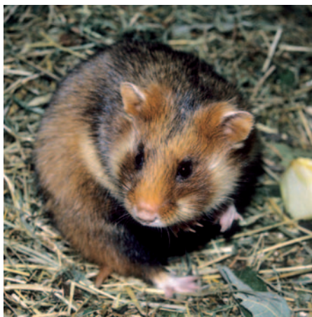
Křeček polní je typickým zástupcem eurasijských křečků

velkého hlodavce se zavalitým tělem, krátkým ocasem a objemnými lícními torbami. Již letmý pohled na křečka velkého, poskakujícího po silných zadních nohách po způsobu klokanů, nás přesvědčí, že křečci jsou mnohem různorodější, než by se na první pohled zdálo. Většina z nich dokonce vůbec našeho křečka polního, nebo nejčastěji chovaného křečka zlatého vůbec nepřipomíná, o čemž svědčí i to, že dříve byli označováni jako „krysy“, „myši“ či „lesomyši“. Přesto však tato zvířata určité společné znaky mají, i když „křečci“ ve smyslu českého názvosloví jsou skupina zcela umělá a jejich postavení mezi ostatními hlodavci není vždy úplně jasné.