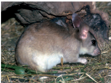
Křeček velký z Madagaskaru

srsti značně změnila, takže – zvláště u křečka zlatého – můžeme spatřit jedince s dlouhou hedvábnou srstí, rexy, či křečky saténové, kteří mají srst neobvykle lesklou. Ocas bývá, na rozdíl od myši, pokrytý hustými chloupky. Jeho délka je velmi variabilní, od několika málo milimetrů u křečků rodu Phodopus až po délku přesahující délku těla, například u křečků rodu Eliurus , kteří mají ocas navíc zakončený výrazným chvostkem z prodloužených chlupů. Nejmenším dosud popsá-