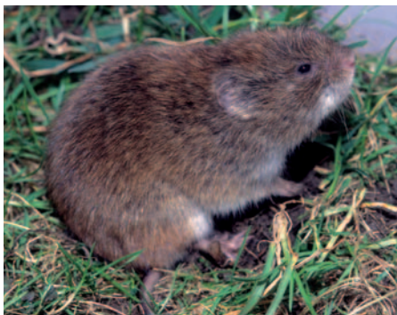
Hraboš východní ( Microtus fortis ) připomíná svou postavou některé americké křečky, ale v současné době stojí již v systému na jiném místě

Ne všichni však vypadají tak, jak si větší na lidí křečka představuje – tedy jako středně