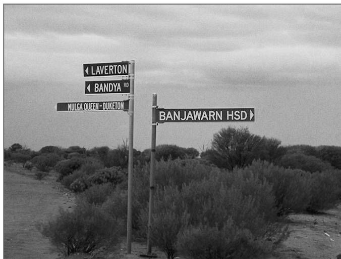
Nehostinná krajina v okolí Banjawarnu

K něčemu velmi podobnému totiž došlo i v noci z 28. na 29. května roku 1993 v blízkosti velmi odlehlého ovčího ranče Banjawarn, 130 kilometrů východně od města Laverton v Západní Austrálii.