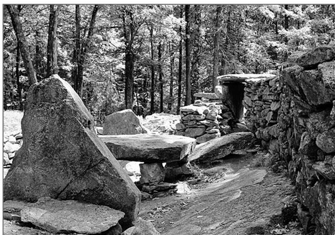
Megality na Zázračném kopci

Zatímco megalitické památky Starého světa vešly v obecnou známost, o těch amerických mnoho nevíme. Lépe na tom nejsou ani sami Američané. Snad právě proto rozsáhlou kamennou stavbu nedaleko Salemu ve státě New Hampshire pojmenovali America's Stonehenge. Jedním dechem však zároveň dodávají, že s tím evropským Stonehenge nemá ale vůbec nic společného. Což je nejspíš pravda.