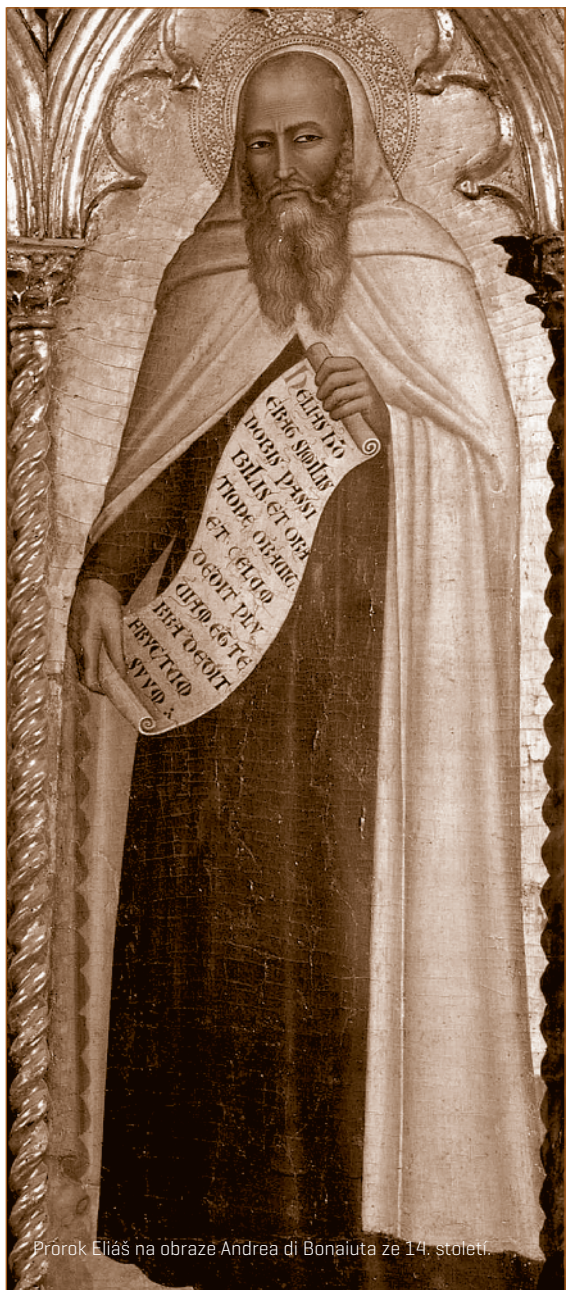
Prorok Eliáš na obraze Andrea di Bonaiuta ze 14. století.

Ve vlastním textu Bible, speciálně ve Starém Zákoně, najdeme jeskyně i na několika dalších místech. Jeden z příběhů pochází z doby sváru mezi králem Saulem a Davidem. Když David utekl před Saulem, usadil se v jeskyni na nepřístupných vrcholcích u Ěn-gedí. Když se Saul vrátil ze stíhání Pelištejců, oznámili mu: „Hle, David je v poušti Ěn-gedí.“ Saul tedy vzal tři tisíce mužů vybraných z celého Izraele a vydal se Davida a jeho muže hledat. Pro určité místo a činnost používáme opisné vyjádření, že se jedná o místo, kam i král musí pěšky. Přesně jedno takové místo si potřeboval najít i Saul a zvolil si k tomu jeskyni. Shodou okolností stejnou jeskyni, ve které se ukrýval David se svými druhy. Tu Davidovi jeho muži řekli: „Toto je den, o němž ti Hospodin řekl: ‚Vydám ti do rukou tvého nepřítele.‘ Můžeš s ním naložit, jak se ti zlíbí.“ David ale nechtěl zabít Saula tímto způsobem. Navíc respektoval, že je Saul král, a tudíž Bohem pomazaný. Celý