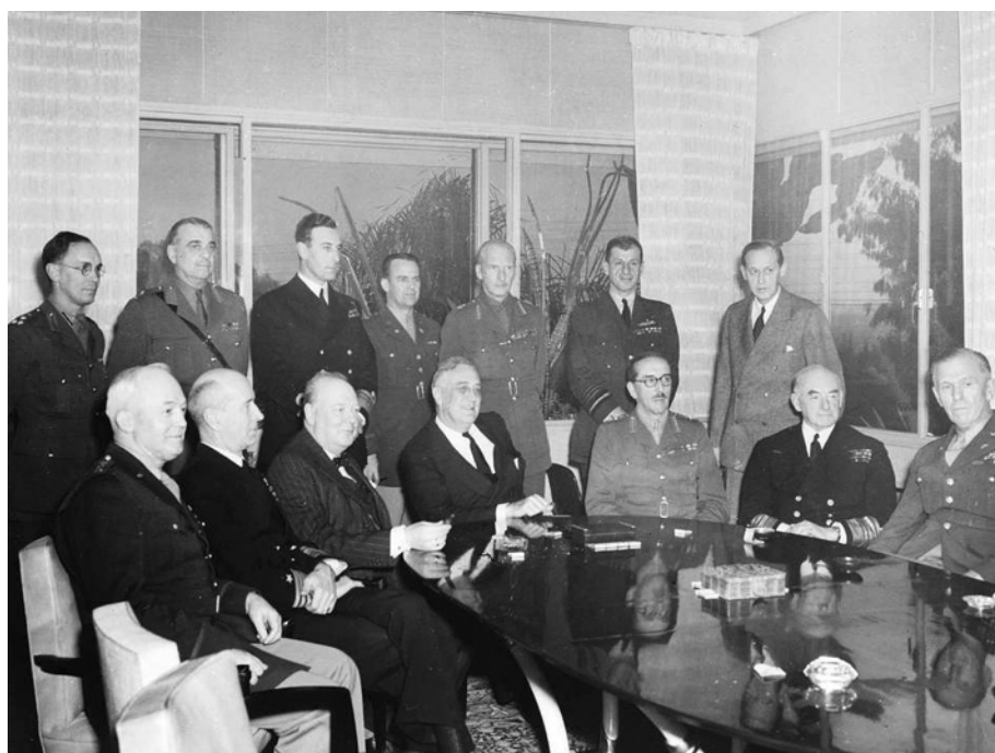
Američtí a britští vojenští představitelé během jednání na konferenci v marocké Casablance v lednu 1943. Sedící třetí zleva je zachycen britský premiér Winston Churchill, po jeho levici sedí americký prezident Franklin Delano Roosevelt.

Koncem roku 1942 a v roce 1943 pokračovalo strategické bombardování Německa a jím okupovaných území. Již v únoru 1942 se přitom britská strana rozhodla pro metodu plošného bombardování městských aglomerací a předehrou k těmto masovým úderům se staly tzv. tisícové nálety britského Velitelství bombardovacího letectva na Kolín nad Rýnem (30. května), na Essen (1. června) a Brémy (25. června). Po konferenci v Casablance a přísunu prvních součástí 8. letecké armády