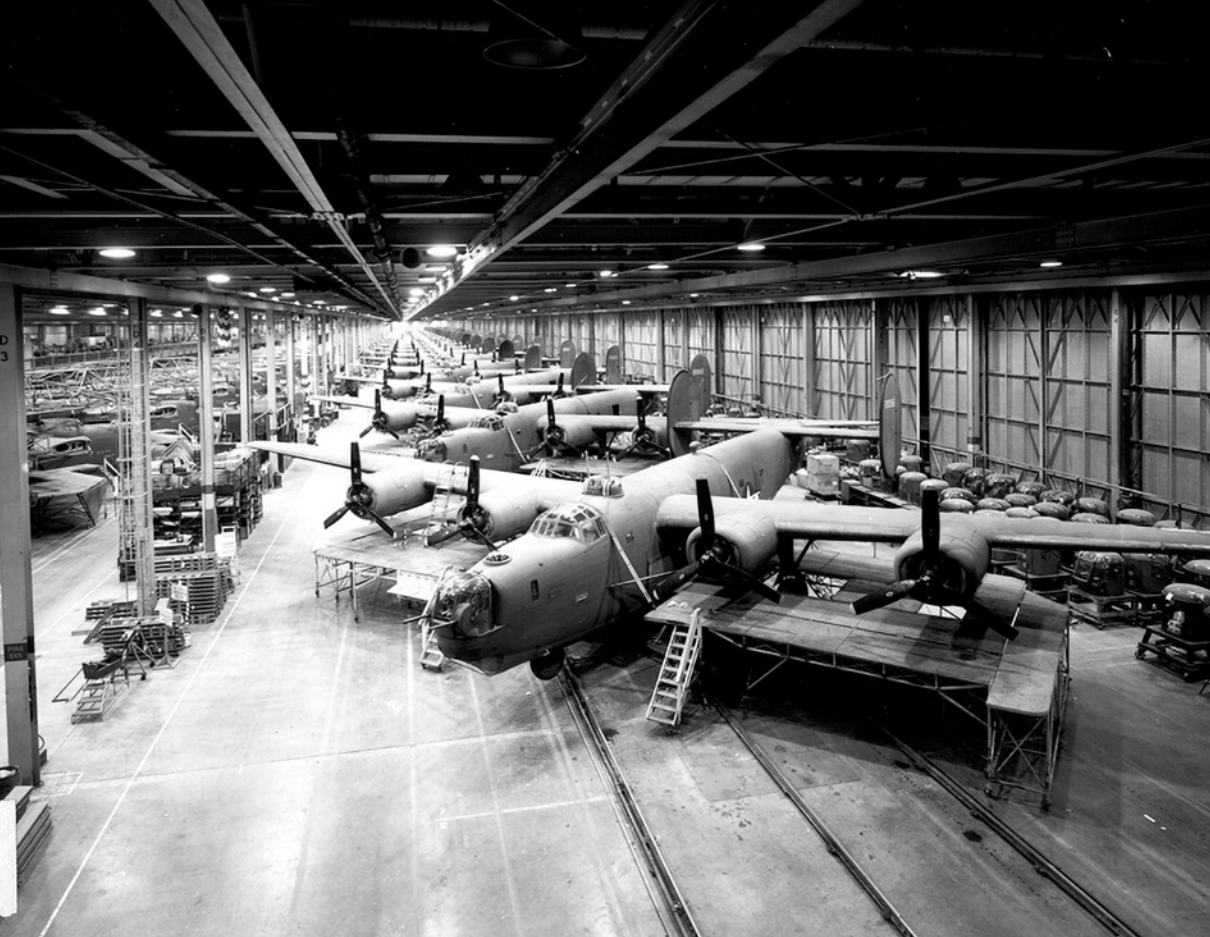
Výroba letounů B-24 Liberator u Ford Motor Company ve Willow Run, Michigan.

Motory typu Pratt & Whitney, zabudované do křídel, byly dvojhvězdicové, vzduchem chlazené čtrnáctiválce typu R-1830-43 (eventuálně 65) Twin Wasp s reduktory a turbokompresory, každý o maximálním výkonu 895 kW (1 200 k). Na motorech byly osazeny třílisté vrtule Hamilton Standard (Constant Speed) o průměru 3,5 m.