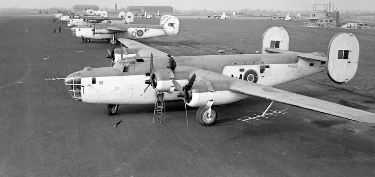
Letouny Liberator GR Mk.III (v popředí FK228 „M“ a FL933 „O“) od 120. perutě RAF na letišti Aldergrove. Stroje jsou vybaveny radarem ASV Mark II.

který za využití zaměřovače zavěšené nálože/pumy ve vhodné chvíli elektrickým systémem odhodil. Speciální utajovanou zbraní, již bylo možno rovněž zavěsit do pumovnice (maximálně 2 kusy, místo hlubinných náloží a pum), bylo americké samonaváděcí, akusticky řízené torpédo Mark 24 Mine. Pumovnice byla rozdělena na přední a zadní část. Vrata pumovnice (celkem 4) měla podobu segmentových rolet (2 na každé straně), pojízdných v obou bočních stěnách trupu.