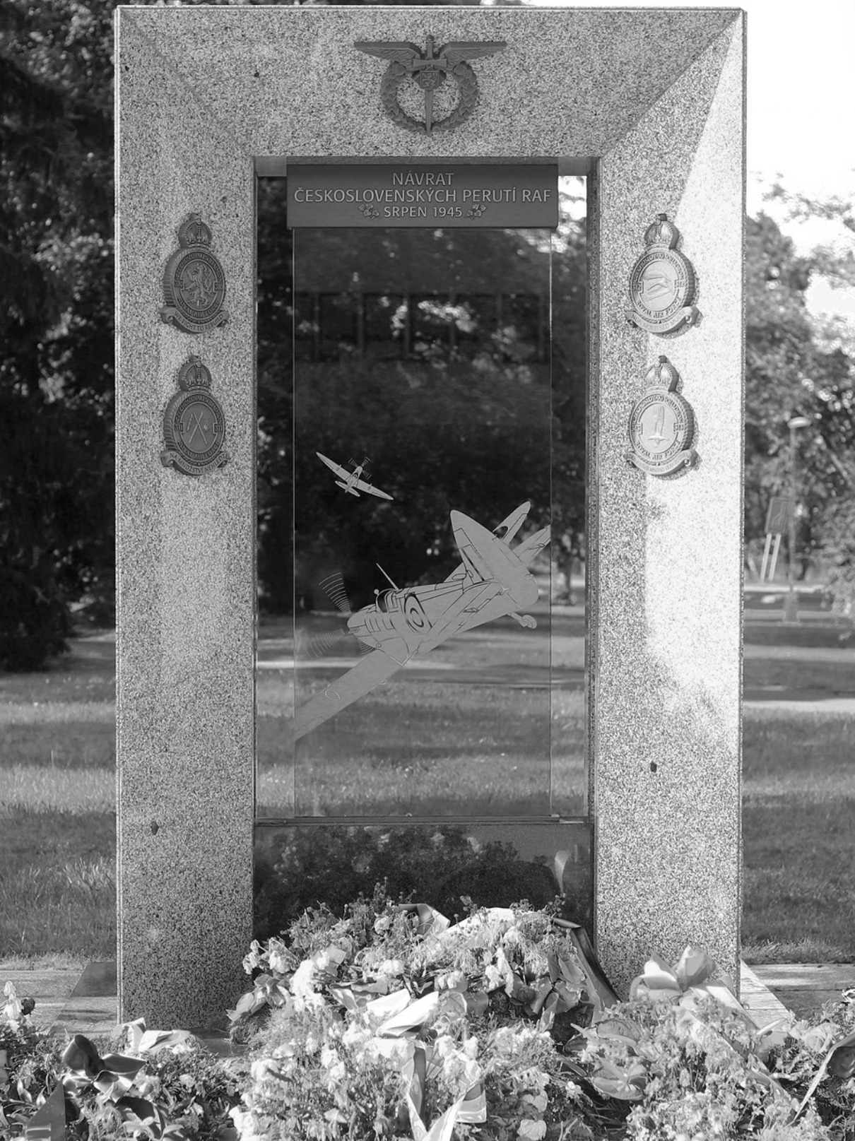
Památník 70. výročí návratu československých perutí RAF. Dílo Martina Zajíčka bylo odhaleno 24. srpna 2015 v parku u haly starého ruzyňského letiště v Praze.