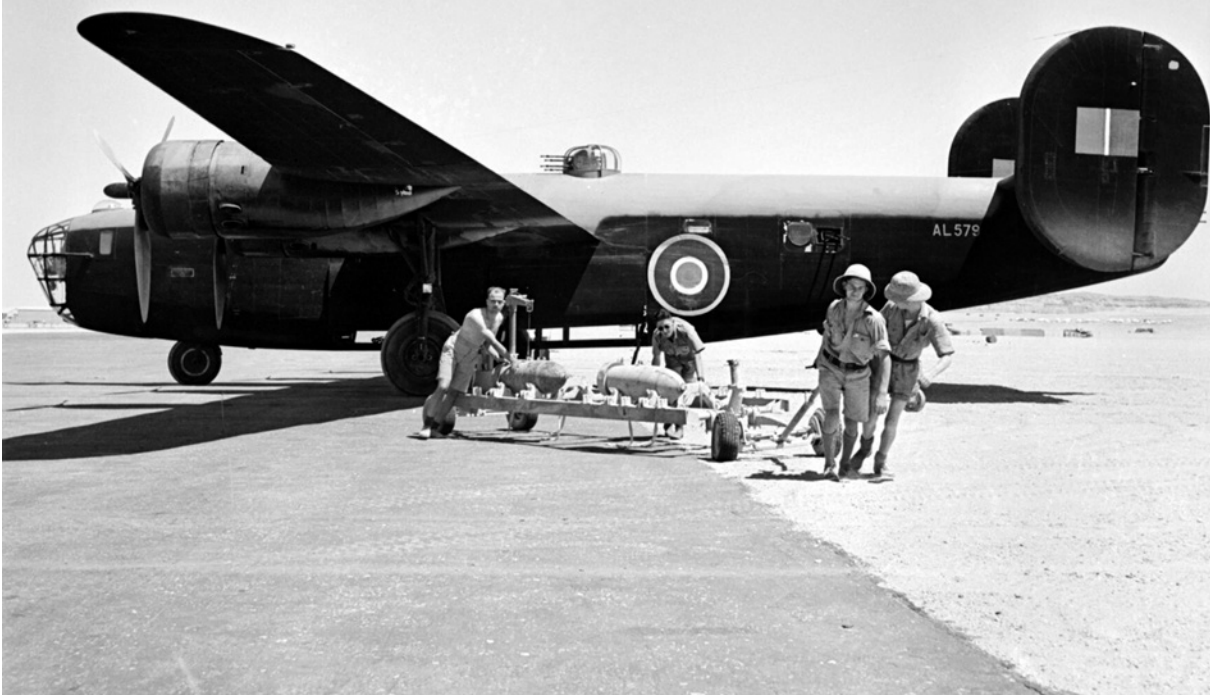
Consolidated Liberator B Mk.II (AL579) od 159. perutě RAF na letišti Fayid v Egyptě. Zbrojíři připravují k použití 500librové pumy.

1942 i verze GR Mk.III. Později používala i verze GR Mk.V, VI a VIII. Operační činnost při doprovodu konvojů a protiponorkových patrolách v Atlantiku zahájila 120. perut' v září 1941. Až do října 1942 byla jedinou bojeschopnou jednotkou Velitelství pobřežního letectva vyzbrojenou letouny Liberator.