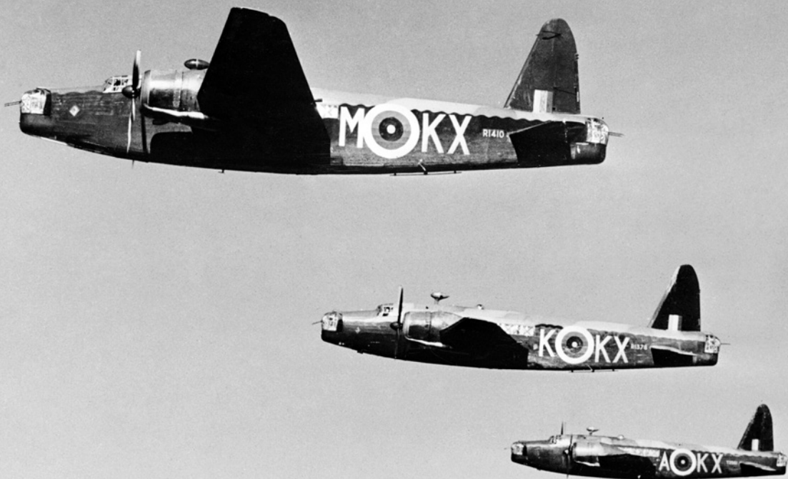
Letouny Vickers Wellington Mk.IC 311. československé bombardovací perutě, březen 1941.

V době od svého prvního nasazení 10. září 1940 do 25. dubna 1942 vykonala 311. perutě celkem 1 029 operačních letů (jen v 89 případech letouny svého cíle nedosáhly) v celkovém čase 5 192 operačních hodin. Útoky byly vedeny na celkem 77 různých cílů v Německu, okupované Francii, Belgii, Nizozemsku a v Itálii. Na tyto cíle jednotka svrhla přibližně 1 310 tun pum (z toho cca 1 132 tun klasických tříštivo-trhavých a 178 tun zápalných pum).