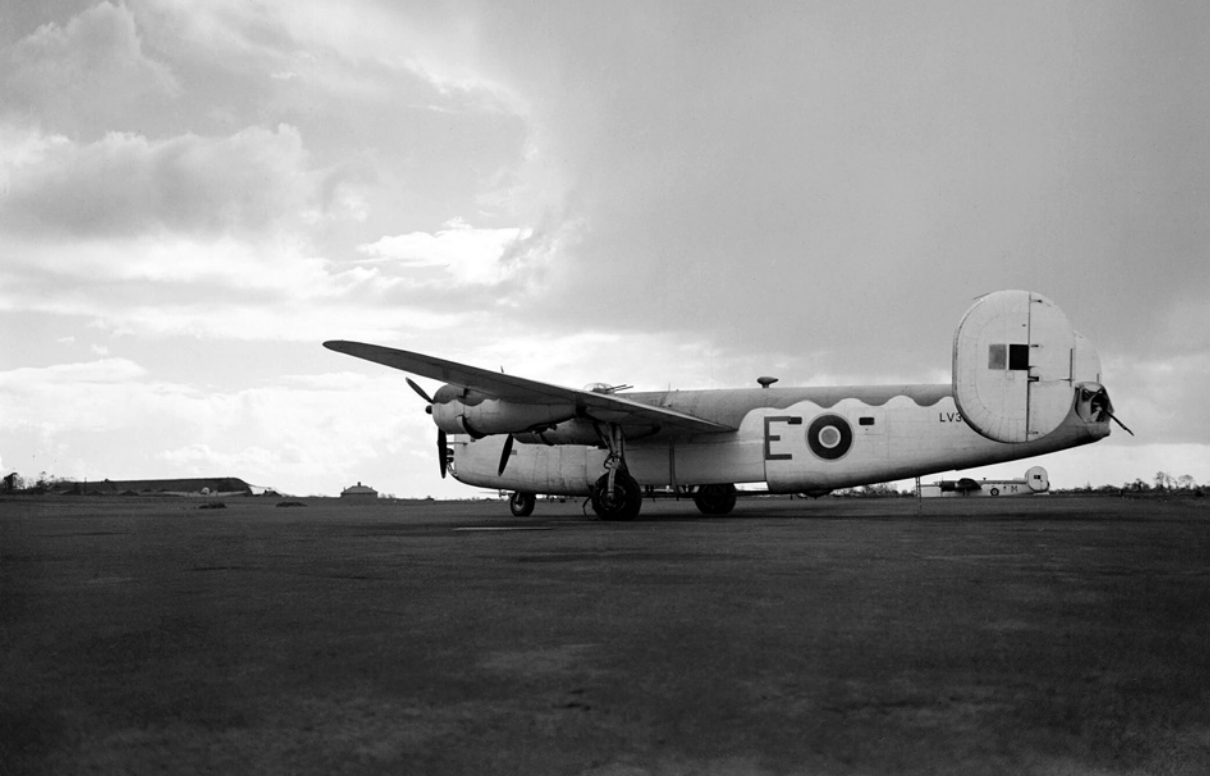
Consolidated Liberator GR Mk.IIIA (LV345 „E“) od 86. perutě RAF na letišti Aldergrove (Zdroj: Wikimedia Commons).