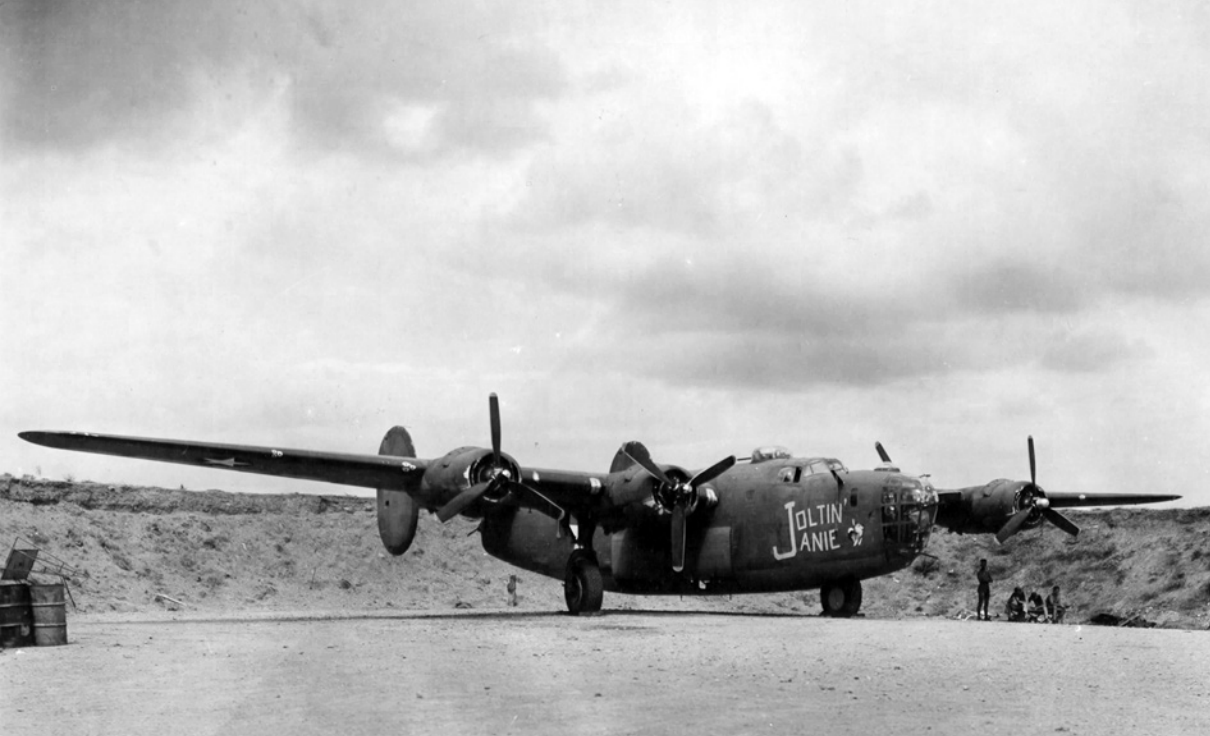
Consolidated B-24D Liberator (s/n 42-40065) pojmenovaný Joltin' Janie od 403. perutě 43. bombardovací skupiny na Nové Guineji v červnu 1943.

na bázi B-24D, J, L nebo M. Jejich počty v hodnotě stovek strojů jsou zahrnuty v níže uvedeném přehledu letounů sériové výroby: