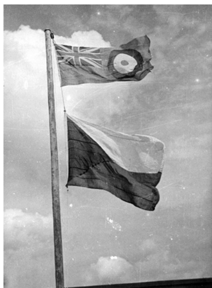
Vlajky britského Královského letectva a Československé republiky na základně Beaulieu v létě 1943.

ská jednotka operačního výcviku No. 1 (Coastal) OTU přímo na základně Beaulieu. Dne 2. června byl stávající personál perutě rozdělen do dvou letek („A“ a „B“), každá po devíti kompletních osádkách o osmi lidech, navíc u letky „B“ byly zařazeny další tři nekompletní osádky. Výcvik probíhal zpočátku na letounech britské No. 1 (C) OTU, ale od druhé poloviny července již převážně na vlastních strojích perutě, neboť do konce tohoto měsíce jednotka obdržela již všechny letouny Liberator podle tabulkových počtů, tj. celkem 15 strojů, z toho 12 operačních a 3 výcvikové (podrobný seznam uveden v příloze 2).