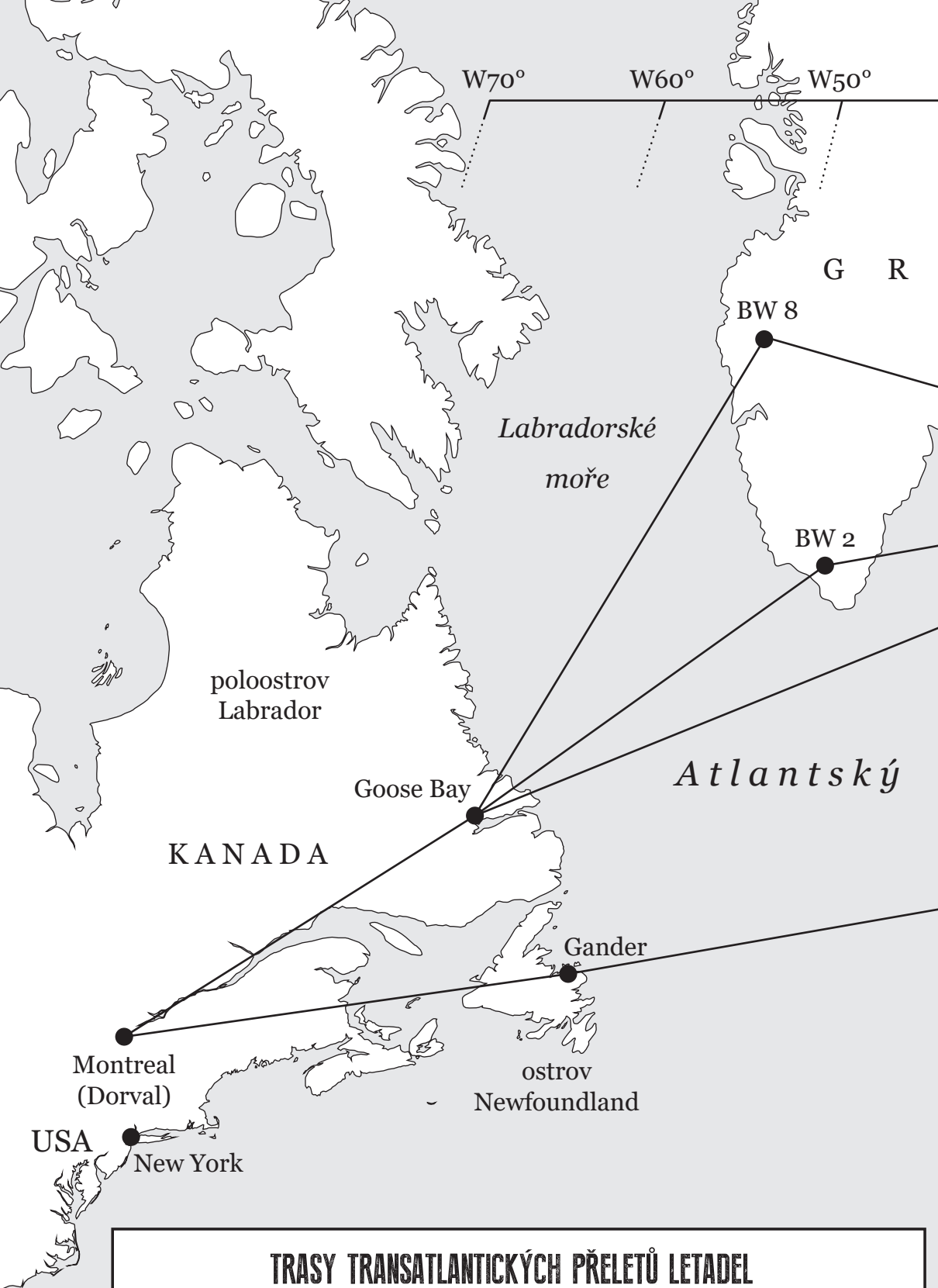
TRASY TRANSATLANTICKÝCH PŘELETŮ LETADEL ZE SEVERNÍ AMERIKY DO VELKÉ BRITÁNIE BĚHEM DRUHÉ SVĚTOVÉ VÁLKY