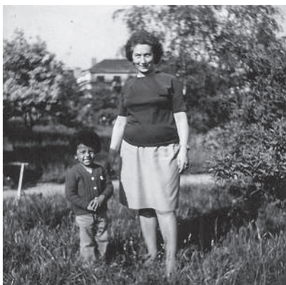
Jako malý chlapec na procházce s babičkou.

odkud jsou rodiče, a když jsem řekl, že maminka je Češka a otec je z Ghany, tak se tam probouzela zvědavost. Když se mě ptali, jak jsem se ocitl tady, vysvětlil jsem jim, že otec tady studoval a oženil se s maminkou. Potom už jim ten příběh dával smysl.