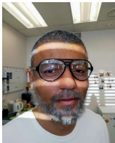
V maskérně při přípravě na natáčení pořadu k 25. narozeninám TV Nova.

Vím, že tam mám dost příbuzných včetně pěti nevlastních sourozenců, se kterými jsem v kontaktu. Tím, že si občas napíšeme, objevujeme na dálku jeden druhého, ale není to rodina ve smyslu společných zážitků. Rodinu netvoří krev, nýbrž společné zážitky, a my je nemáme. Nechci, aby to vyznělo tak, že Afriku nějak zapírám. Zprvė ani nemůžu a zadruhé to tak není, ale kdybych já tam přijel, tak to bude, jako by tam přijel regulérní Evropan, který se bojí hadů, lvů a komárů, a vůbec bych nevěděl, jak se tam pohybovat nebo žít.