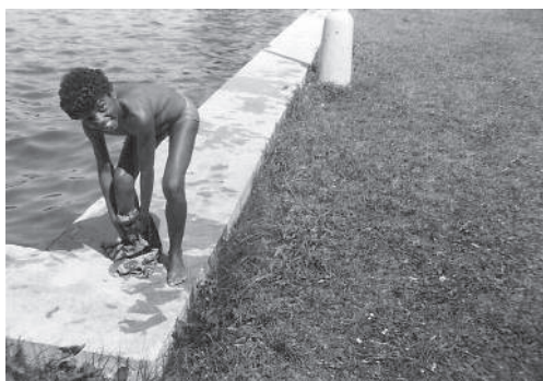
V 80. letech, na koupališti.

z pohledu tehdejšího Československa, odkud se lidé dostali nejdál do Jugoslávie, to bylo strašně zajímavé. Vlastně byli překvapení, proč se vrátila, protože z Ghany mohla odletět do západní Evropy nebo kamkoliv by chtěla. Nemusela se vracet do Československa.