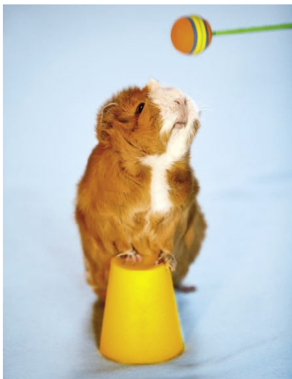
Morčátku přináší hravý kliktrénink spoustu radosti a rozptýlení.

Díky tomuto poznatku se vztahy mezi trenéry a jejich zvířecími cvičenci nesmírně zlepšily. Zvířata už se necvičila jen pro lidské účely, ale při tréninku se bral zvýšený ohled i na jejich potřeby . Ukázalo se, že kliktrénink jakožto smysluplná zábava může hravou formou přispět ke zlepšení soužití člověka se zvířaty.