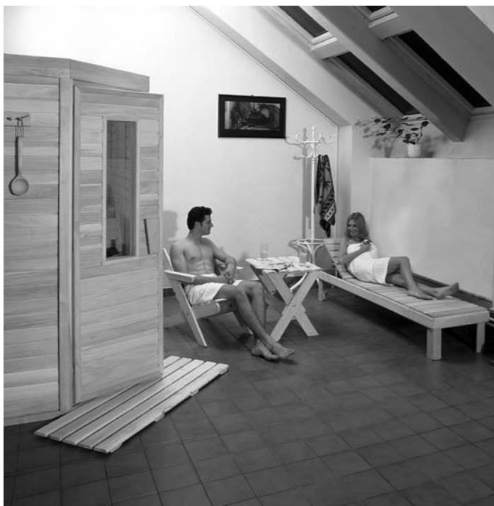
Pohoda v sauně

Pojem „sauna“ známe takřka všichni a v různých obměnách jej často používáme. Co se ovšem skrývá pod tímto pojmem přesně a jak bychom ho měli nejlépe chápat a přijímat? Podívejme se nyní na několik možností, které charakterizují slovo sauna. Uvedeme několik důvodů proč se vlastně saunovat a zda je lepší saunování doma nebo ve veřejné sauně.