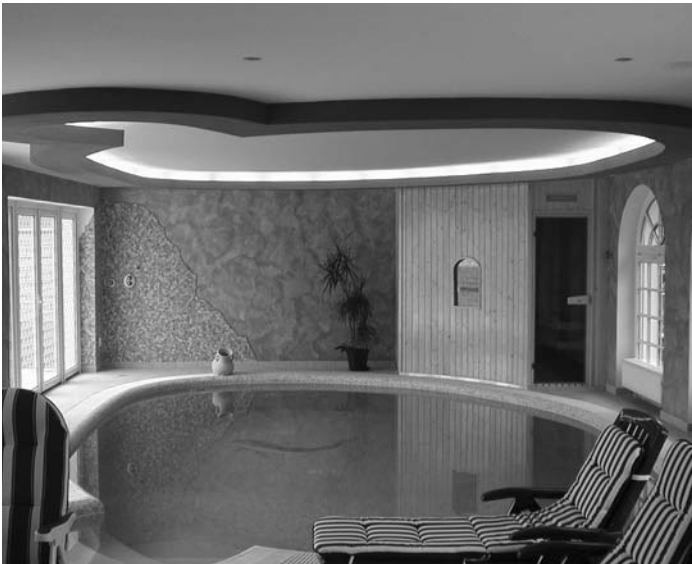
Domácí sauna u vnitřního bazénu

A jak je to s domácí saunou? Možnost mít saunu doma je samozřejmě značně pohodlnější variantou. Můžeme saunu navštívit kdykoliv se nám zachce, nastavíme si příjemnou teplotu (ideální pro společné saunování s dětmi), nemusíme se před nikým stydět a můžeme se v naší sauně chovat, jak chceme. Domácí sauna je také příjemná pro společné saunování párů, které je sice ve veřejných saunách také možné, ale naše něžnější polovičky se většinou nerady vystavují pohledům cizích očí.