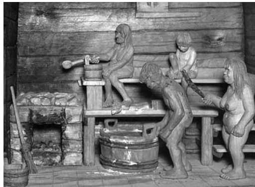
Z historie sauny

Také severoameričtí indiáni budovali potní chýše ve stanech z bizoních kůží s dřevěnou kostrou. Mnohde se bičovali metlami a proceduru vždy končili koupelí ve studené vodě. Eskymáci využívali naopak ke koupeli horké termální lázně.