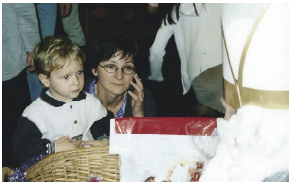
Jeden z prvních kontaktů malého Creepa a Mikuláše.

Když jsme se jednoho dne vraceli se školkou z venkovní procházky, otázel jsem se paní vychovatelky, jaká krmě se bude servírovat ku obědu. Hlasem staré harpyje, kterou paní vychovatelka byla, mi bylo odpovězeno, že buřt. Což byla jediná potravina, ke které mělo mé tělo averzi. U oběda jsem se tuto informaci snažil harpy... pardon, paní vychovatelce vysvětlit, bylo mi ale řečeno, že sním alespoň pár soust. A tak jsem, po pokusu zkonzumovat jeden kousek onoho buřtu, ozdobil obsah svého žaludku celý stůl. Od té doby jsem již do školky nemusel. U maminky totiž bylo nucení dítěte do jídla na úrovni týrání, neboť si prošla podobnou situací. Ale o tom více pojednává mé video ZVRACEL KVŮLI UČITELCE.