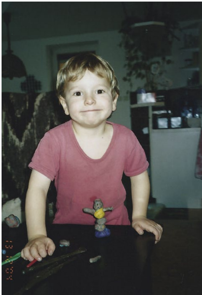
Malý Creep je hrd a pyšen na svůj výtvar z plastelíny.