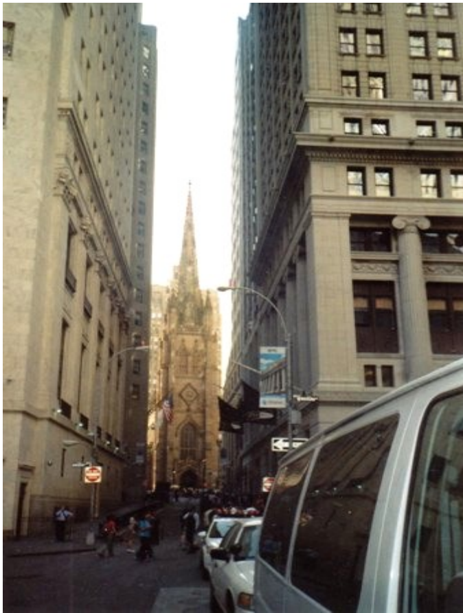
Novogotický kostel Trinity Church

obrovská díra oploceného stanoviště. Jsou tu i vyklizené prostory po spadlém hotelu Marriot a dvou dalších budovách. Dnes se toto místo nešťěstí nazývá „Ground Zerou“, což volně přeloženo znamená Místo nebo Bod nula. Newyorčané zde chtějí postavit jako symbol nezdolnosti nový mrakodrap, který by měl svou výškou Americe vrátit ztracený světový primát. To se jim ale těžko podaří, protože nejvyšší budovu s 509 metry v Taipei na Tajvanu už dnes překonává šejky budovaný mrakodrap v Dubaji. Ten má „prozatím“ 555 metrů z projektované výšky 800 metrů o 161 podlaží. V roce 2009 se má vedle Burj Dubai začít stavět další nový mrakodrap Al-Burj, který má mít dokonce 228 podlaží a výšku 1200 metrů. Al-Kajda se má na co těšit!