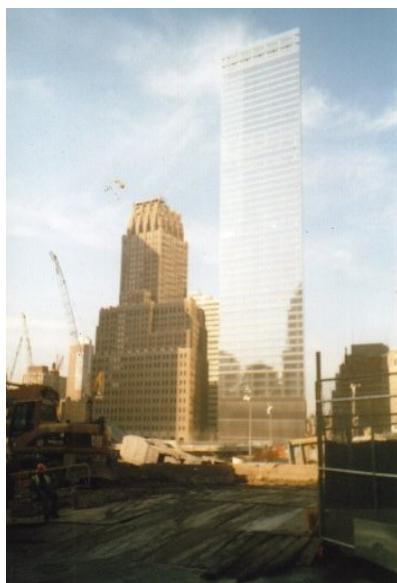
Staveniště „Ground Zerou“

V ulici u plechové ohrady „Ground Zero“, kde se zvedají vysoké jeřáby a pletivovou bránou vjíždějí a vyjíždějí obří nákladáky, je malá požární stanice. Za otevřenými vraty jsou na stěně nad nablýskanou chromovou helmou a květinami umístěny dvě zasklené fotografie. Jsou to dva hasiči, kteří s dalšími svými newyorskými kolegy zahynuli při záchranných pracích v hořících a sesouvajících se věžích Světového obchodního centra. Postál jsem tam chvíli a přitom si vzpomněl na jednoho chlápka, který je prototypem postkomunistických poměrů u nás. Dostavil se na kole k mému domu, protože ho iritovala moje propagační skříňka s volebními materiály (byl jsem v tu dobu lídrem Pravého Bloku za jihočeský kraj). Přijel mi sdělit, že po zářijové události Američané uváděli, že obětí může být až 50 000, ale že jich nakonec bylo „jen pouhých“ 3000. Nechápu, že jsem mu nenatáhl hned jednu na čumák!