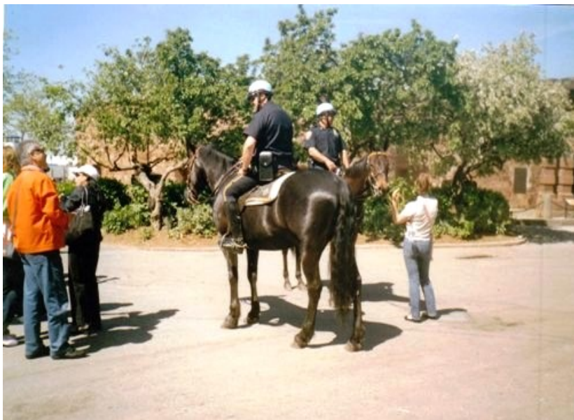
Newyorská jízdní policie

berty. Policisté nakonec nad tím zbrojním šidítkem mávli rukou. Uniformovaný černocho, hlídající indiánské sbírky, byl ale jiného názoru.