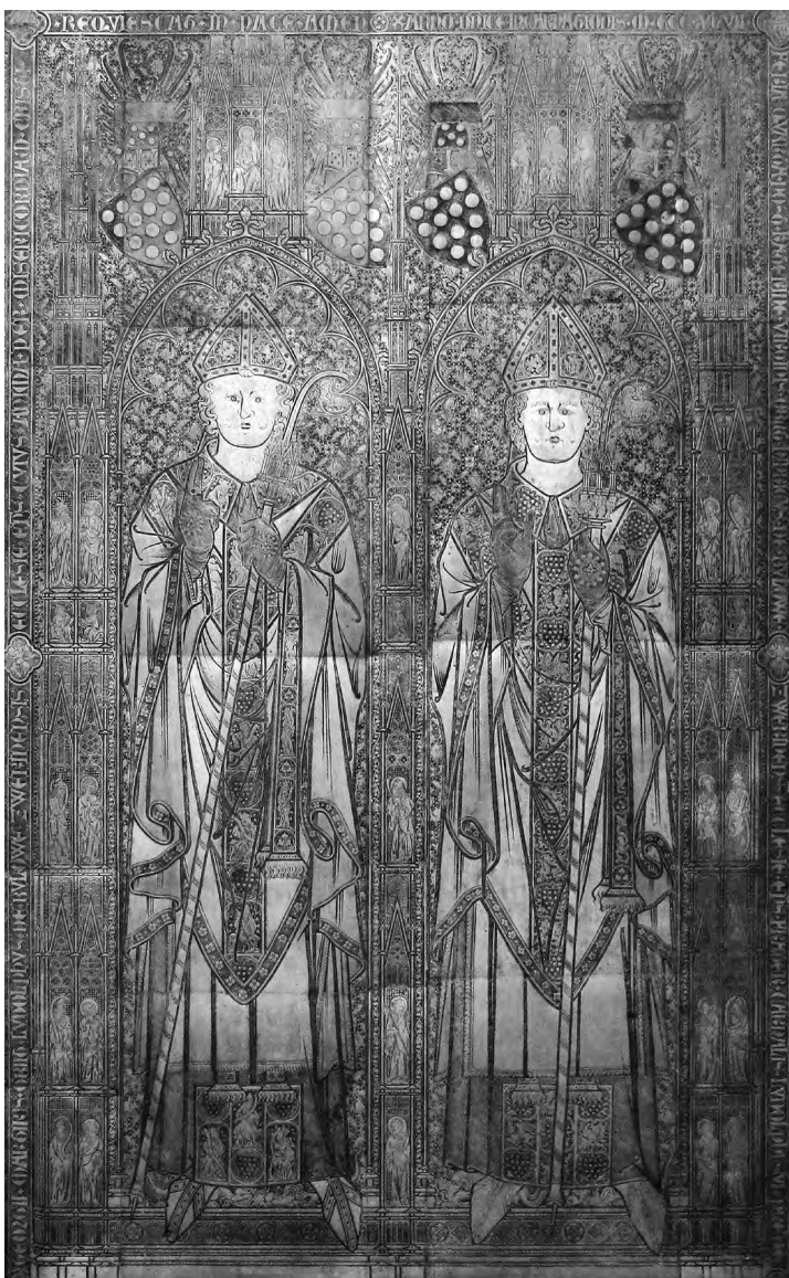
9. Bronzová náhrobní plaketa rodu z Bülowa zhotovená ve Vlámské dílně kolem roku 1400 zobrazuje postavy biskupů Gottfrieda (†1314) a Vickona (Friedricha II.) z Bülowa (†1375).