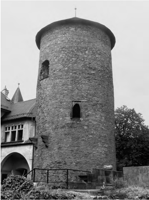
3. Nejstarší dochovaný pozůstatek původního šternberského hradu, věž.