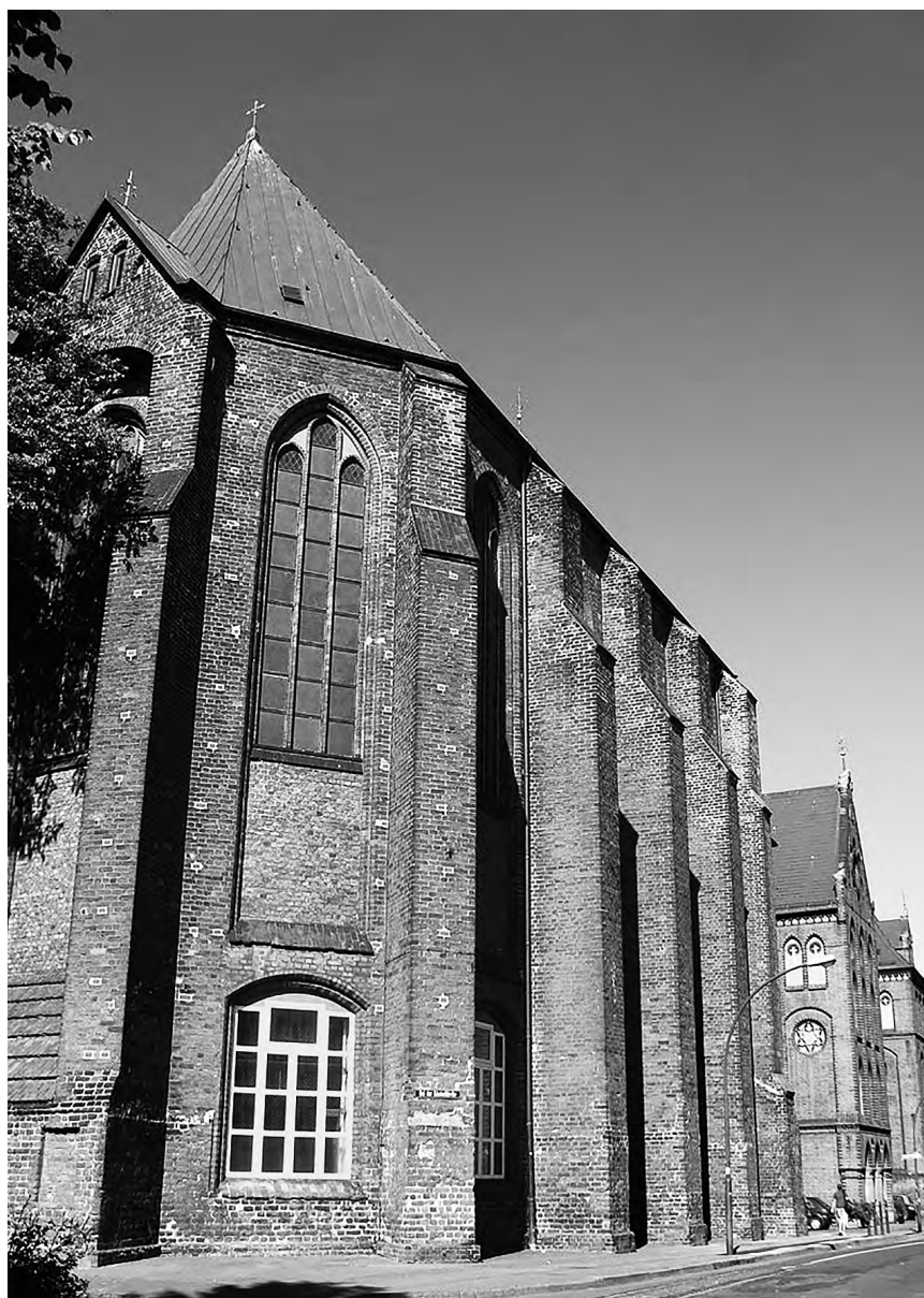
4. Chór kostela bývalého kláštera dominikánů ve Wismaru.