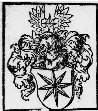
1. Znak rodu Šternberků.