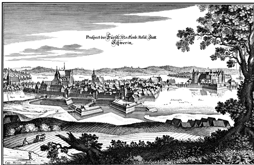
A. Das Richtig d'elge . C. Kirche auf der Höhe . E. Der Bischof's Log . G. Richtiges Badst . I. Großer Hoff . K. Die Mühle . L. Mitten Thor . N. Brücke nach der Stadt B. Die Hund Kirche . D. Das Rathhaus . F. Eigentliche Casteley . H. Das Kornlag . K. Die Mühle . M. Schmiede Thor . O. Brücke nach dem Lustgarten.

10. Zvěřín v polovině 17. století na vedutě Matthäuse Meriana.