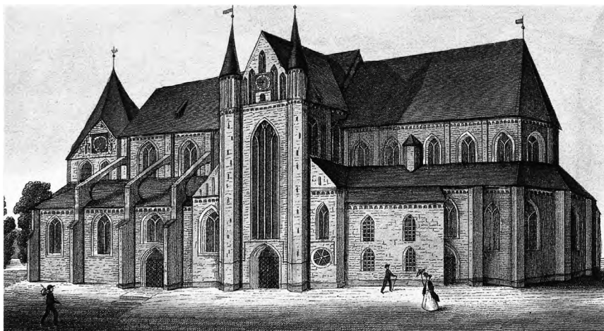
7. Zvěřínská katedrála před rokem 1888. Pohled z jihu.

z Bülowa ustanovil nové exekutory – biskupy olomouckého a lübeckého a pražského arcijáhna. Papež okupantům hrozil zabavením církevních a světských beneficí a v případě nutnosti také zásahem světské moci. Co je však důležité, opět hrozil církevními tresty, nicméně současně s tím zneplatnil dokument svého předchůdce Klimenta V. (+1314), který měl stanovovat, že kurie nemůže postihnout příslušníky rodu z Bülowa církevními tresty. 100 Toto byl podle všeho hlavní trumf v rukávech členů této rodiny. S odkazem na výše uváděnou imunitu Klimenta V. zkrátka veškeré církevní tresty prohlašovali za neplatné, což však už nadále nebylo možné.