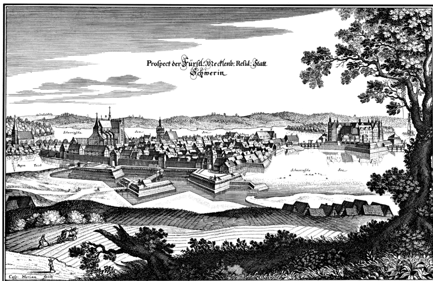
A. Das Richtig Schloß . . . C. Kirche nach der Schule . . . E. Der Bischofs Saal . . . G. Ritters Baustall . . . I. Großer Markt . . . K. Die Mühle . . . M. Mühlen Thor . . . N. Brücke nach dem Schloss . . . B. Die Hund Kirche . . . D. Das Rathhaus . . . F. Eigentliche Capelle . . . H. Das Kornhaus . . . L. Die Mühle . . . O. Brücke nach dem Lustgarten . . .

10. Zvěřín v polovině 17. století na vedutě Matthäuse Meriana.