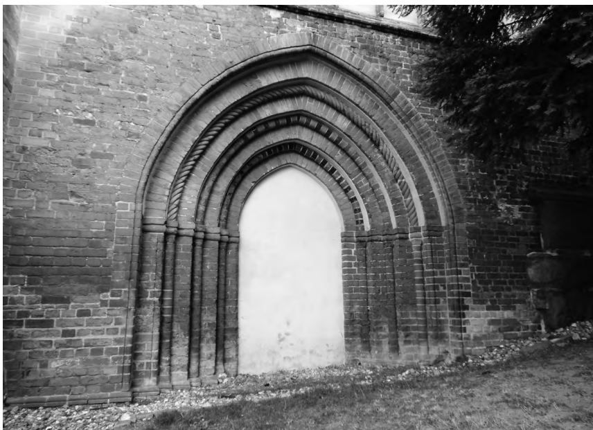
8. Dnes zazděný původně gotický portál na jižní straně zvěřínské katedrály.

z Bülowa po veřejném vyhlášení tohoto mandátu neodevzdají ve stanovené lhůtě zabrané majetky, budou veřejně exkomunikováni a stihnou je i další církevní tresty, a to včetně všech, kteří by jim jakkoliv pomáhali či s nimi spolupracovali (což se týkalo i církevních institucí – např. kapitul – které mohly být v takovém případě stiženy interdiktum). Případná exkomunikace měla být vyhlášena veřejně v kostelích příjemců tohoto mandátu, hlasitě a srozumitelně, a to v době mezi mší a nešporami, kdy bývá v kostele nejvíce lidí. Vše se mělo dít za zvuku zvonů a s rituálním zažehnutím a následným uhašením svící. Pokud by toto nebylo možné vyhlásit v kostelích zvěřínské a lübecké diecéze, měla se zde informace o exkomunikaci ohlásit jiným způsobem – veřejně v lidovém jazyce, aby jí rozuměli i laikové. Papež příjemce upozornil, že v takovém případě mají ignorovat prohlášení příslušníků rodu z Bülowa o jejich imunitě vůči