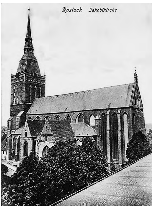
5. Kostel sv. Jakuba v Rostocku kolem roku 1920. Kostel byl zcela zničen v průběhu druhé světové války.