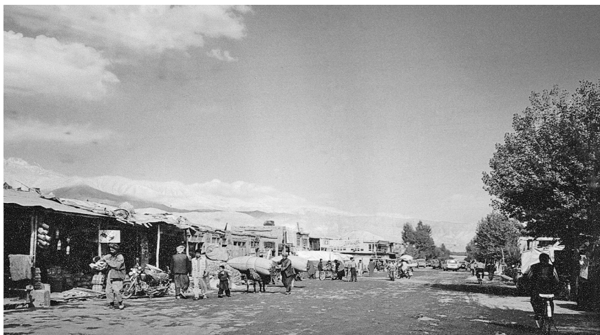
Hlavní ulice Bamjānu. Metropole stejnojmenné provincie v centrální oblasti Afghánistánu, kterou se Sovětům nikdy nepodařilo ovládnout

Mají výrazně mongolské rysy, čímž se na první pohled liší od většiny ostatních Afghánců. Jedna z teorií říká, že jde o potomky vojáků Čingischána, kteří se při tažení mongolských vojsk ve třináctém století smísili