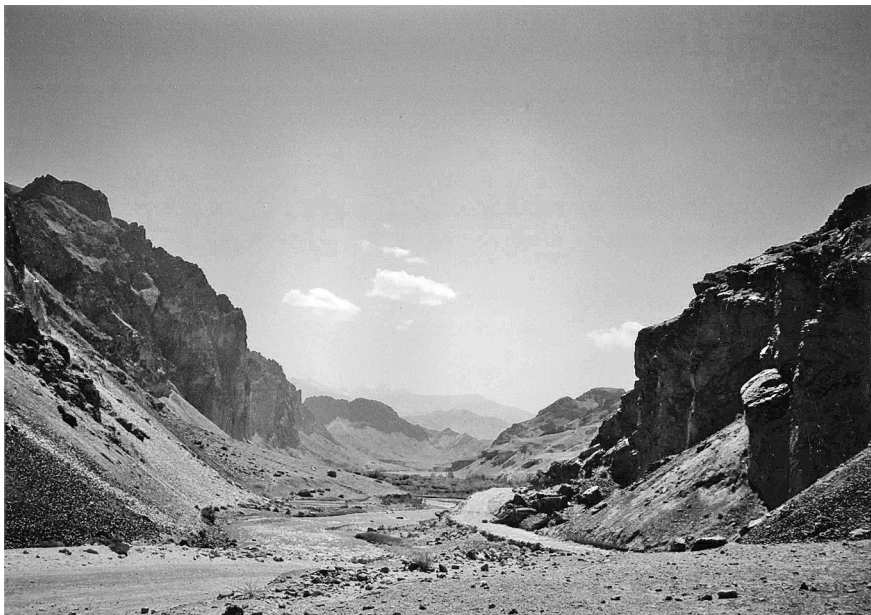
Cesta vedoucí z Kábulu do centrálních oblastí země

Středním Afghánistánem ve směru k Šibárskému průsmyku ve výšce tři tisíce metrů jsem projížděl v roce 2005, ale datum vlastně není důležité, protože s výjimkou větších měst a některých pohraničních oblastí se v této zemi za poslední desetiletí přes opakovanou výměnu různých politických režimů zase tak mnoho nezměnilo. A někde možná ani za staletí.