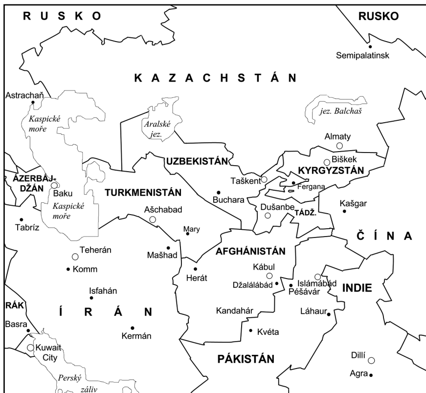
Afghánistán a okolí

Afghánistán je v mnoha ohledech směsicí. Geograficky: na severu jsou v zimě tuhé mrazy, přívaly sněhu i ledu a nesjízdné cesty. Na jihu