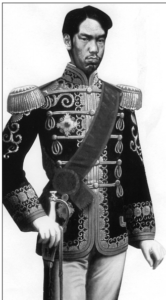
Japonský císař Mucuhito

V 70. letech devatenáctého století se o slovo v boji o Čínu začalo dravě hlásit Japonsko. Jelikož se v jižních oblastech čínského území nemohly jeho zájmy kvůli francouzské a britské přítomnosti nijak uplatnit, bylo