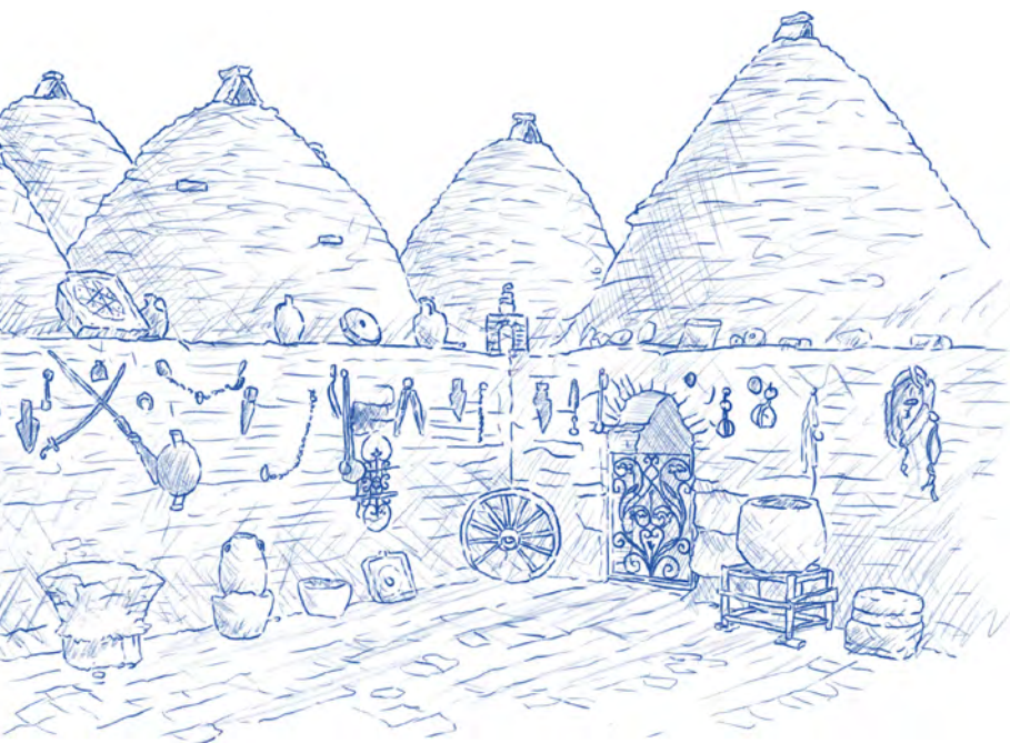
Ve městě Harran domy připomínají včelí úly

nepotkáváme žádné vojenské hlídky, žádné kontroly. Život zde plyne úplně normálně, podél silnice děti sbírají bavlnu, která se zde hojně pěstuje a bílé chomáče se povalují skutečně všude. „Je to jejich jediný příjem. Sbírají bavlnu, která za jízdy odletí z nákladních aut, a tu pak prodávají,“ ukazuje nám náš dnešní společník, který je jedním ze zaměstnanců ve firmě Fevy.