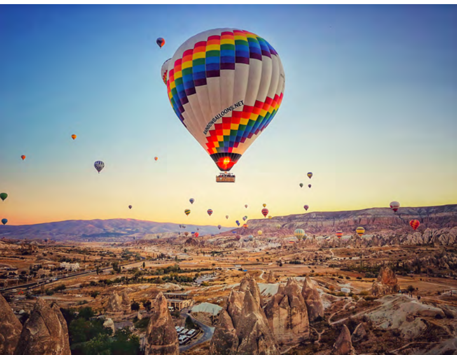
Ranní balónová show nad pohádkovou Kappadokií

Z Kappadokie se již sám vydávám opět stopovat a popravdě se na to neuvěřitelně těším. Uprostřed Turecka stojím u krajnice a doslova slyším tlukot svého srdce. Jsem ve stopování ještě nováčkem a mediální masáž v Česku o tom, že jsou muslimové nebezpeční, je opravdu veliká. Nevím, co mě čeká, ale těším se na to! Směřuji nejdříve do města Adana, odkud pochází asi nejznámější turecké jídlo, takzvaný Adana kebab. Zastavuje mi pán, jehož jméno si již nevybavuji, ale pro mou cestu byl zajímavý ze dvou důvodů. Především byl Kurd, takže jsme si několik hodin povídali o jeho národu, tradicích, ale i o tom, jak jsou ze strany tureckých orgánů Kurdové utlačováni. Toto je po celém Turecku velmi třaskavé téma. Pokud se bavíte s etnickými Turky, automaticky vám řeknou, s hněvem v očích, že žádný Kurdistan neexistuje a že Kurdové jsou teroristé.