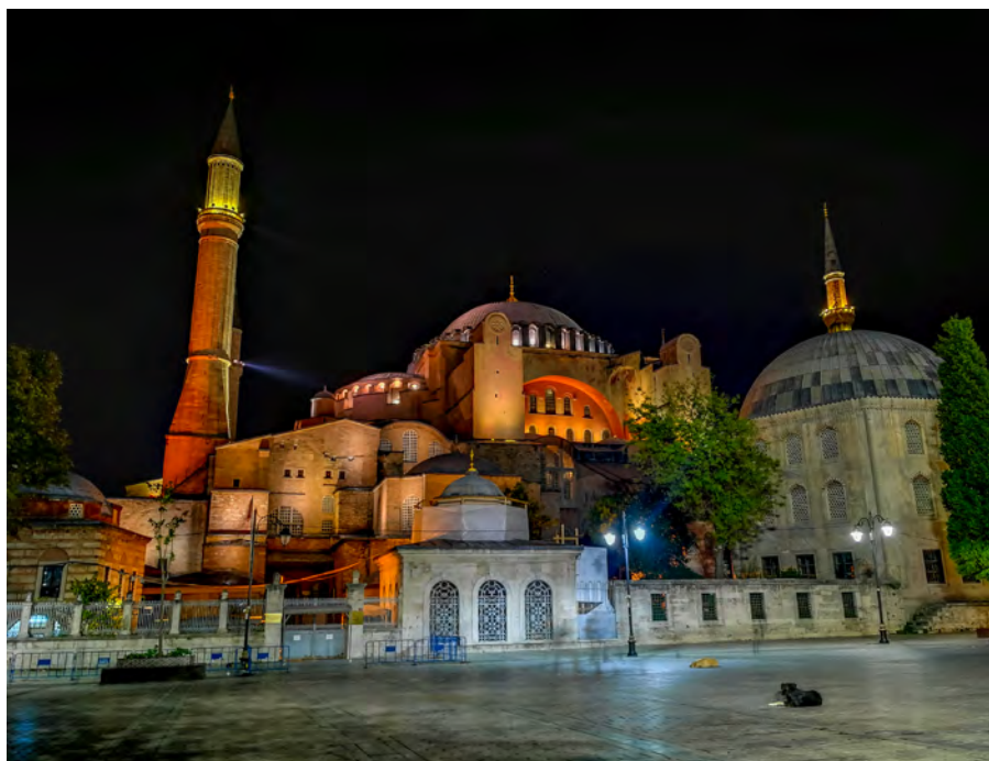
Mešita Hagia Sofia byla původně křesťanskou svatyní