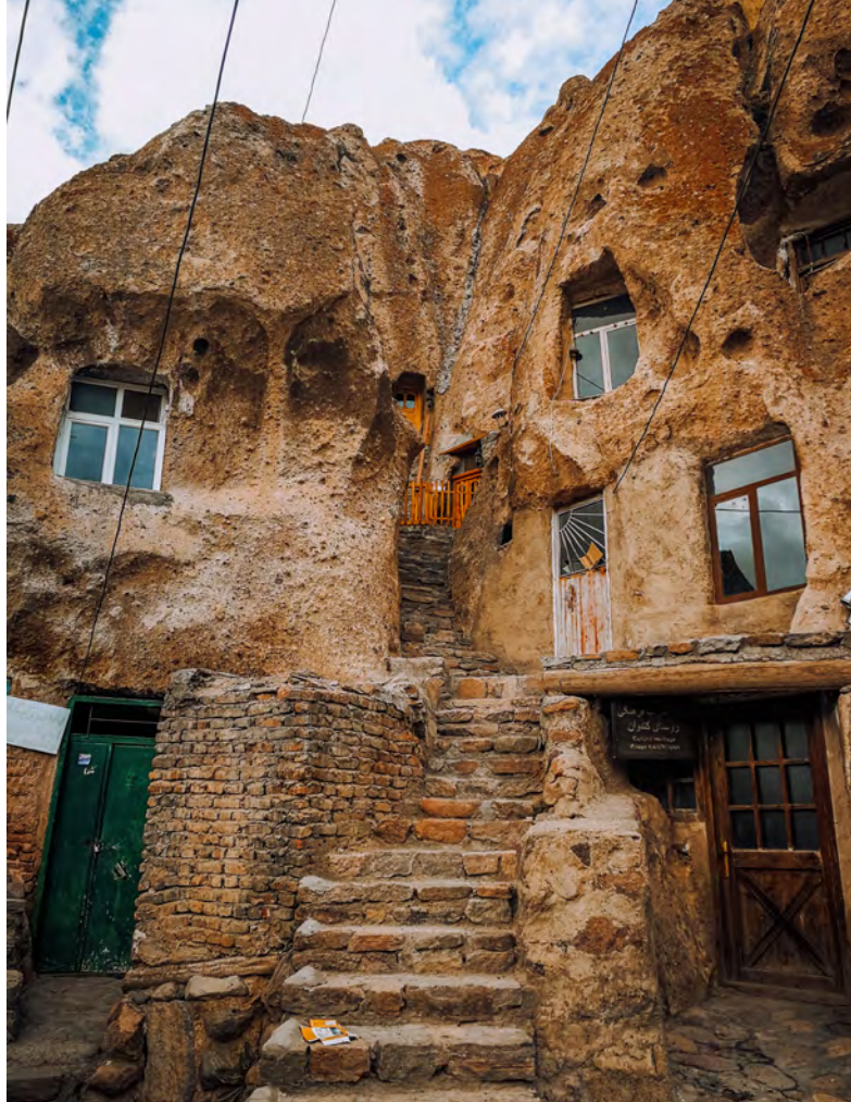
Ve vesnici Kandovan lidé vytesali své domy do skály

Mám pro sebe celé patro rodinného domu. Na mé poměry až moc velký luxus, ale jsem tu první den, čeká mě rozkoukávání se po zemi, která nemá ve světě vůbec dobrou pověst. Díky synovi majitele studujícím angličtinu je komunikace snazší a já se v meziřeči zmíním, že mám hlad a zdali by mi mohli poradit, kam bych se mohl jít najíst. Majitel neváhá ani vteřinu a ochotně přistavuje automobil. Zaveze mě pryč do nedaleké