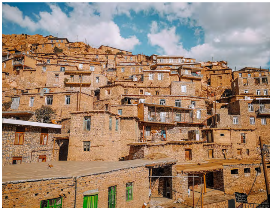
Kurdská vesnice Palangan je postavena v hlubokém údolí a střecha jednoho domu mnohdy tvoří terasu jiného domu

Skvělé místo k odpočinku, kde si mohu konečně něco přečíst o zdejší oblasti, o íránských Kurdech a možná i trochu dospat minulou noc. Až do doby, kdy se kolem mě prohnilo deset naprosto našťvaných psů, jsem si říkal, že by to bylo skvělé místo na přespání. Naštěstí si mě nevšimli, honili kočku, ale já věděl, že tady asi dnes spát nebudu. Z polodivokých psů mám prostě respekt. Pokud je jeden, dá se mu ubránit, ale pokud jich je víc, těžko bych je odradil.