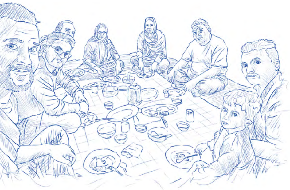
První večeře u iránské rodiny

své cesty jsem pak obědval, večerel nebo jen tak popíjel čaj v desítkách iránských domácností, ale to své „poprvé“ si zapamatujete vždy a má to takovou kouzelnou atmosféru.