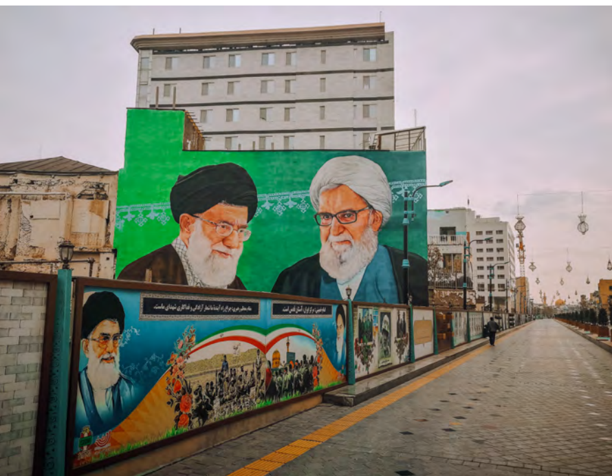
Fotografie ajatolláhů jsou v Íránu doslova na každém kroku

informace z médií. I já byl, dalo by se říct, zmanipulován a svojí cesty do Íránu jsem se na jednu stranu velmi bál, na druhou stranu jsem se tam neuvěřitelně těšil. Myslel jsem, že měsíc mi bude stačit, ale moje putování po Íránu bylo, jako když naskočíte do rozjetého vlaku a vezete se tak dlouho, dokud to jde!