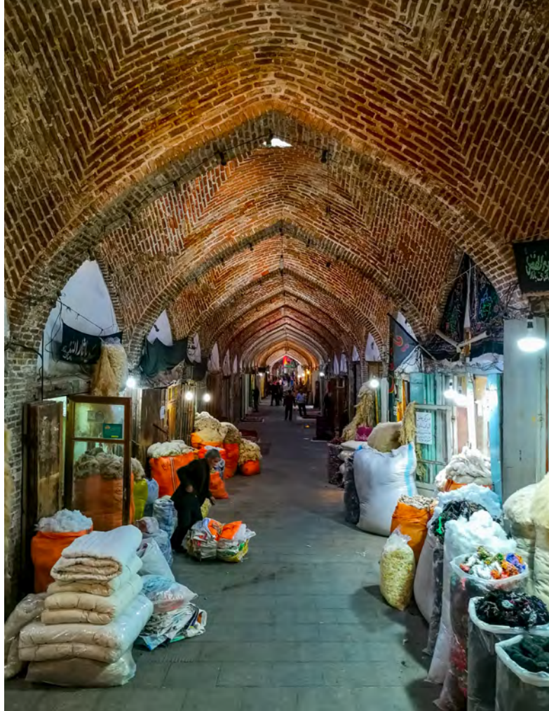
Tržiště v Tabrizu je jedno z největších na světě

schovanou pod spodním prádlem a riflemi, vytahují dvě stě dolarů. Jenže právě ono malé otočení se stranou, to malé nejisté zaváhání podpořené strachem, zapříčinilo, že se náš chlapík vylekal a vše si rozmyslel a utekl. Zřejmě si myslel, že na něj vytáhnou odznak nebo pistoli nebo neví, asi se to nikdy nedozvím. Nemusíme ale nikam chodit, ihned si nás všimnou další. Jsem zde jediný turista, takže se na nás začínají slétat „makléři“