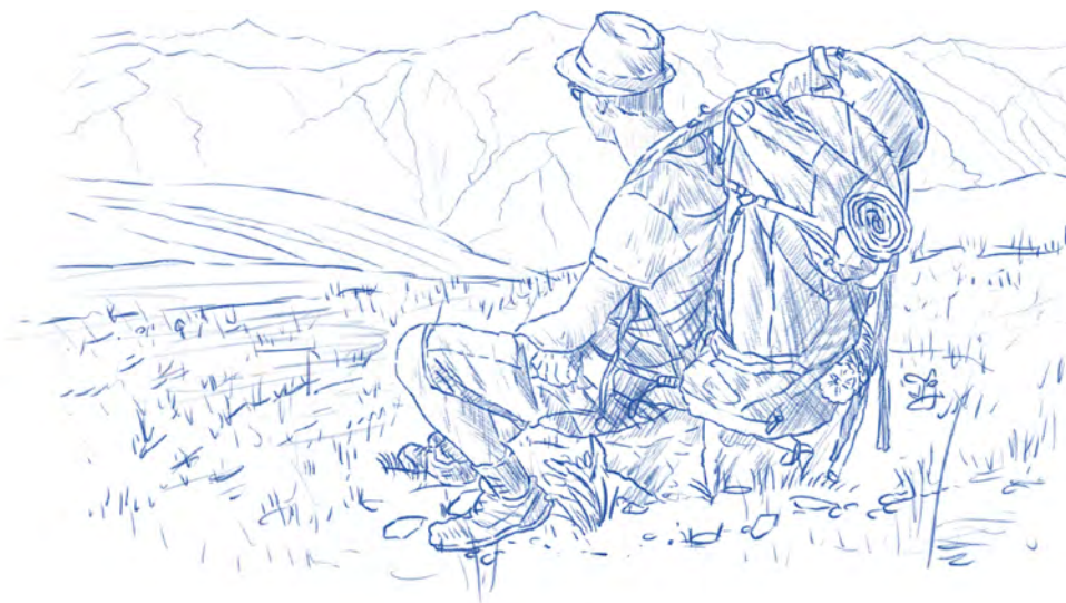
Uprostřed Kavkazu s dvacetikilovým batohem

spal v křesťanském klášteře nebo u místních pastevců, jsem chtěl pěšky dojít i do asi nejvýše položené evropské vesnice Ushguli v oblasti zvané Svanetie, která je nazývána nejkrásnějším regionem Gruzie. Zdejší oblast je proslulá vysokými horami Kavkazu, do nichž jsou zasazené malé vesničky s typickými vysokými věžemi, které ve středověku sloužily k obraně proti nájezdníkům. Jako by mi nějaký tajemný hlas říkal, že do hor nemám chodit sám, domluvil jsem se s kamarádem Petrem, že za mnou přiletí a pětidenní cestu horami projdeme spolu. Petra znám již delší dobu a měli jsme za sebou i několik výletů, takže jsme byli sehraní a nic nebránilo tomu, abychom společně prozkoumali gruzínskou část Kavkazu.