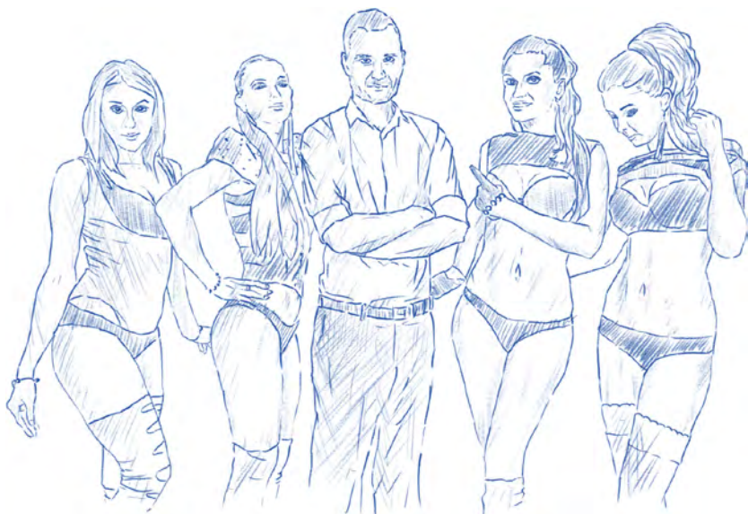
Život v obležení žen

z pražských hudebních klubů. Následujících několik let jsem byl doslova nezastavitelný a peníze se hrnuly ze všech stran. Jenže jak už to bývá, peněz není nikdy dost, takže můj klasický den vypadal tak, že jsem přes den pracoval v kanceláři v marketingové firmě, poté šel do klubu na pracovní schůzky s managementem nebo business partnery a v noci jsem chodil hrát do klubů jako DJ. Domů jsem přišel někdy kolem třetí nebo čtvrté hodiny ráno a v osm jsem zase vstával, abych šel do kanceláře. O víkendech odpadla alespoň práce přes den, ale i tak jsem se moc nevyspal. To víte, večírky v Praze se dokážou protáhnout přes celý víkend. Takto dokola několik let až na hranici psychických a fyzických sil. V takovém pracovním zápřahu v podstatě nemáte ani šanci se s někým seznámit. Dívek a žen mi v tu dobu prošly postelí desítky, možná stovky, ale kdo by vydržel s klukem, který má volnou jen neděli odpoledne? Nikdo. Jen si užít a už se nikdy nevidět!